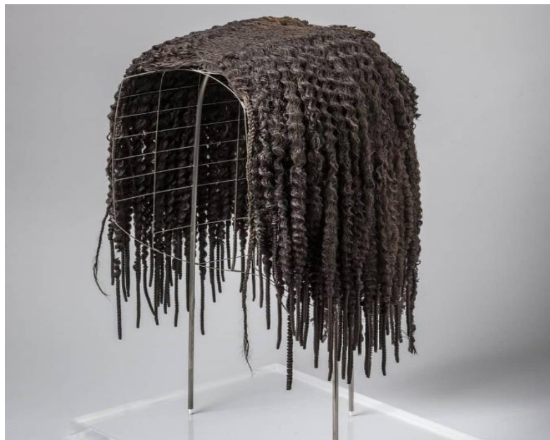
Fig.1 -Peruca masculina, museu Egito Torino 1425–1353 a.C

As tranças também foram usadas por homens em algumas regiões da África, segundo Andrade (2021). Os homens do tempo de Cleópatra, por exemplo, trançavam a barba para indicar proximidade, proteção das divindades mitológica. Ainda segundo Saiumbo e Rocha (2017) “alguns achados arqueológicos também dão conta de que o modelo de peruca, já descrita por Heródoto, hoje exposta no Museu Egípcio do Cairo, (uma peruca em estilo “duplex”, dividida em duas partes entre lã e cabelo humano, datada do século XIV a. C.), é típica para oficiais do sexo masculino” (2017, p.44). Uma outra peça (peruca) se encontra no Museu Egípcio Torino, datada do período do Novo Reino, Décima Oitava Dinastia, 1425–1353 a.C, também nos mostram que as tranças de alguma forma já estava presente a vida dos povos antigos.