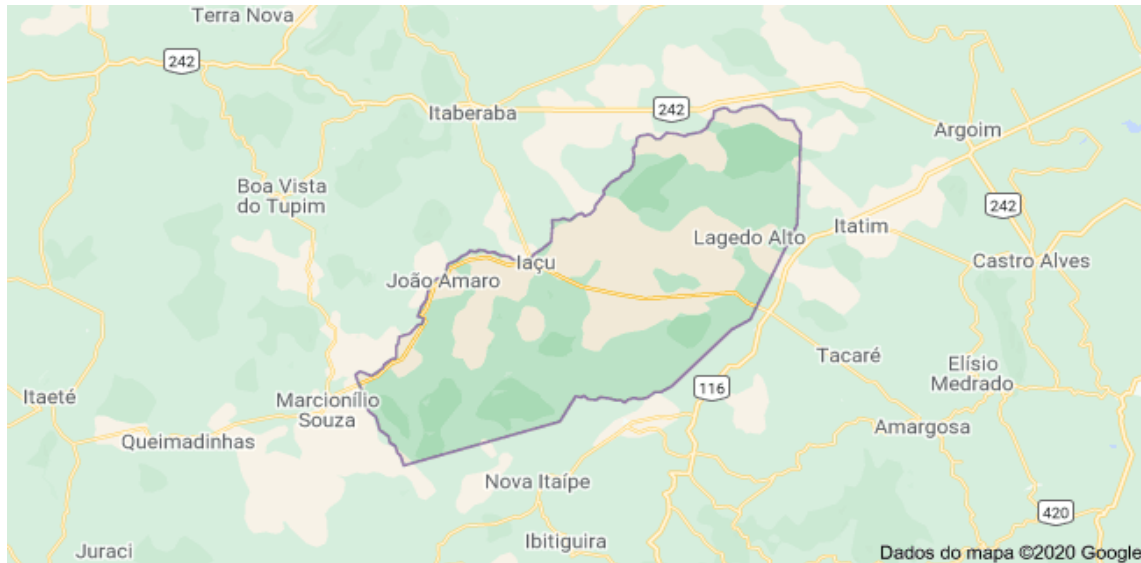
Figura 1: mapa da região onde está localizada a cidade de Iaçú