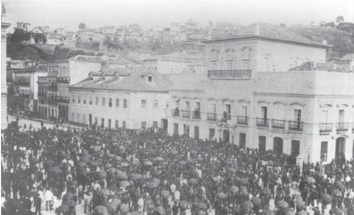
Foto 16 : Festa no Rio de Janeiro na praça Central, dia 13 de Maio

Precisamos entender que esse processo da abolição é um acontecimento histórico para a nossa construção como seres humanos de modo geral tanto para negros, quanto a população brasileira. Uma conquista social, entretanto houve ainda um processo de construção social para os negros após as festas e m comemoração a sua alforria. Era sua inserção na sociedade brasileira.