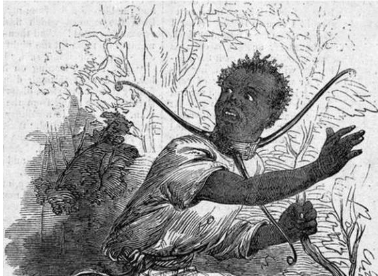
Foto 11 : Instrumento de tortura conhecido por “Colar de pescoço”