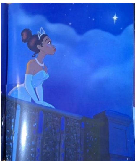
Ilustração 2 – A Princesa e o Sapo, o sonho de Tiana.