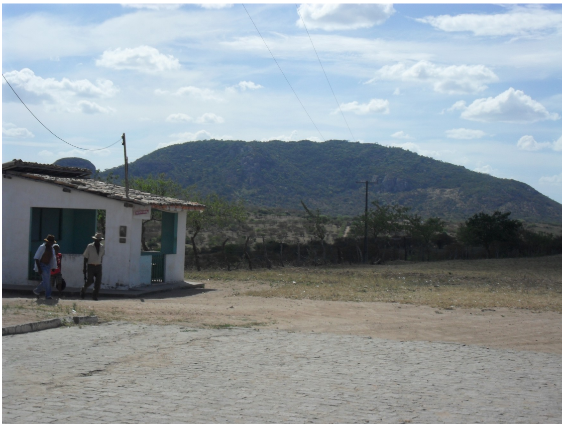
Figura 4 – Casa da roça na Fazenda Boa Vista