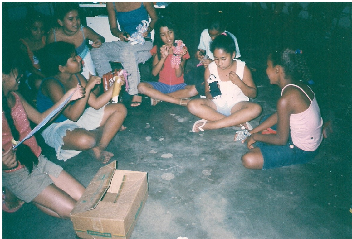
Figura 9 — Alunas fazendo bonecas de pano na sala de aula.

A relação do estudante negro da roça com a escola, em Santa Bárbara, é marcada por uma dualidade que nos leva a pensar essa instituição educacional de forma bidimensional. Se, por um lado, a escola impõe normas, um currículo que ignora a cultura desses sujeitos, por outro, a experiência vivida destes leva-os a romper silêncios, a reconstruir o espaço educacional, a reinventar o ensinar e o aprender, fazendo da escola um espaço contestado. Contudo, se na prática cotidiana a escola experimenta essa dualidade, no que diz respeito a sua formatação, ao seu projeto educacional, ela se mostra impositiva, universalista, homogeneizadora, colonizadora. A resistência cultural que ali se verifica não rompe com esse projeto excludente que transforma os diferentes em deficientes. Através de um processo educacional que dicotomiza ensinar e aprender, a escola reproduz um conhecimento alheio ao(à) estudante negro(a) da roça, à sua cultura. Arrogante decide, através de rótulos, estereótipos, classificações, quantificações, quem são os capazes e os incapazes; quem se tornou cidadão civilizado e quem ficou de fora desse processo civilizatório.