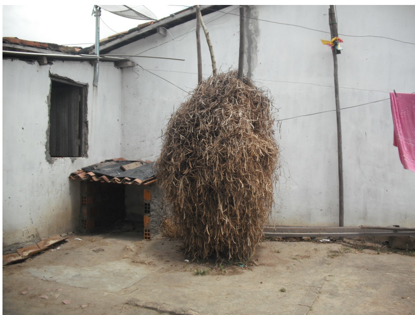
Figura 5 – “Moleque de feijão”: forma de armazenagem do feijão na roça

Ele define cultura como o modo que a humanidade se relaciona com o seu real: “Assim, cultura designará o modo de relacionamento com o real, com a possibilidade de esvaziar paradigmas de estabilidade do sentido, de abolir a universalização das verdades, de indeterminar, insinuando novas regras para o jogo humano” (SODRÉ, 2006, p.10).