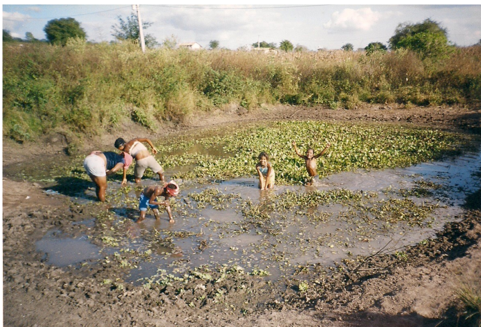
Figura 8 – Mulheres e crianças pescando com cesto na Fazenda Carioca

[...] os rituais de trabalho estão muito presentes nas atividades rurais e quase sempre dizem respeito ao plantio e a colheita de determinadas culturas. O boi roubado, a bata de feijão, a descasca de milho, a rapa de mandioca, entre outras, são manifestações ritualísticas, sonoras e coletivas, de caráter marcadamente comunitário, no sentido de um envolvimento e uma participação efetiva de quase todos os membros de determinados espaços.