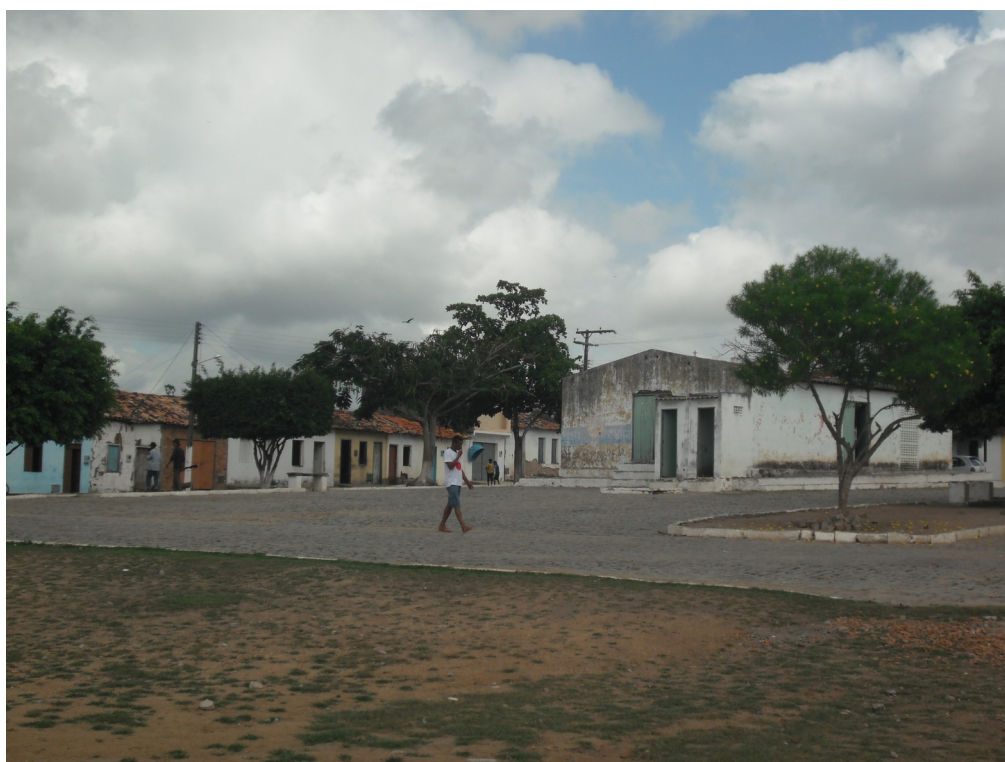
Figura 11 – Distrito de Sítio das Flores

Vivenciamos isso no Povoado (atual Distrito) de Sítio das Flores, em Santa Bárbara.