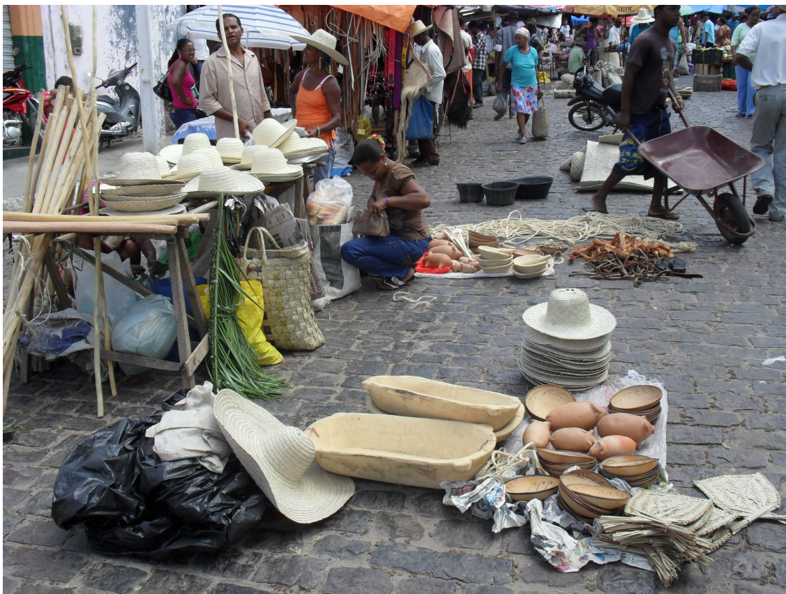
Figura 8 – Feira livre de Santa Bárbara – Artesanato

Essa interação entre Santa Bárbara e outros municípios não se restringe evidentemente à ocasião da feira livre. Há um trânsito diário de sua população para outros centros comerciais, principalmente para Feira de Santana. Comprar, trabalhar e estudar constituem os principais motivos para essa mobilidade. Existe, também, um movimento inverso no que diz respeito ao trabalho e à comercialização de produtos. Profissionais, principalmente professores(as), após aprovação em concursos públicos estaduais ou municipais, se deslocam dos municípios vizinhos (Feira de Santana, Serrinha, Lamarão, etc.) para Santa Bárbara. Desses profissionais, uma parte optou pelo trânsito diário entre o município onde mora e aquele onde trabalha. Outra parte estabeleceu moradia no município onde trabalha. Quanto às trocas comerciais, acontece, esporadicamente e/ou periodicamente, o deslocamento de pessoas da capital (Salvador) e dos municípios vizinhos supracitados, interessados em comprar ou vender produtos em Santa Bárbara. São, geralmente, representantes de determinadas marcas ou vendedores ambulantes os