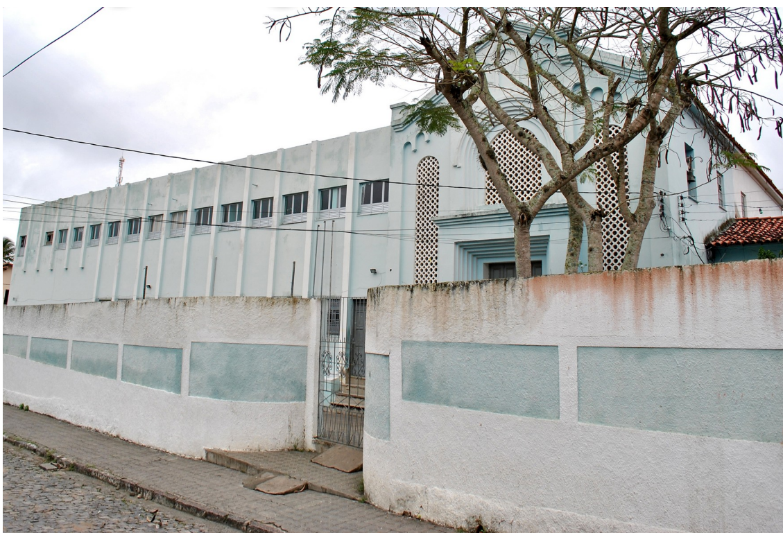
Figura 8 – Centro Educacional São José (Antigo Colégio São José)