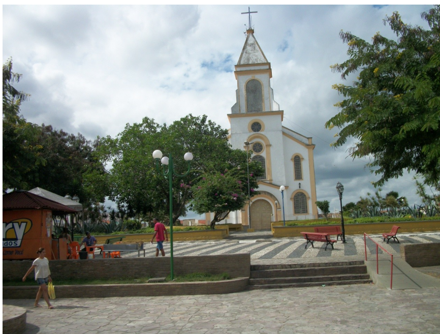
Figura 2 – Santa Bárbara, Praça da Matriz

Contribuiu para o povoamento local e fixação dos moradores, a presença de rios que, embora intermitentes, são de grande importância para a criação de gado, principalmente. Além disso, também fatores como a proximidade com cidades do porte de Feira de Santana e Salvador - que possibilita um ir e vir constante e trocas comerciais, entre outras - e sua localização às margens da BR 116 Norte que facilita a interação entre Santa Bárbara e cidades circunvizinhas (GENOT, 1993).