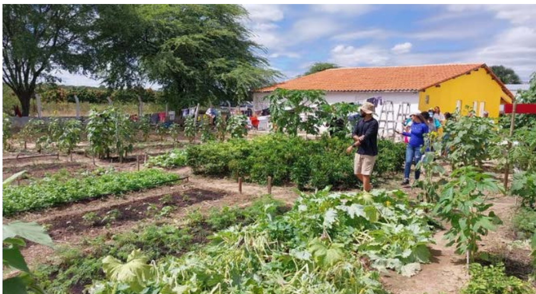
Figura 9 - Horta da EFA Sobradinho-BA