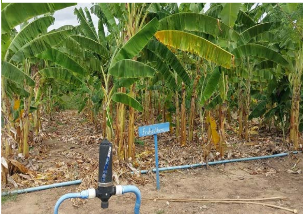
Figura 15 - Fruticultura da EFA de Sobradinho