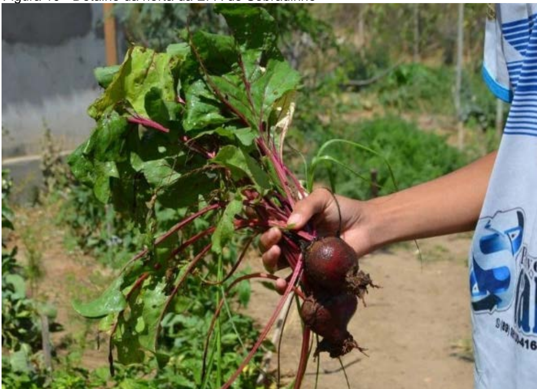
Figura 10 - Detalhe da horta da EFA de Sobradinho