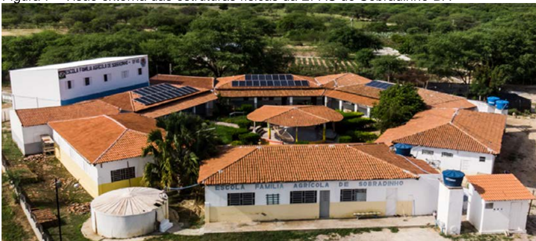
Figura 7 - Visão externa das estruturas físicas da EFAS de Sobradinho-BA

No âmbito da estrutura física, a EFAS dispõe de infraestrutura com alojamentos (masculino e feminino) para os estudantes, além de contar com alojamentos para a equipe pedagógica, refeitório, cozinha com dispensa e copa, secretaria com espaço anexo para reuniões o corpo docente, sala da coordenação, laboratório de informática, quatro salas de aula, laboratório de artes, banco de sementes, um espaço coletivo destinado a realização de atividades culturais e momentos afins), um auditório principal e 16 setores de produção (laboratórios práticos e técnicos) (AMEFAS, 2020).