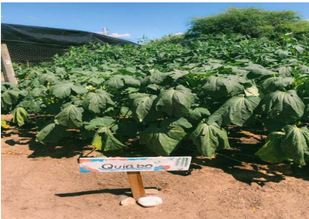
Figura 16- Cultivo do quiabo