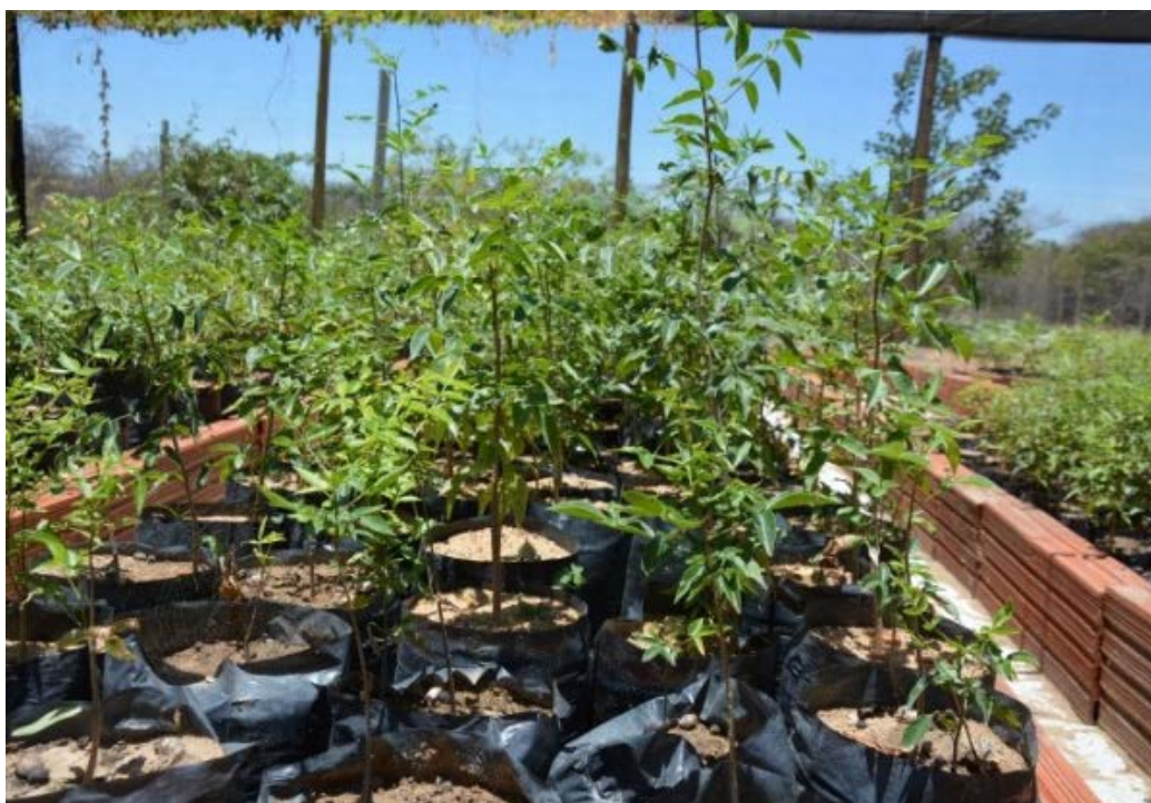
Figura 13 - Mudas cultivadas pelos estudantes