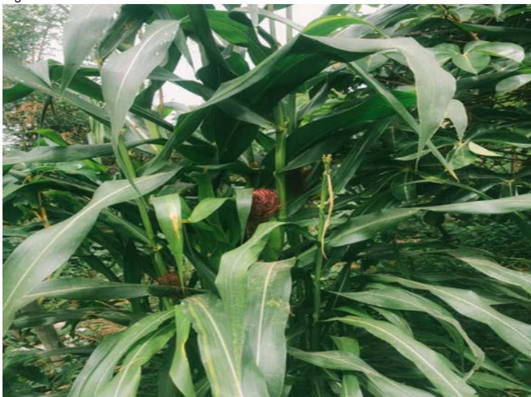
Figura 14 - Detalhe da horta da EFA de Sobradinho