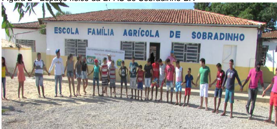
Figura 2 - Espaço físico da EFAS de Sobradinho-BA