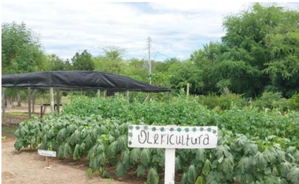
Figura 12 - Espaço de Olericultura