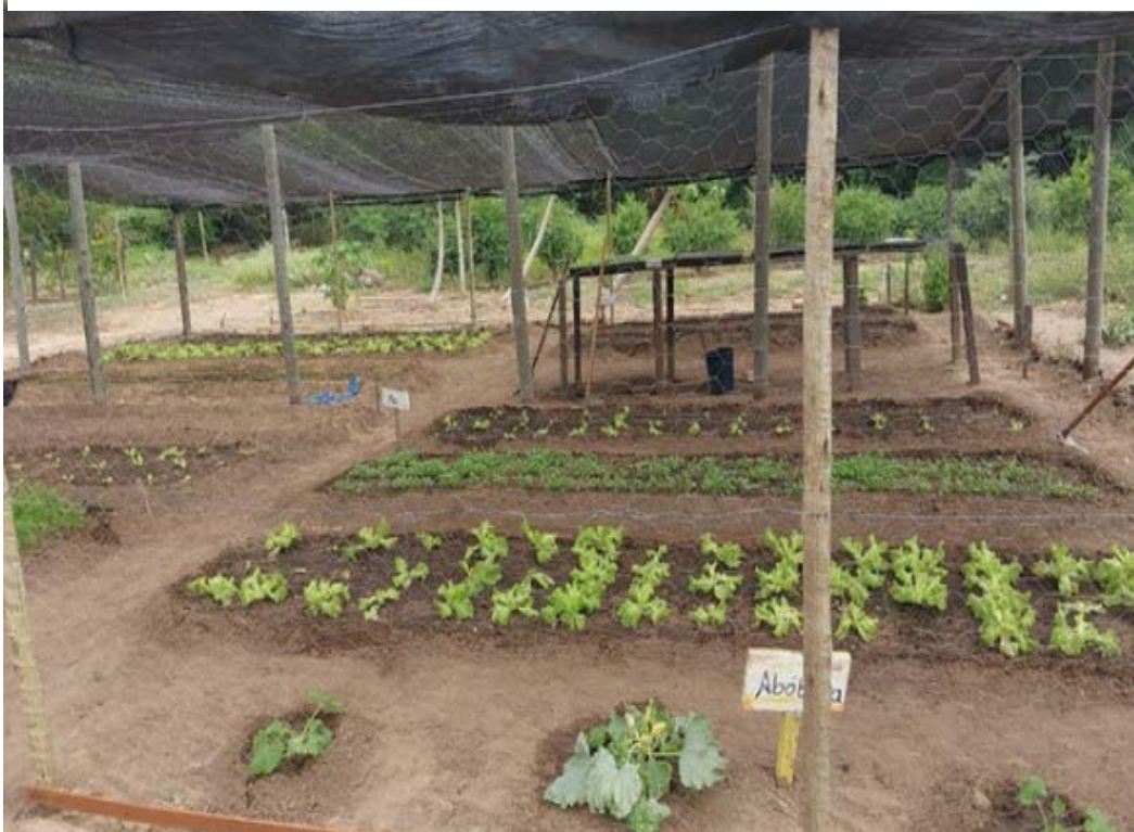
Figura 11 - Coleta de legumes na EFA de Sobradinho