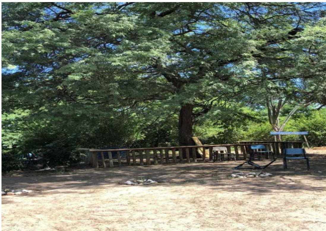
Figura 18 - Espaço de plantio de mudas