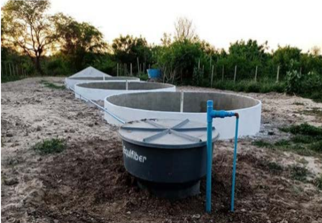
Figura 17 - Sistema de coleta de água da EFA de Sobradinho