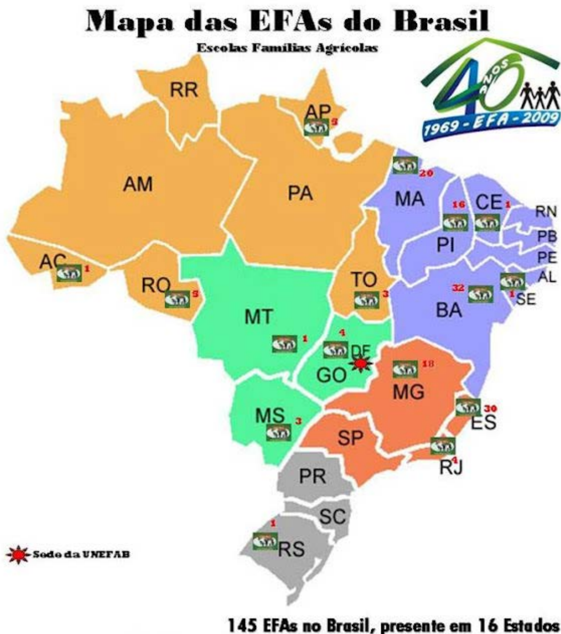
Figura 1- Mapa das EFAs no Brasil