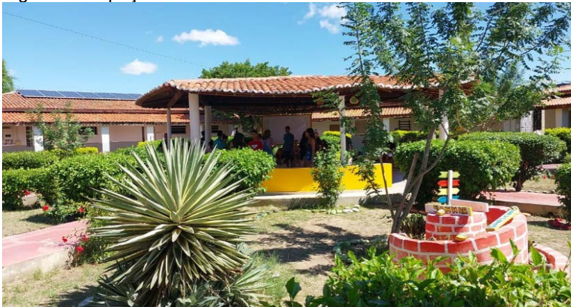
Figura 6 - Espaço físico da EFAS de Sobradinho-BA

entre o ambiente escolar e a realidade dos estudantes, como mostram as figuras abaixo: