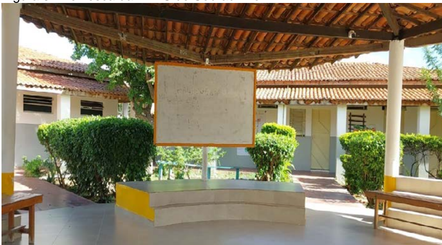
Figura 3 - Telhosca da EFAS de Sobradinho-BA