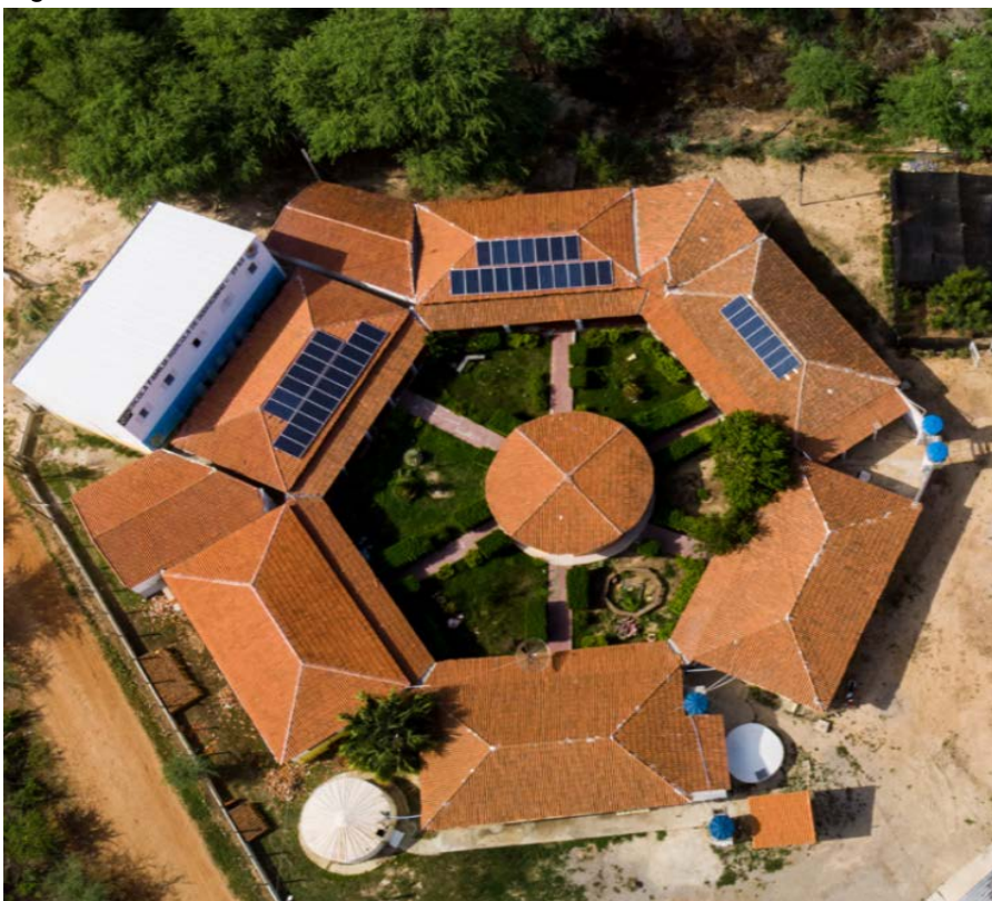
Figura 4 – EFAS Sobradinho – BA