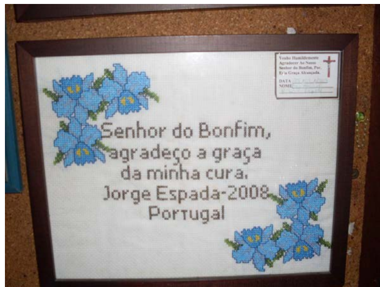
Foto 9 – Quadro de agradecimento por graças alcançadas

Muitos desses votos são expressos através de placa, maquete ou pintura descrevendo os motivos da promessa, ou pequenas réplicas de barro, madeira ou cera ou até mesmo de partes do corpo afetadas por moléstias como perna, cabeça, mão, coração, etc.