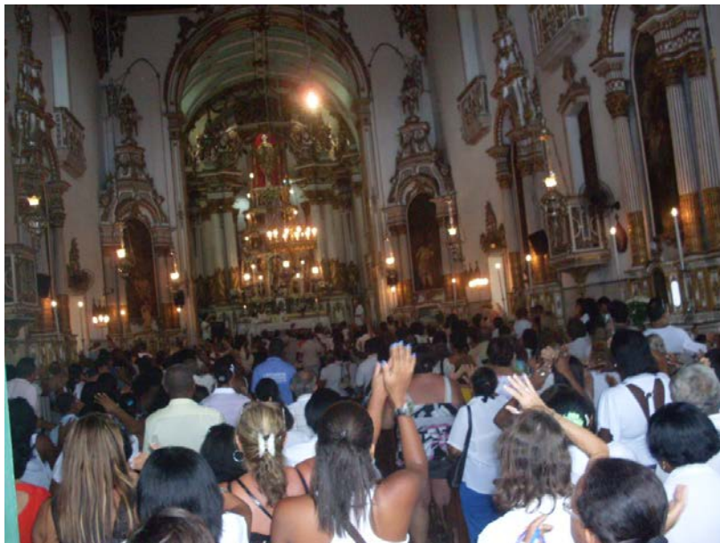
Foto 5 – Fiéis lotam a igreja em homenagem ao Senhor do Bonfim

As celebrações desses dias, são acompanhadas por muitos devotos, que muitas vezes nem conseguem adentrar a igreja e acompanham a liturgia do lado de fora. Os religiosos – padres e sacerdotes – responsáveis pela celebração, sempre abordam nos seus sermões, fatos importantes do cotidiano do mundo. Partindo deste contexto Steil (1996, p. 117) diz que “abordam basicamente termos catequéticos da doutrina católica ou falam dos problemas e das injustiças sociais que existe no país”.