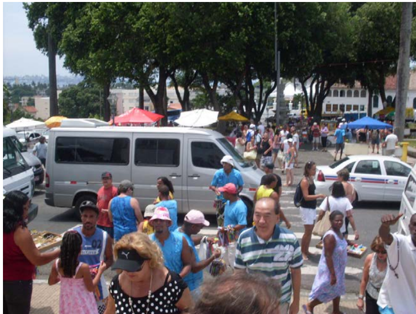
Foto 4 – Chegada de Fiéis e Turistas à Igreja do Bonfim

A Igreja do Bonfim pode atrair muitos turistas, não só pela fé religiosa, mas também pelo rico acervo de suas obras e suas surpreendentes histórias. São diversos aspectos a serem observados na igreja, como sua antiguidade, importância arquitetônica e artística, além da forte relação com os fiéis.