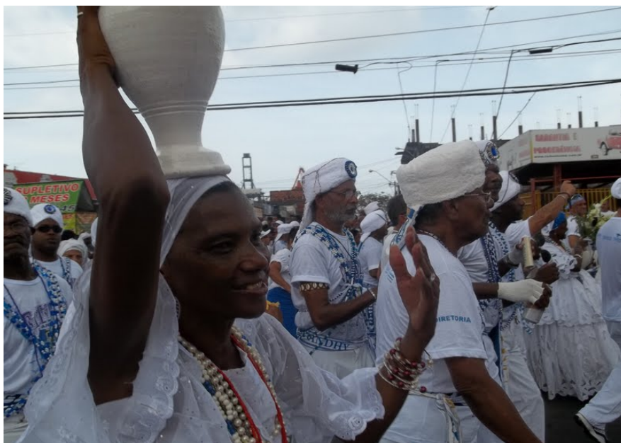
Foto 16 – Participação das baianas e Filhos de Ghandy na Lavagem do Bonfim

Na tradicional Lavagem do Bonfim o catolicismo e o candomblé se misturam, sendo o Senhor do Bonfim também referenciado como Oxalá. Símbolo de devoção e fé a Igreja do Bonfim cada vez mais tem atraído turistas e fiéis de várias partes do mundo, que vem fazer seus pedidos ou agradecer as graças alcançadas.