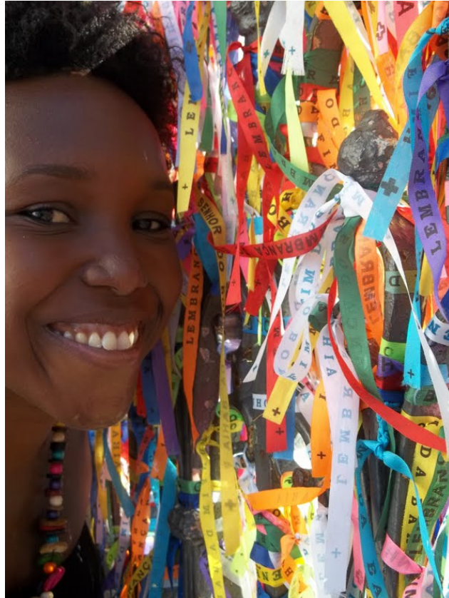
Foto 12 – Turista do Rio de Janeiro encantada com as fitinhas do Bonfim

Antigamente a fitinha do Senhor do Bonfim era chamada de medida do Bonfim, pois media exatamente 47 centímetros de comprimento, a mesma medida do braço direito da estátua de Jesus Cristo, Senhor do Bonfim, que ficava no altar-mor da Igreja do Bonfim.