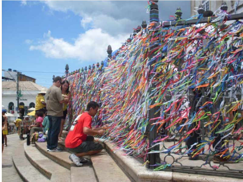
Foto 13 – Devoto amarrando a fitinha do Bonfim

Os turistas e devotos do Senhor do Bonfim também costumam amarrar a fita na grade ou nas portas da igreja, realizando o mesmo ritual dos três nós e três pedidos. Elas podem ser encontradas em diversas lojas de artigos religiosos existentes em Salvador ou até mesmo nos diversos ambulantes que se concentram ao redor da Igreja do Bonfim.