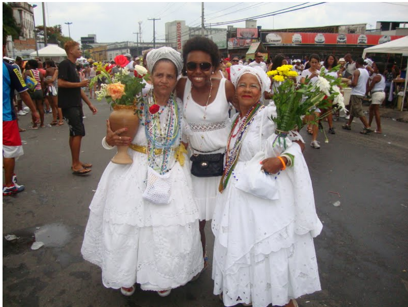
Foto 15 – Turista do Rio de Janeiro participando da Lavagem do Bonfim

Para Sousa (2003, p. 139) “a lavagem do Bonfim é uma festa muito concorrida na cidade de Salvador. Ela atrai muitos turistas e já faz parte do calendário de festas da cidade organizado pelas agências de turismo. Sendo a segunda maior festa, só perdendo para o carnaval.”