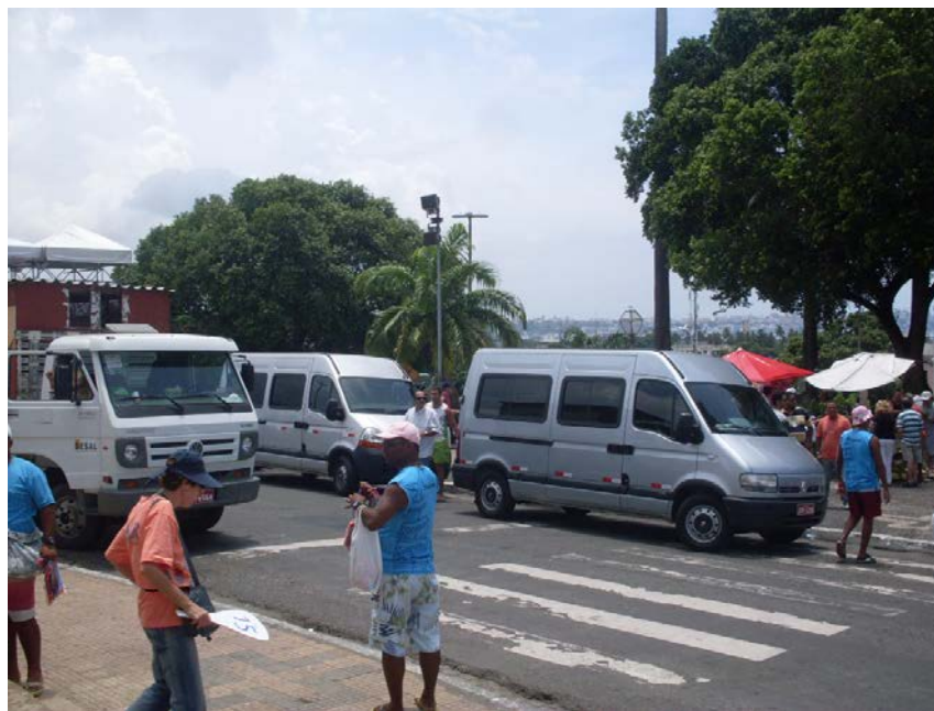
Foto 6 – Veículos da Coopervan estacionados na área da Igreja do Bonfim.

Em entrevista com um dos cooperados da Coopervan, uma cooperativa de vans existente na cidade de Salvador e que tem um box localizado no Porto, região do Comércio, o mesmo declarou que a Igreja do Bonfim é o principal atrativo solicitado pelos turistas para conhecer na cidade. Ele informa que geralmente faz o traslado dos turistas que chegam ao Porto de Salvador, para os hotéis, ou muitas vezes diretamente para a realização do roteiro turístico que é oferecido pela cooperativa e que abrange diversos atrativos, a exemplo do objeto deste trabalho.