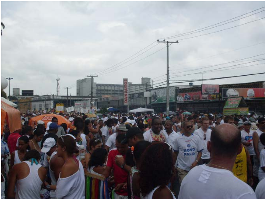
Foto 18 – Participação popular na Lavagem do Bonfim

Devido à festa se realizar num período de alta estação pôde-se perceber a presença de muitos turistas, que juntamente com os baianos, se vestiram de branco – a cor de oxalá - e foram reverenciar o mais importante santo de devoção da Bahia.