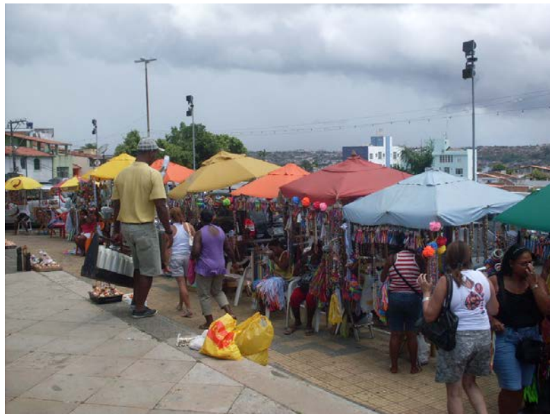
Foto 14 – Comércio informal ao redor da Igreja do Bonfim

Em outro depoimento obtido no local, de uma ambulante, 83 anos, católica, devota do Senhor do Bonfim, afirmou que há mais de 50 anos trabalha no comércio informal existente nas imediações da igreja, vendendo artigos religiosos como fitinhas do Bonfim, patuás, velas, sempre no mesmo lugar. Relatou que criou seus 9 filhos trabalhando todos os dias naquele mesmo ponto – na lateral da igreja – e que vende 12 fitinhas coloridas do Senhor do Bonfim a R$1,00 (hum real). A mesma informou que a cor da fitinha que representa o Senhor do Bonfim é a branca e que informa às pessoas que as compram que devem benzer as mesmas na igreja e depois fazer todo o ritual de amarração para que os pedidos sejam realizados.