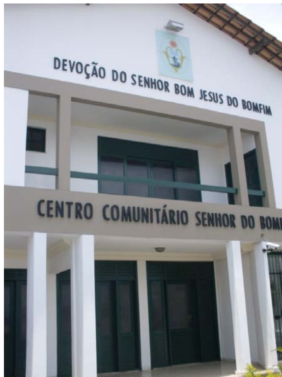
Foto 2 – Prédio da Devoção do Senhor do Bonfim localizado defronte à Igreja do Bonfim.

A força simbólica da Igreja do Bonfim se encontra, a priori, na sua localização, ou seja, na “colina sagrada”, pois as montanhas, as serras e os montes, são os lugares privilegiados onde ocorre a ligação próxima entre o céu e a terra, é onde encontramos o centro do mundo, e que geralmente é o que nos faz entender o comportamento religioso em relação ao espaço em que se vive. E nos faz compreender que há uma relação da igreja com o cosmos, uma ligação entre o céu e a terra é o que torna a colina um espaço sagrado. (ELIADE, 1995).