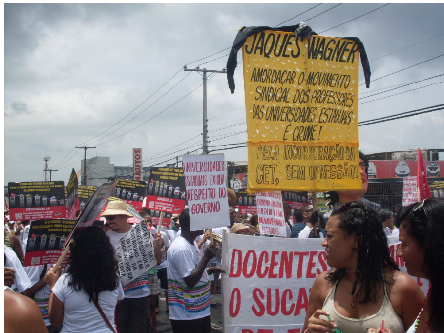
Foto 17 – Manifestação política durante a Lavagem do Bonfim

A marca maior da festa é a busca de uma relação mais próxima com o sagrado por parte dos participantes que saem as ruas da cidade em busca do Axé, liberado pelas baianas que realizam a lavagem simbólica do santuário. (GUIMARÃES, 2003, p. 138).