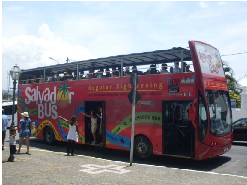
Foto 7 – Ônibus de Turismo na área da Igreja do Bonfim

da cidade de Salvador. A mesma possui cinco roteiros intitulados: Salvador Praia, Orixás da Bahia, Salvador Histórico, Salvador Panorâmico, o qual a Igreja do Bonfim está inserido e o Luzes da Cidade, roteiro este realizado a noite.