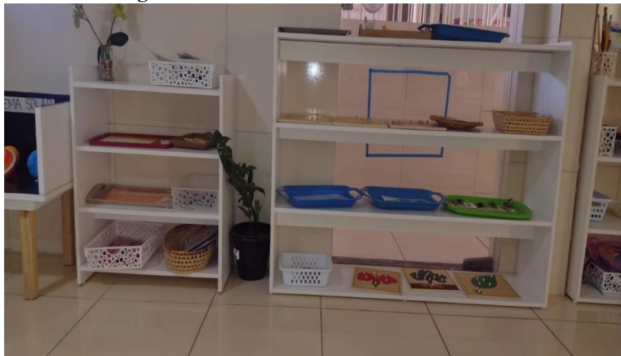
Figura 4: Estantes de matemática