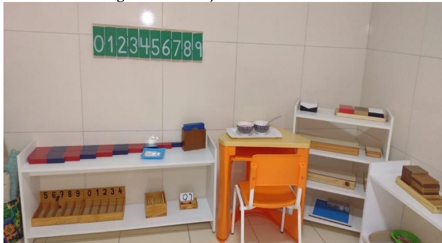
Figura 3: Educação cósmica

crianças utilizem o corpo, explorando a parte sensorial. Segue imagem de estantes de matemática e educação cósmica: