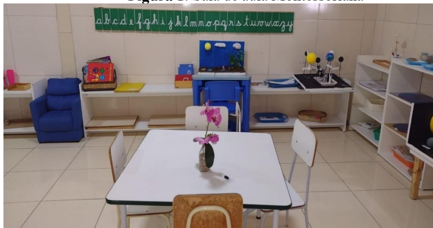
Figura 1: Sala de aula Montessoriana

Uma sala de aula Montessori é bem diferente da que estamos acostumados a ver em escolas tradicionais. Além de ter os materiais nas prateleiras à altura das crianças, não possui cadeiras e mesas enfileiradas, nem o professor na frente de todos. Muito pelo contrário, as crianças e o professor se sentam juntos.