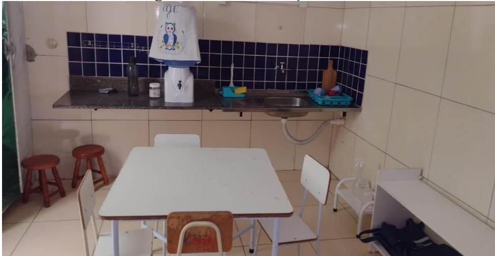
Figura 2: Sala das refeições

Outro diferencial é que as crianças têm algumas responsabilidades, assim como, são estimuladas através de afazeres que são bem comuns em nosso cotidiano, as quais são chamadas de: atividades da vida prática. Durante as refeições, por exemplo, as crianças se alimentam sozinhas e ao término das refeições elas organizam o ambiente buscando sempre, deixá-lo em ordem. Para isso ficam dispostas vassouras no canto da sala e um local para que limpem seus pratos/copos/talheres. Figura abaixo: