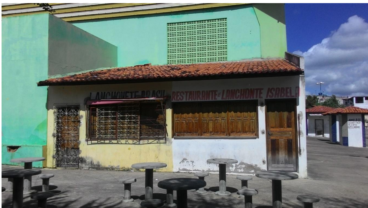
Imagem 14: Espaços da parte de trás do ginásio – lado direito

Outra construção estranha encontra-se na parte de trás do ginásio. 2 espaços que parecem ser lanchonetes mas que frequentemente são vistos fechados. Foi solicitado a prefeitura documentos acerca do uso destes espaços e não foram encontrados, o que nos leva a crer que mais uma vez o poder executivo municipal fez mau uso do dinheiro público.