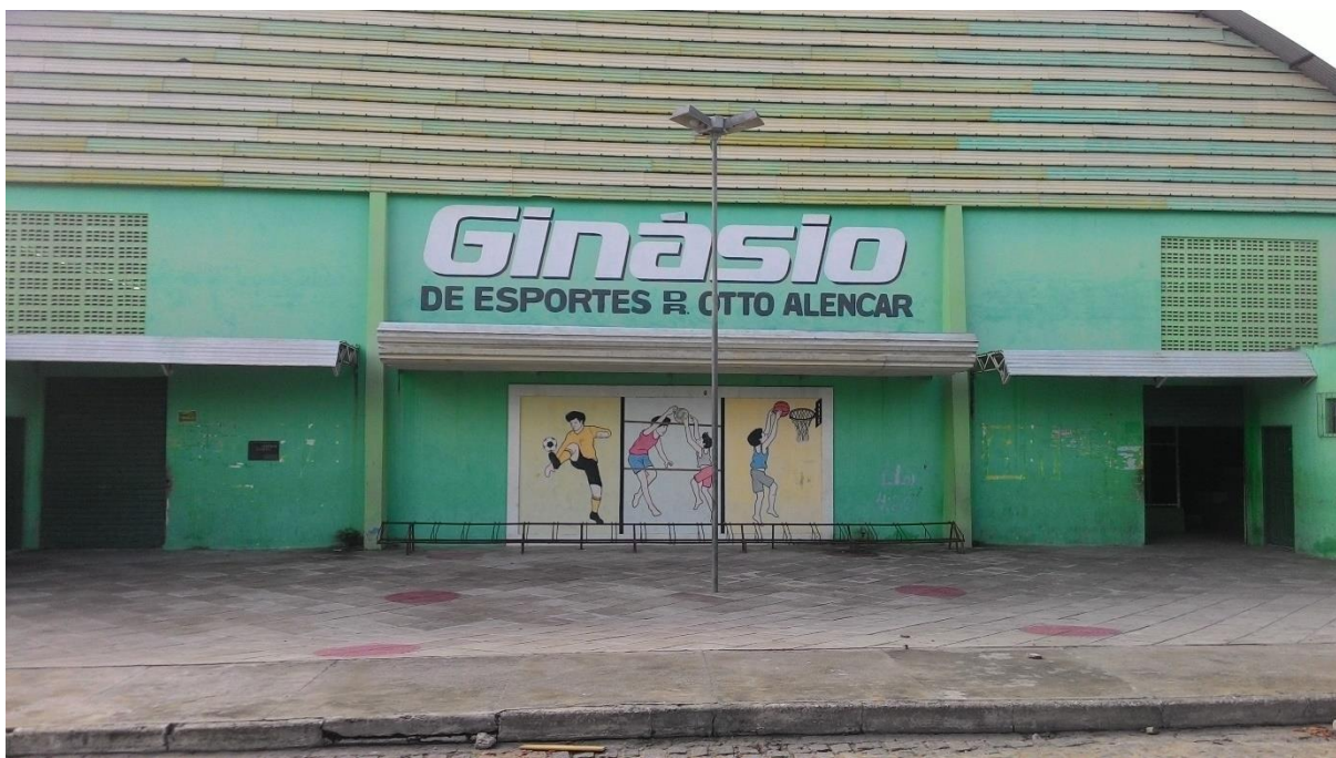
Imagem 11: Vista da fachada do ginásio “Dr.” Otto Alencar

Outra observação é que não existe uma placa da inauguração do ginásio. Em seu lugar encontramos outra falando da “reconstrução” do espaço datado de 09/05/2008. Curiosamente houve uma reforma e não reconstrução do ginásio. Não existem informações nem na Prefeitura sobre a data oficial de inauguração do ginásio.