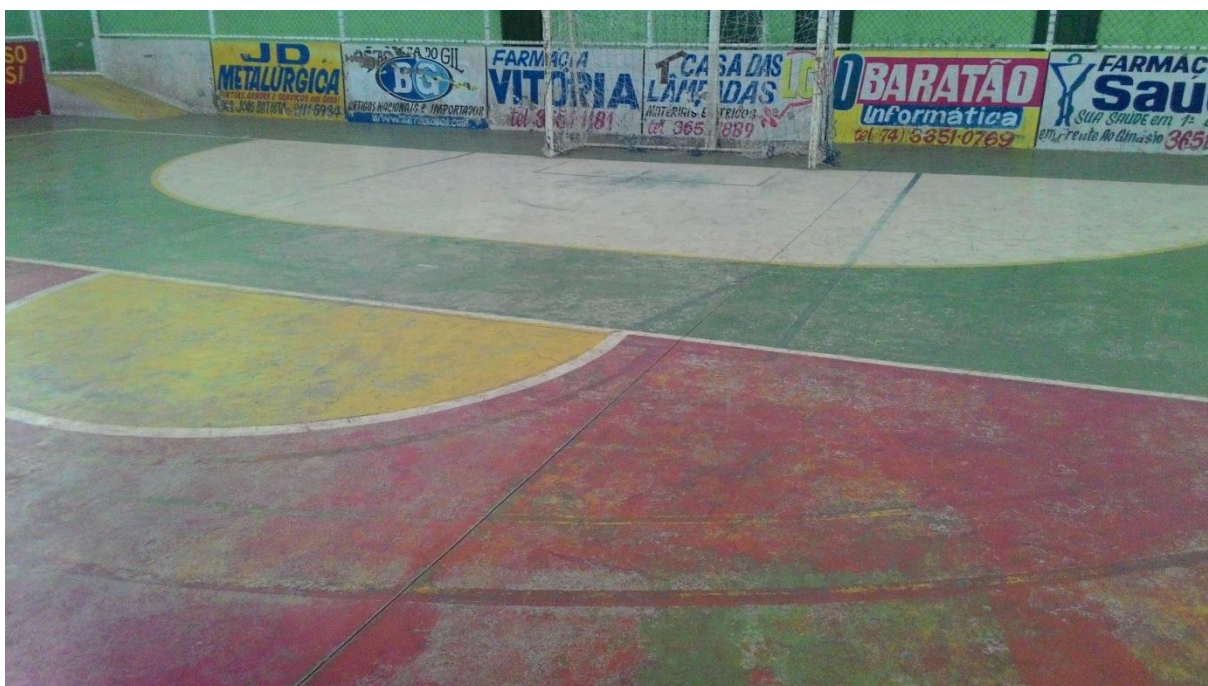
Imagem 16: Marcas apagadas da quadra e pinturas sobrepostas e confusas

Podemos notar que as marcações da quadra encontram-se apagadas, além de termos a impressão de que várias marcações foram pintadas sobrepostas, causando confusão, uma vez que esse espaço supostamente é utilizado para diferentes práticas esportivas.