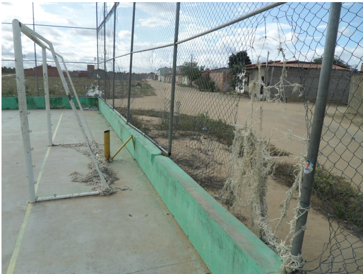
Imagem 3: Vista interna da quadra do bairro Planaltino

Além da inexistência da rede da trave, podemos visualizar que o cano no qual deveria estar a tabela de basquete foi serrado e removido, deixando cerca de 40 centímetros de ferro exposto, podendo dessa maneira machucar gravemente qualquer praticante de atividades que porventura venha a cair nesse espaço, fato que é muito provável, já que aparentemente a quadra é utilizada apenas para a prática do futsal, que é um esporte de contato.