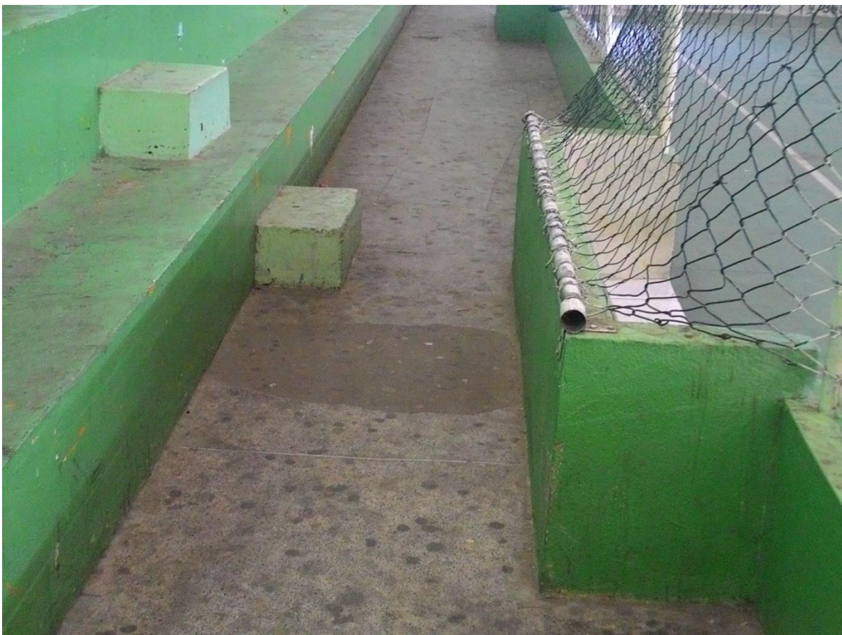
Imagem 19: Degrau que fica de frente ao recuo do banco de reservas impede a passagem de uma pessoa em cadeira de rodas.

Com base nas evidências mostradas acima, percebemos que, o espaço não recebe a devida atenção do poder executivo municipal, uma vez que o mesmo não atende a normas básicas de acessibilidade e livre trânsito de pessoas com e sem deficiência, além de possuir equipamento em estado inutilizável e essencial para a prática de esportes como basquete, tem a marcação quase que totalmente apagada. Além disso, não foi notado nenhum tipo de material para que fosse possível jogar Voleibol. Esses detalhes inviabilizam a prática esportiva em todas as suas vertentes bem como a realização de eventos esportivos no local.