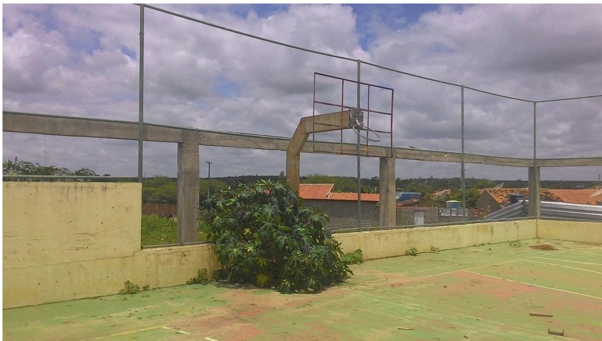
Imagem 5: Vista interna da quadra de Pedras Altas.

Outra situação que podemos nos atentar é a não garantia de acessibilidade das pessoas com deficiência na reforma dessa quadra. Como visto na imagem 9, não há vestígios de intenção de construção de ao menos uma rampa para garantir o livre acesso e trânsito de uma pessoa que faz uso de cadeira de rodas para se locomover, o que deixa mais uma vez em evidência a falta de coerência entre a Lei Orgânica Municipal com a referida obra pública e o não respeito à Lei Federal n.º 10.098, de 19 de dezembro de 2000, que determina as normas e critérios básicos para que se possa promover a acessibilidade das pessoas com deficiência ou com mobilidade reduzida e tem em seu Capítulo IV: