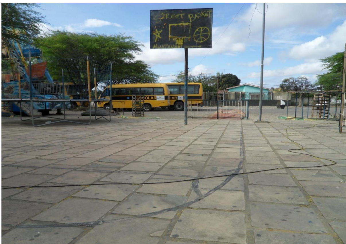
Imagem 23: Com piso impróprio tabela de basquete da praça da prefeitura disputa espaço com parque de diversões e transporte escolar.

Não é algo prudente crer que entregar a melhor e mais bela das estruturas esportivas à população os tornará cidadãos autônomos e críticos, ou “líderes”. Tampouco irá “proporcionar o desenvolvimento do basquete” ou qualquer outra modalidade, pois, para que isso aconteça, enfatizamos a necessidade de um condutor, fomentador, orientador das práticas, função que deveria ser atribuída ao professor de Educação Física e que em nenhum momento é citado no documento.