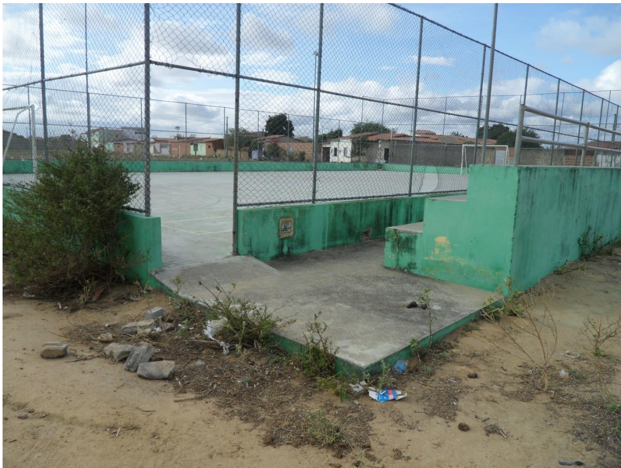
Imagem 2: Vista externa da entrada da quadra do bairro Planaltino.

A estrutura do espaço mostrado na imagem também contradiz o parágrafo único do Art. 179 da Lei Orgânica que diz que o município garantirá atendimento especial a pessoas com deficiência no que se refere à prática de atividade desportiva.