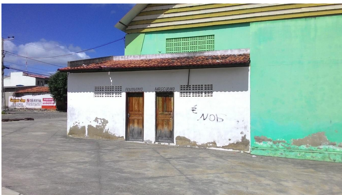
Imagem 13: Banheiros na parte de trás do ginásio – lado esquerdo