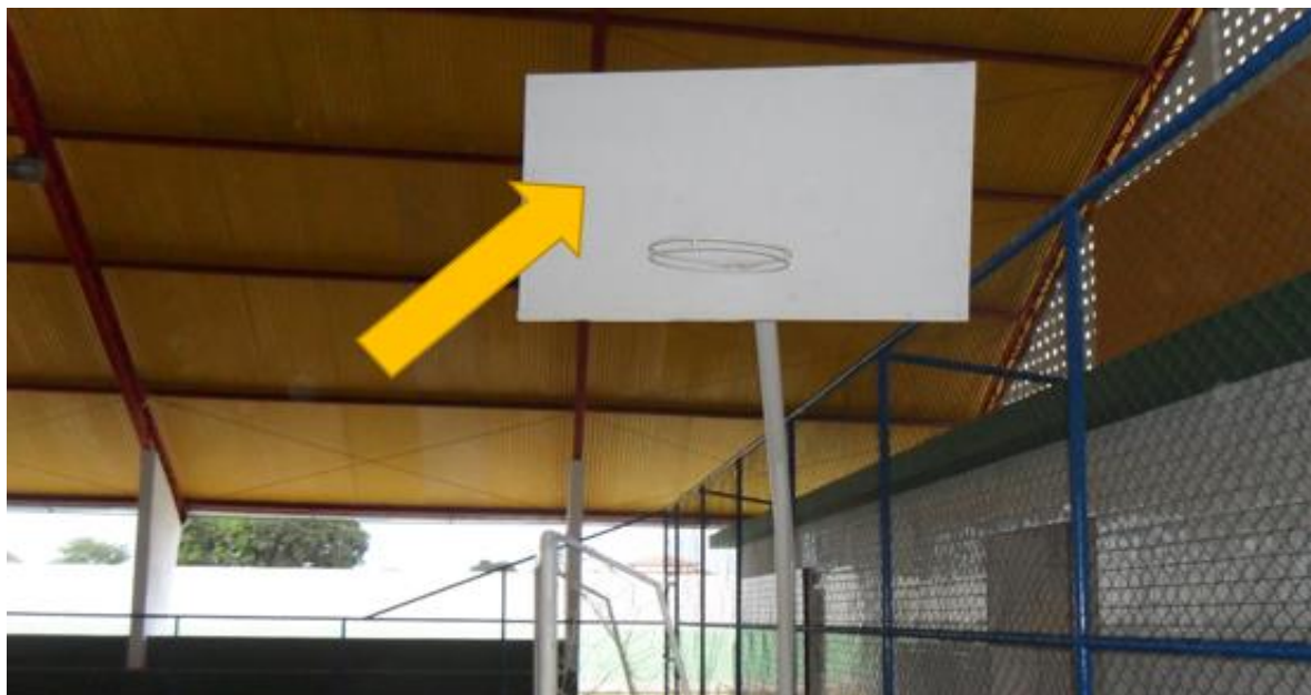
Imagem 9: Falta da marcação da tabela e da rede do aro.

Na imagem 10 podemos observar a ausência de algumas marcações do handebol, como por exemplo, a linha dos 9 metros (linha pontilhada), a linha de 7 metros do pênalti e a marcação do goleiro (4 metros), assim como marcações do futsal, por exemplo a marca de escanteio.