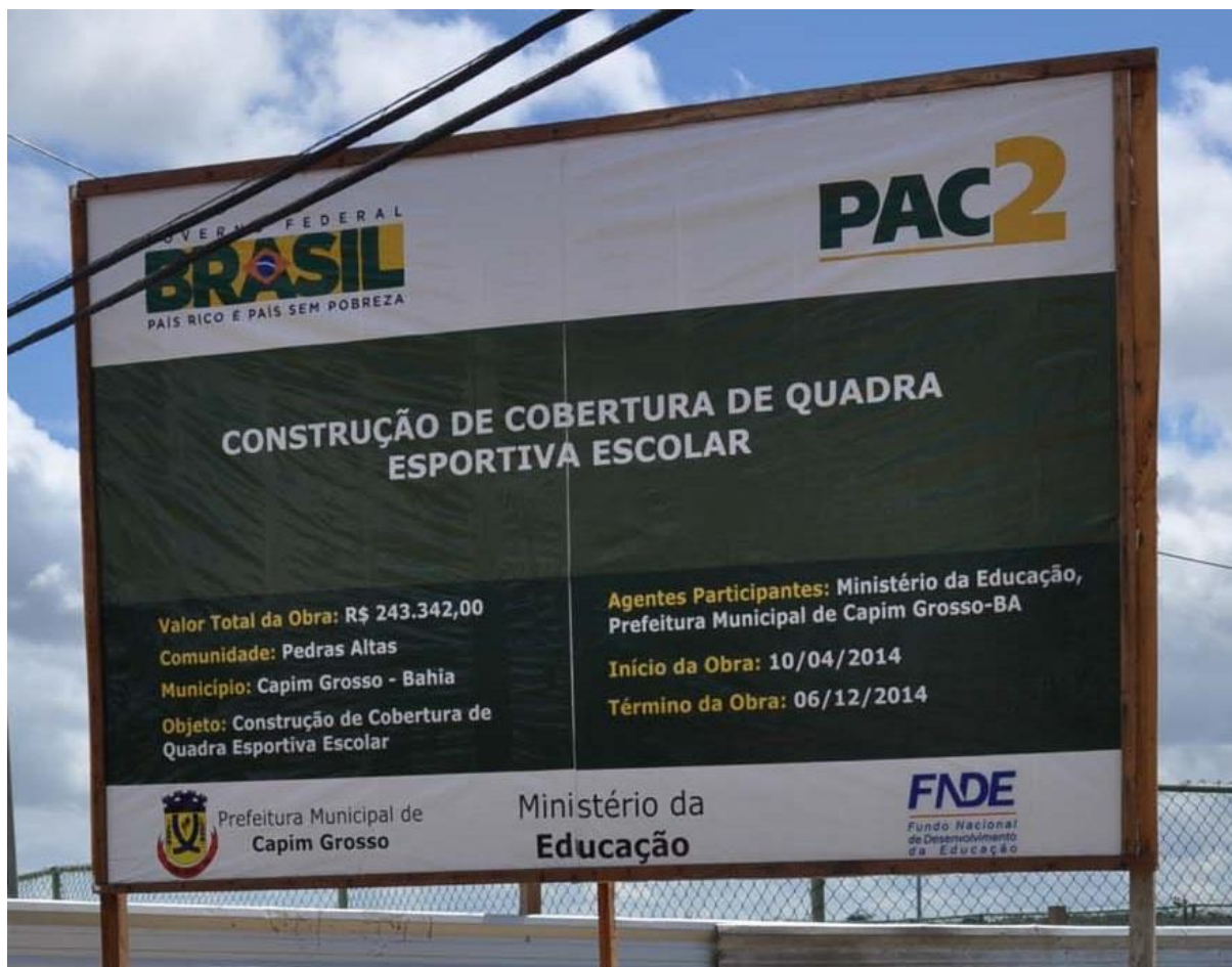
Imagem 4: Placa da reforma da quadra de Pedras Altas.

A obra de reforma da quadra, além de atrasada encontra-se parada, pois o que podemos observar é que há ferrugem espalhada pelo piso, bem como a proliferação de vegetação e a não existência de marcas de trânsito de pessoas no local.