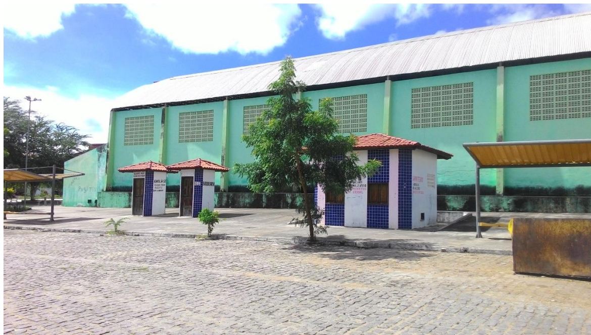
Imagem 12: Vista lateral do ginásio – lado esquerdo

O vereador Marcone Novais Santos solicitou por meio da indicação de nº 004/03, do dia 17 de fevereiro de 2003, a construção de banheiros na parte externa do ginásio, pedido este que foi aceito. Entretanto, os espaços construídos não são utilizados, uma vez que ao passar pelo local foi constatado que as portas encontravam-se trancadas.