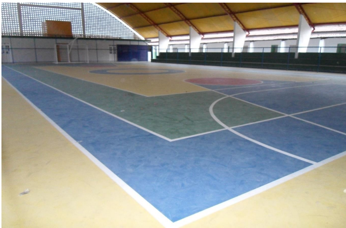
Imagem 10: Falta da marcação do escanteio do futsal e da linha pontilhada do handebol.

Na imagem 10 podemos observar a ausência de algumas marcações do handebol, como por exemplo, a linha dos 9 metros (linha pontilhada), a linha de 7 metros do pênalti e a marcação do goleiro (4 metros), assim como marcações do futsal, por exemplo a marca de escanteio.