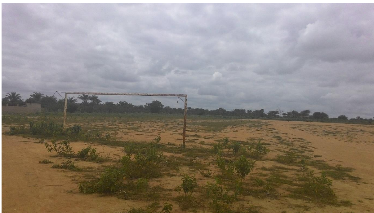
Imagem 22: Campo do povoado do Peixe, um entre os diversos campos de terra batida encontrados no município.

Em visita e busca por espaços onde práticas corporais são realizadas, foi notada a predominância de campos de terra em várias partes do município. Podemos supor que, a partir das condições dos espaços não há grandes possibilidades de uso para esportes além do futebol e brincadeiras recreativas. Esses espaços são tradicionais nas cidades brasileiras, mas vem cada ano sendo reduzidos para dar lugar a empreendimentos imobiliários.