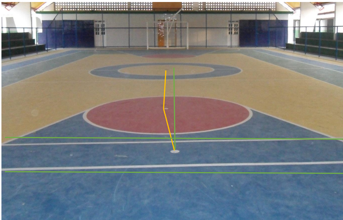
Imagem 8: Marcação errada da quadra e falta das linhas do handebol e do basquete

marcamos com traço amarelo). Além disso percebemos que as linhas verticais também não se encontram alinhadas (que deveriam ser como a marcação verde que colocamos).