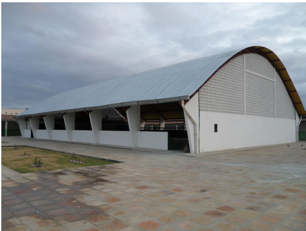
Imagem 7: Vista externa da quadra da Escola Municipal Edivaldo Machado Boaventura.

Em 28 de setembro de 2014 foi inaugurada a quadra do colégio municipal Edivaldo Machado Boaventura, um equipamento poliesportivo e coberto. Ao visualizar a imagem 10 que mostra a parte externa do espaço não é possível perceber nenhuma irregularidade. Entretanto após uma análise percebemos que apesar de nova, a quadra apresenta alguns problemas.