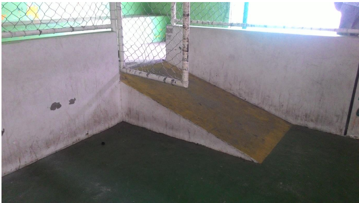
Imagem 15: Portão muito estreito e rampa fora das normas da ABNT

Podemos notar que as marcações da quadra encontram-se apagadas, além de termos a impressão de que várias marcações foram pintadas sobrepostas, causando confusão, uma vez que esse espaço supostamente é utilizado para diferentes práticas esportivas.