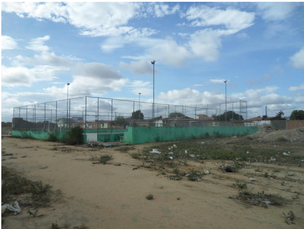
Imagem 1: Vista externa da quadra do bairro Planaltino.

Com base na imagem dos arredores da quadra, pode-se ter uma ideia de que há pouca preocupação dos administradores públicos na manutenção desse bem municipal. Podemos notar também na imagem 2 que além do referido espaço não contar com o mínimo de zelo, a falta de acessibilidade é evidente por não serem seguidas as regras da Associação Brasileira de Normas Técnicas (ABNT), norma NBR 9050, que trata da acessibilidade a edificações, mobiliário, espaços e equipamentos urbanos, determinando os padrões ideais para que seja assegurado o livre acesso de pessoas com deficiência com autonomia e segurança nos mesmos (ABNT, 2004).