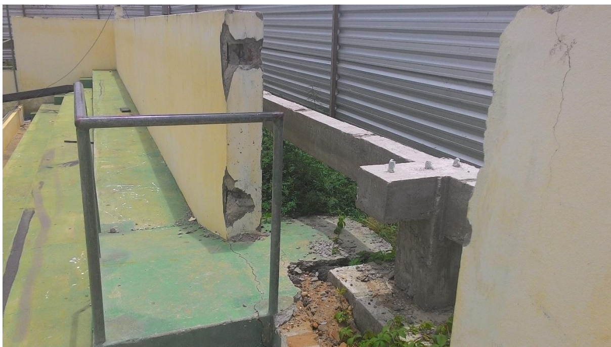
Imagem 6: Vista interna da quadra de Pedras Altas

Percebemos que o inciso II do artigo 11º da lei Federal 10.098 não está sendo cumprido, o que é agravado pelo fato de se tratar de uma edificação pública em reforma.