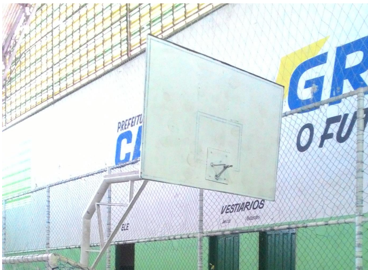
Imagem 17: Tabela com base de sustentação torta, sem aro e com marcação apagada

A tabela de basquete encontra-se apagada, sem o aro, a rede e sua base de sustentação está torta, impossibilitando que esse esporte seja praticado. Possivelmente a negligência dada à manutenção dos itens citados seja fruto da história desse esporte na cidade, e do sistema educacional da mesma, que aparentemente não fomenta a prática do basquetebol, então, presume-se que os responsáveis pela manutenção desses espaços pensem que se não há praticantes, não há porque manter o funcionamento do equipamento.