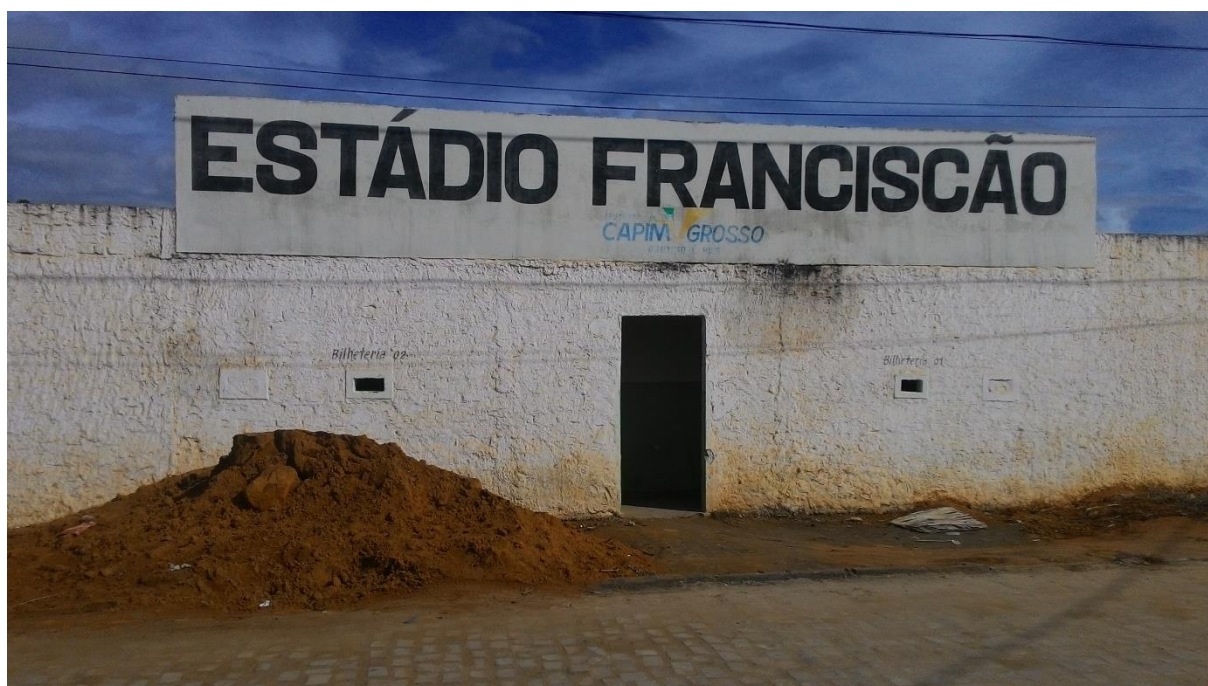
Imagem 20: Fachada do estádio Ângelo Francisco de Oliveira, o “Franciscão”