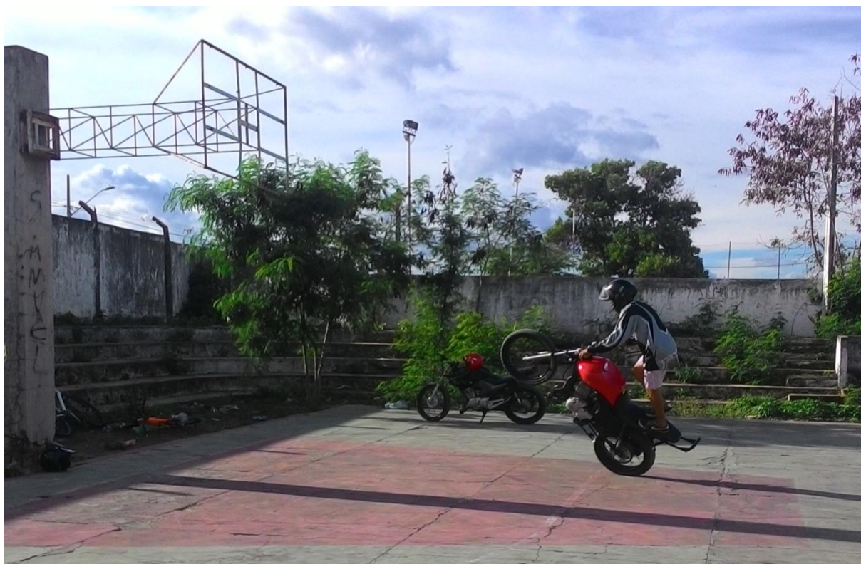
Imagem 25: Jovens aproveitam a quadra abandonada do clube para praticar manobras de motocicleta

Na quadra poliesportiva do clube é possível ver jovens praticando manobras em motocicletas, fazendo verdadeiras maravilhas em duas rodas, mas tendo apenas os próprios colegas como público e nenhum tipo de acompanhamento profissional, ficando assim a mercê da própria criatividade e coragem.