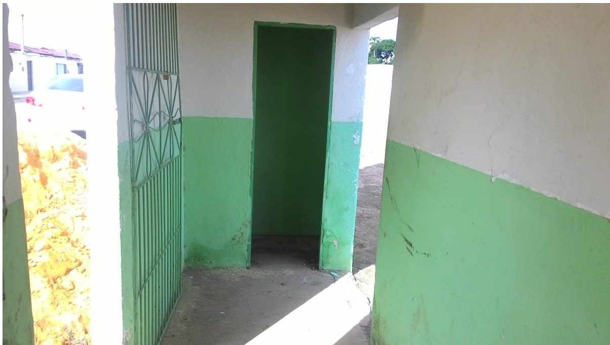
Imagem 21: Falta de acessibilidade já na entrada do estádio

O parágrafo único do artigo 13 no Capítulo 4 da Lei nº 10.671, de 15 de maio de 2003, conhecido como Estatuto do torcedor indica que: “Será assegurado acessibilidade ao torcedor portador de deficiência ou com mobilidade reduzida”. Entretanto esta norma ainda não é cumprida no estádio, como podemos observar a entrada principal da bilheteria.