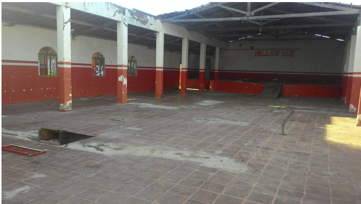
Imagem 24: Equipamento improvisado para prática do skate instalado no salão de eventos abandonado.

Na quadra poliesportiva do clube é possível ver jovens praticando manobras em motocicletas, fazendo verdadeiras maravilhas em duas rodas, mas tendo apenas os próprios colegas como público e nenhum tipo de acompanhamento profissional, ficando assim a mercê da própria criatividade e coragem.