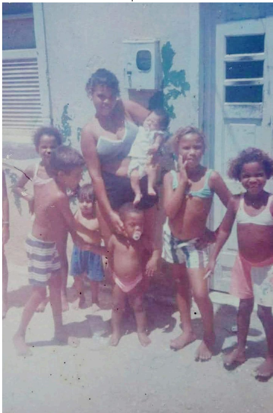
IMAGEM 2: Única foto que restou da minha infância