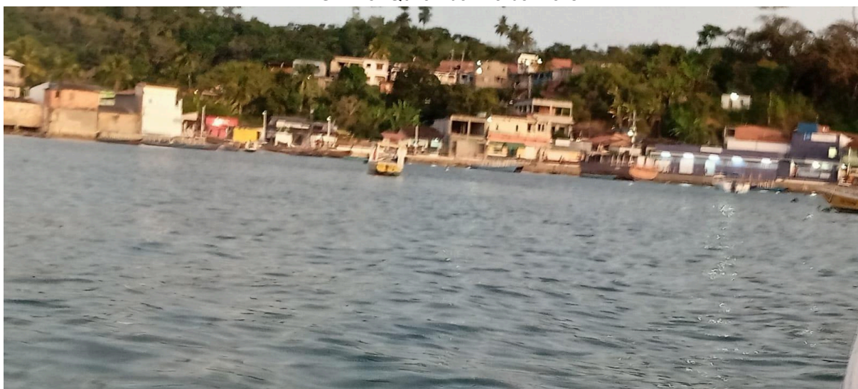
IMAGEM 3: Quilombo Ilha da Maré

Crescer na Ilha de Maré (imagem 3) foi, para mim, uma experiência profundamente imersiva nos valores ancestrais e culturais que moldaram minha identidade. Desde cedo, fui cercado por práticas que refletem a riqueza da cultura quilombola, como os processos de cura realizados por rezadeiras, os banhos de folhas e a prática da religião de matriz africana. Essas tradições não apenas me ensinaram sobre a importância da espiritualidade e da conexão com a natureza, mas também fortaleceram meus laços com a comunidade.