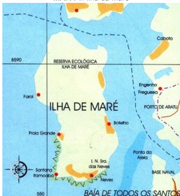
MAPA 1: Ilha da Maré