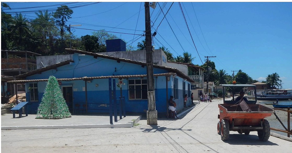
IMAGEM 4: Escola Nossa Senhora das Candeias

como o chão de barro e a simplicidade das instalações, e até falta de fachada, indicando que é uma escola — desempenhou um papel crucial na formação da minha identidade e na minha experiência educacional. Este ambiente, com todas as suas precariedades, era um espaço onde a educação transcendeu a mera transmissão de conteúdos; tornou-se uma prática cultural e um ato de resistência.