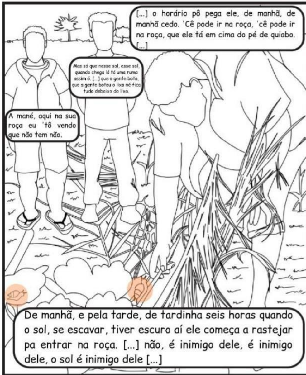
Ilustração: Lillian Moraes

O controle do caramujo a partir dos saberes dos/as mestres/as populares