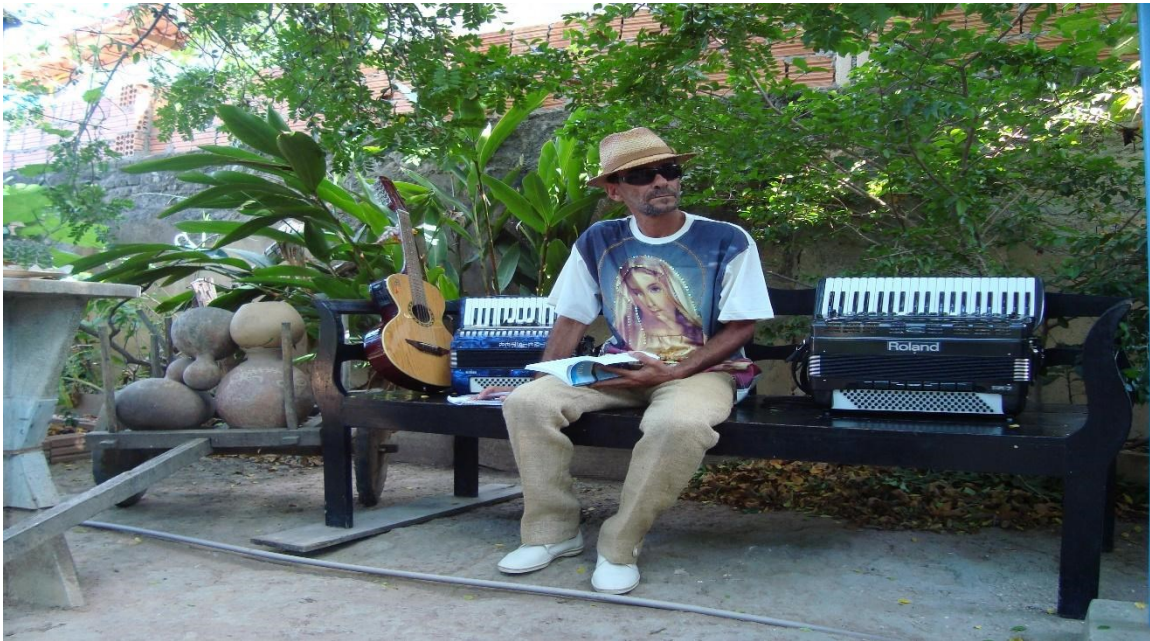
Figura 3 – Igreja do Bom Jesus, Seabra, 2020.

Fonte: Acervo pessoal do autor. Autorização concedida em 2025.