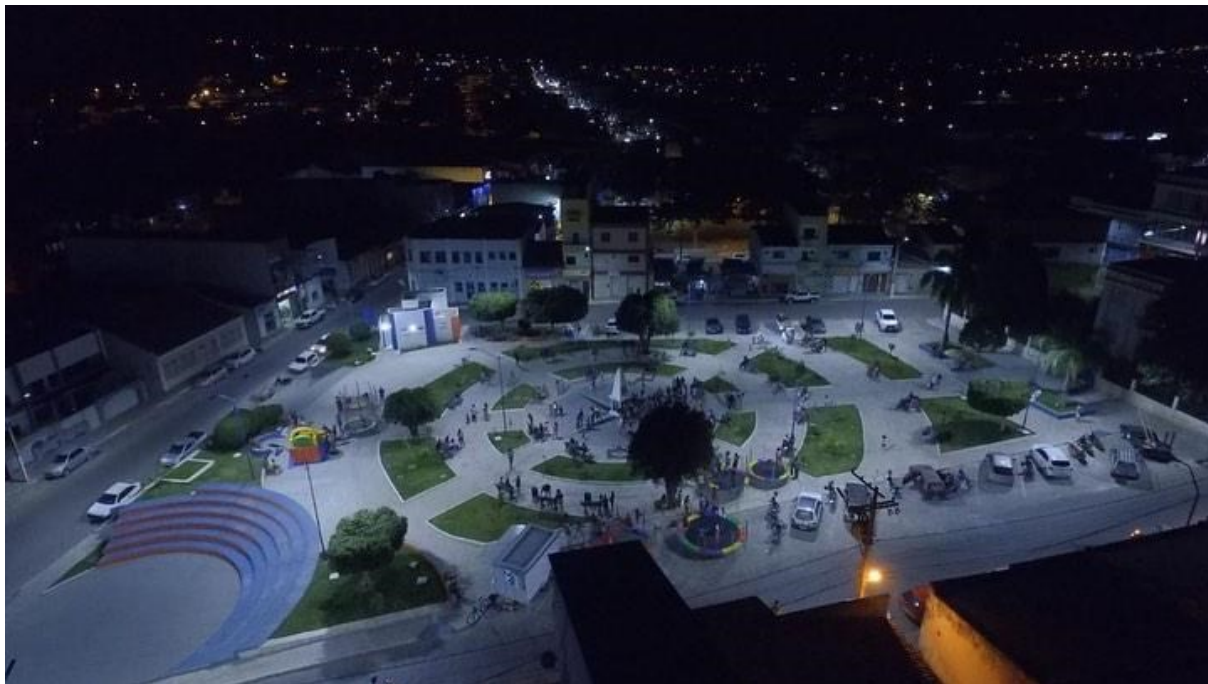
Figura 5 – Hugo Luna na FELISE – Feira Literária de Seabra, homenagem em novembro de 2025 em Seabra.