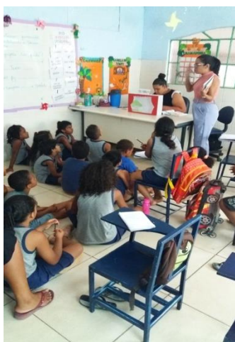
A Fruta Sem Nome – Clarice Lispector.