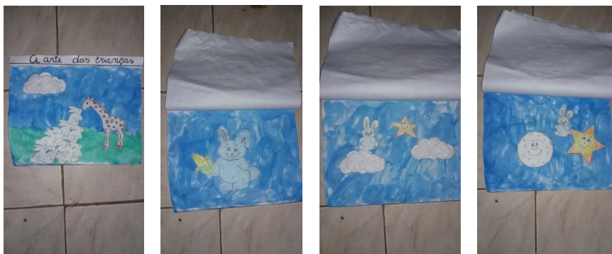
A Arte das Crianças – Eduardo Galeno.