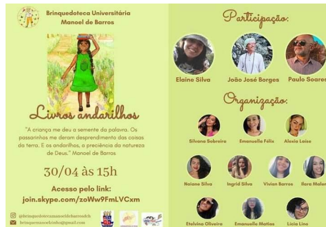
Card convite, com informações e convidados.