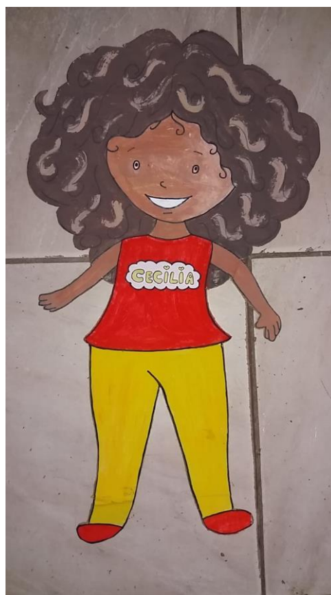
Personagem Cecília de Os Cachinhos de Cecília.