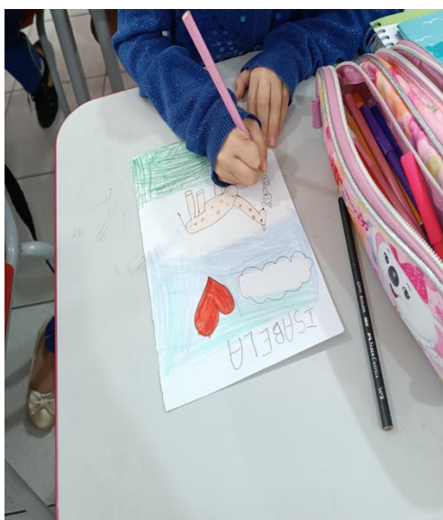
A Arte das Crianças – Eduardo Galeno.