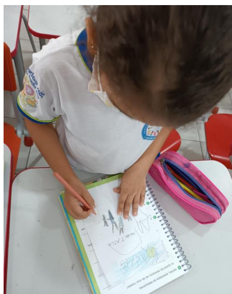
A Arte das Crianças – Eduardo Galeno.