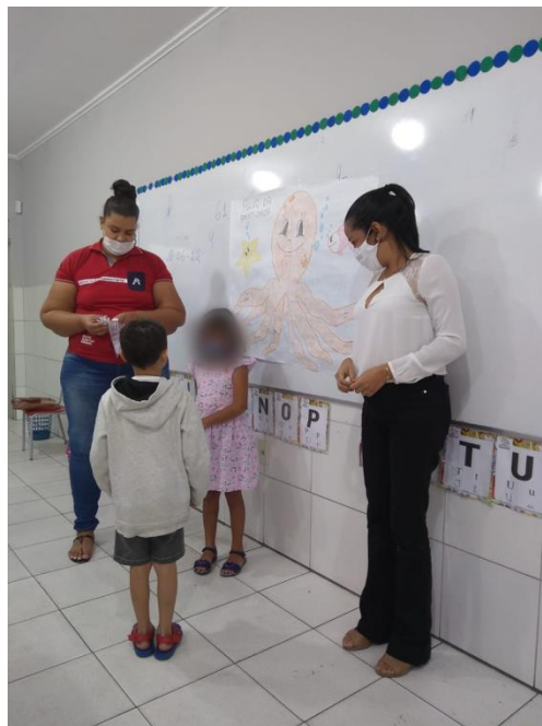
Brincadeira – O Povo da Identidade.