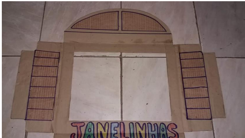
Janela para o projeto Janelinhas.