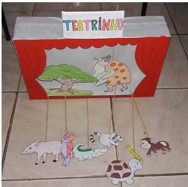
A Fruta Sem Nome – Clarice Lispector.