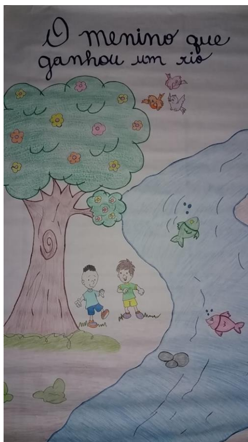
Cartaz do conto –