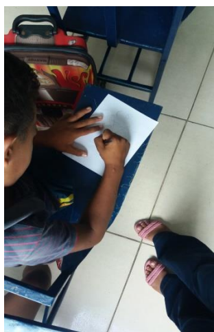
Momento do desenho.