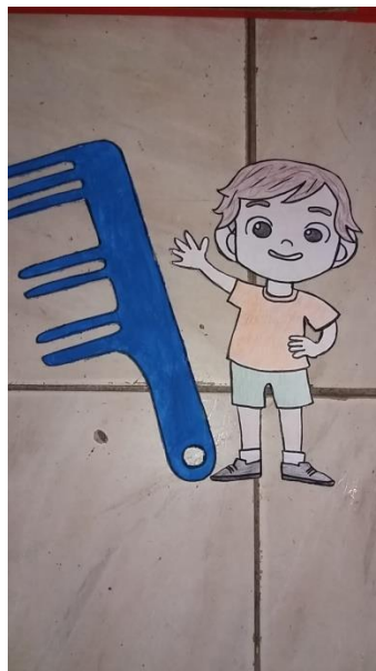
Conto Desobjeto – Manoel de Barros.