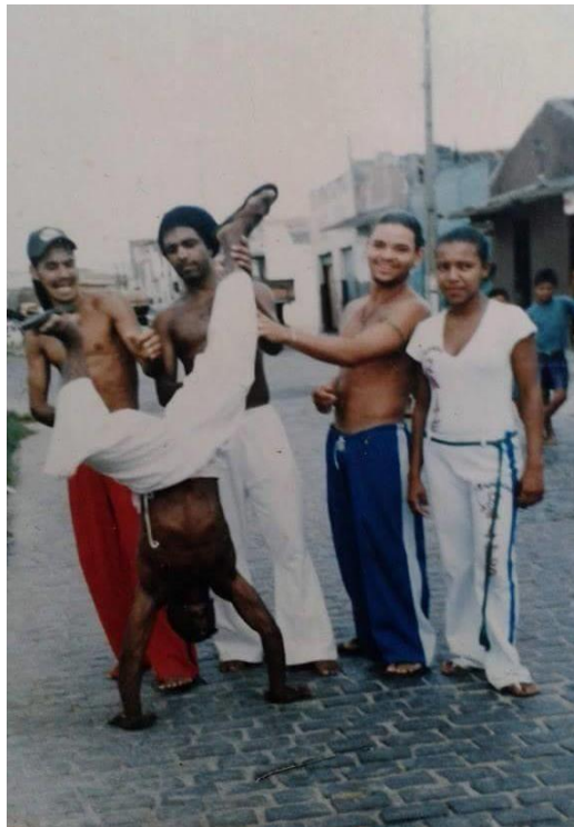
Figura 1 – Os capoeiristas de Coité.

É perceptível que neste período da história da cidade, o objetivo era apenas se divertir e aproveitar os momentos proporcionados por esta pratica, nítido na forma espontânea dos jovens, em outras palavras “vadiar”, sem se preocupar com mais nada.