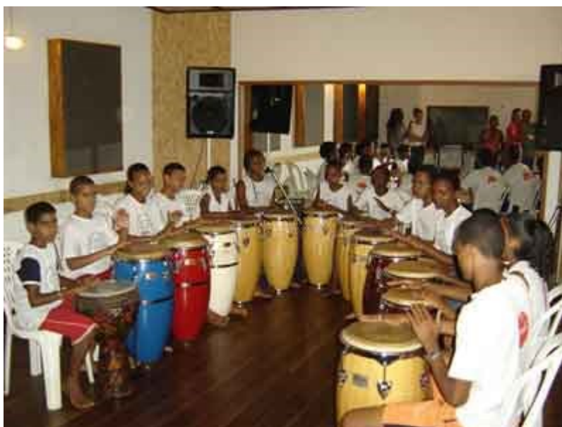
Foto 2: Ensaio dos jovens percussionistas estúdio da Escola Percussiva.

Nesse contexto, o projeto já atendeu mais de 150 alunos que tiveram uma formação técnico-musical qualificada. Desse modo, a escola percussiva amplia o acesso dos adolescentes ao mercado de trabalho. Dentro de um cenário concorrido ela visa aperfeiçoar-se para se tornar um centro de iniciação musical, com formação técnica, priorizando o estudo de instrumentos, como percussão, e sua fabricação artesanal. Tudo isso, proporciona a integração dos alunos, transformando-os em sujeitos aptos ao exercício de sua cidadania e elevação de sua auto-estima étnico-cultural.