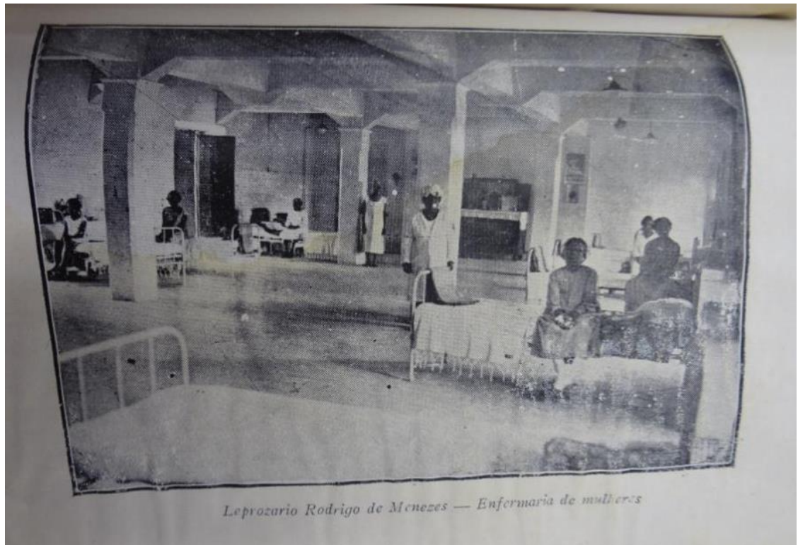
Figura 4 – Leprosário Rodrigo de Menezes – Enfermaria de mulheres.