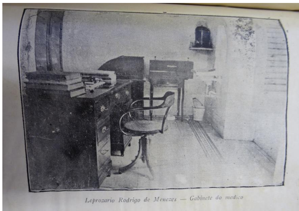
Figura 7 – Leprosário Rodrigo de Menezes – Gabinete do médico.