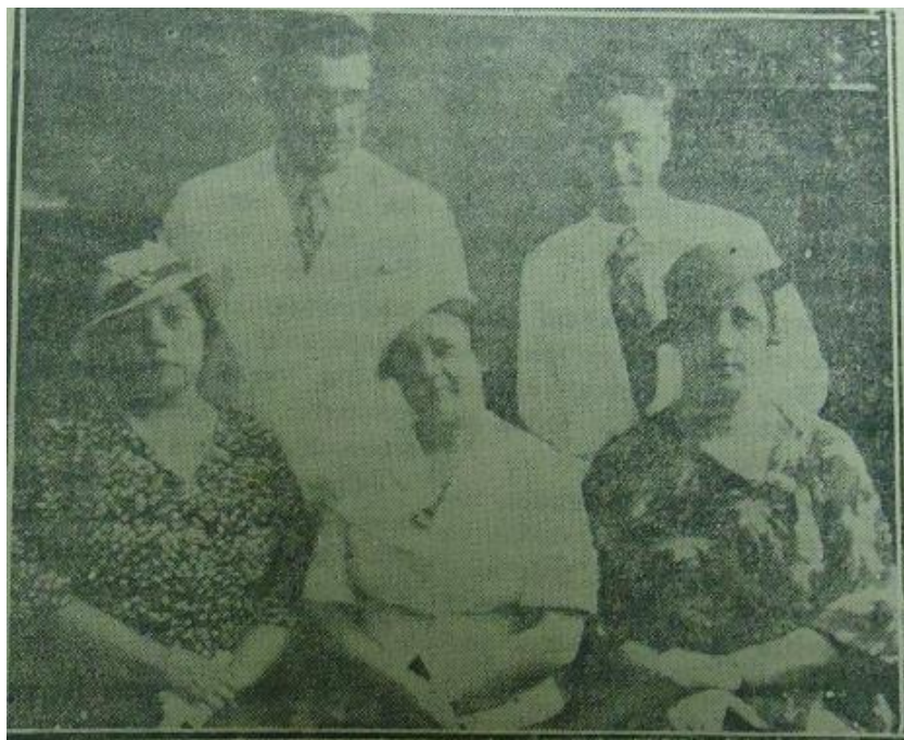
Figura 8 – Comissão de organização da Campanha de Solidariedade na cidade de Salvador-BA.