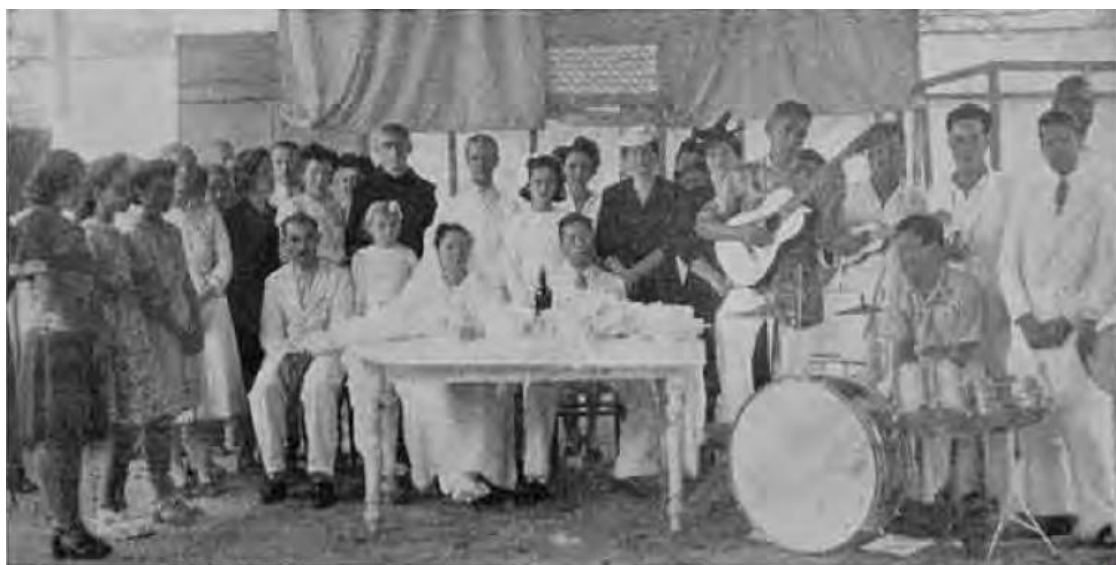
Figura 1 – Casamento de internados no Leprosário Rodrigo de Menezes.