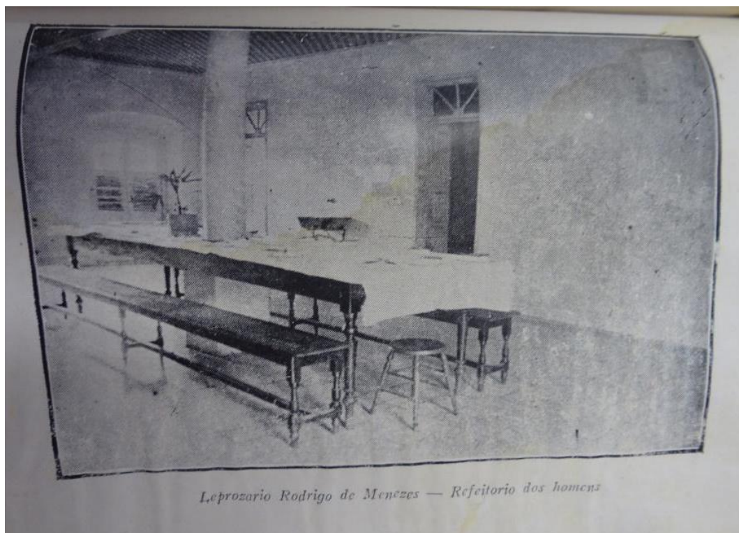
Figura 5 – Leprosário Rodrigo de Menezes – Refeitório dos homens.