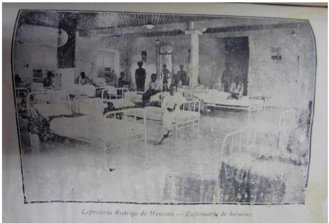
Figura 3 – Leprosário Rodrigo de Menezes – Enfermaria de homens.

eugenia em três formatos. O primeiro seria basicamente uma eugenia positiva, pautada na educação dos jovens para o matrimônio. O segundo, uma eugenia negativa, que visava evitar ou limitar o nascimento de sujeitos doentes ou degenerados. E, por último, a eugenia preventiva, que tinha como objetivo combater o analfabetismo e a melhoria da “raça” (BATISTA, 2017, p. 125). A eugenia preventiva teria tido maior relevância na sociedade baiana. O pensamento eugênico foi perdendo força em meados de 1930, período em que a medicina e a legislação já apresentavam mudanças devido às novas descobertas sobre tratamentos e meios de transmissão das doenças.