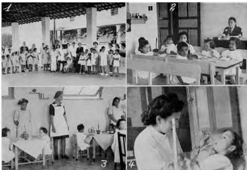
Figura 9 – Preventório Eunice Weaver.