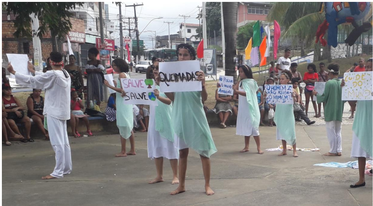
(Peça "O Homem não Ajuda o Homem", 2019)