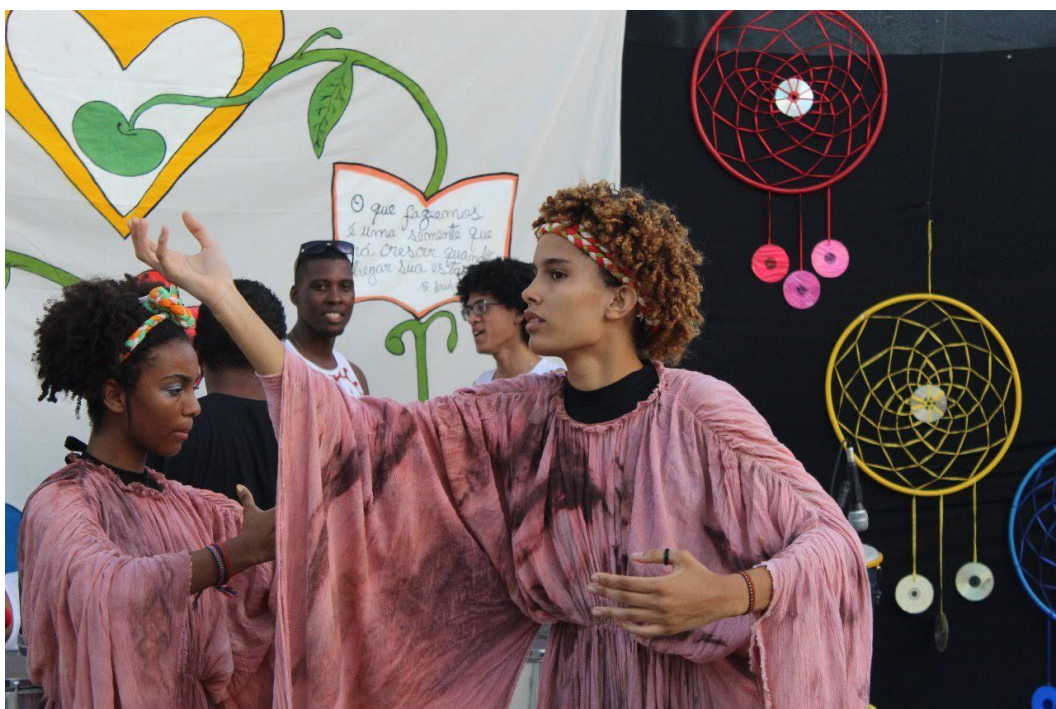
T(Peça "Criação", 2019)