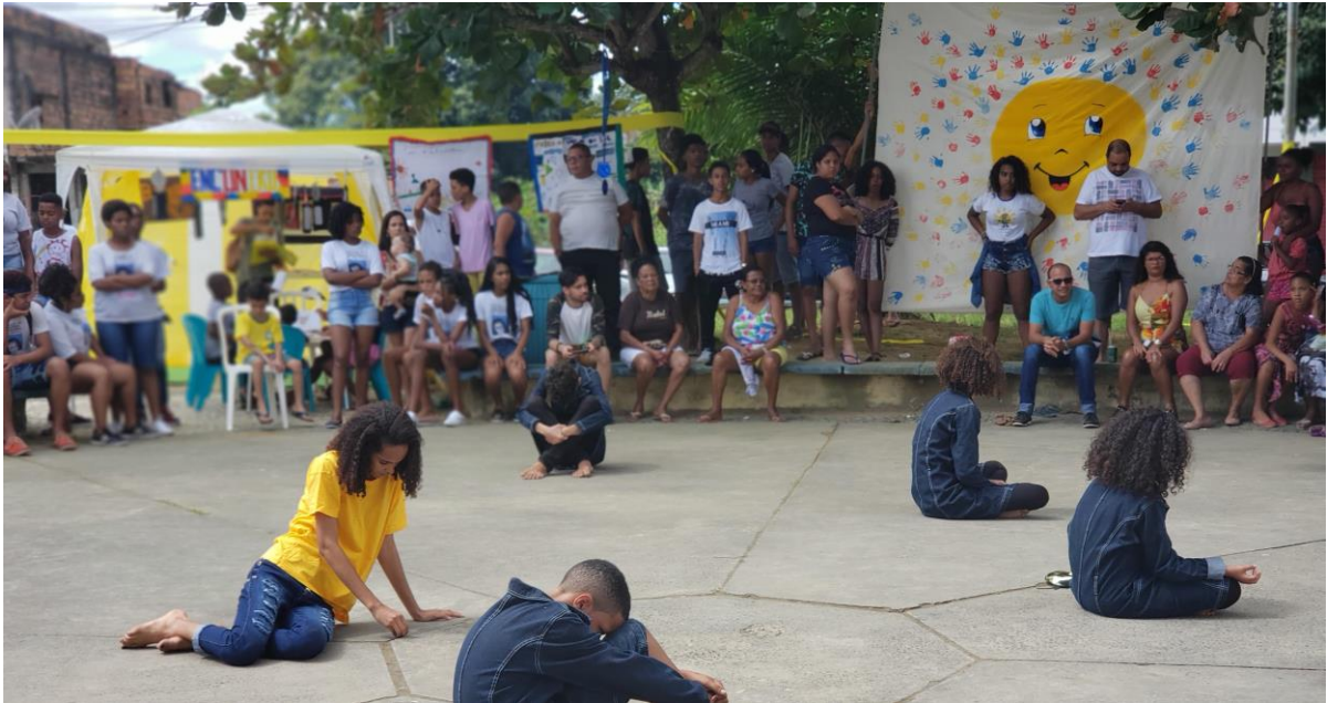
(Encenação em Feira de Arte e Cultura, 2017)