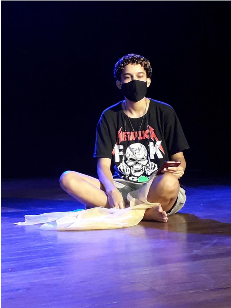
(Ensaio de apresentação, 2021)