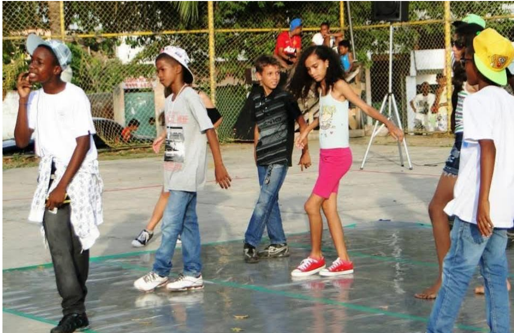
(Apresentação: "Menino de Rua", 2012)