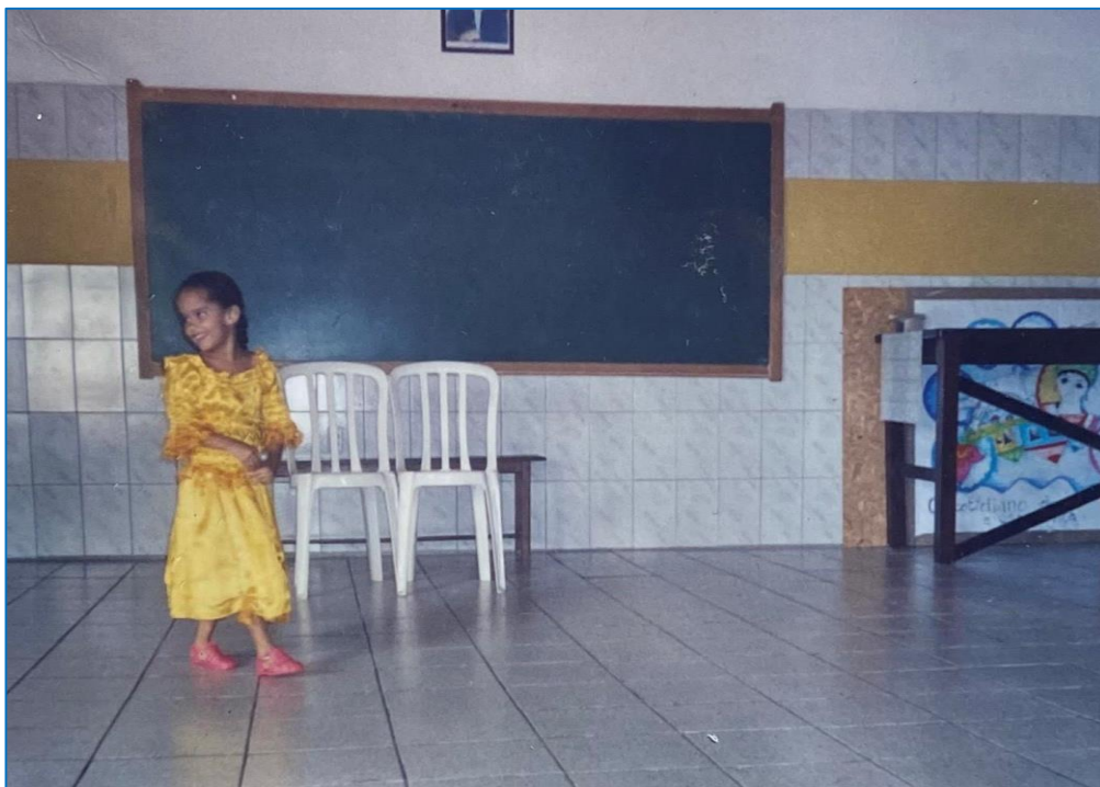
(Peça "Branca de Neve", 2006)