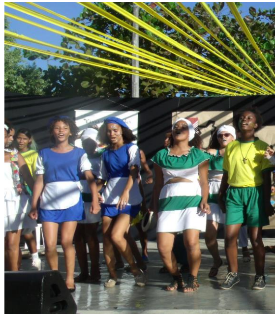
(Peça "Construindo Sonhos", 2015)