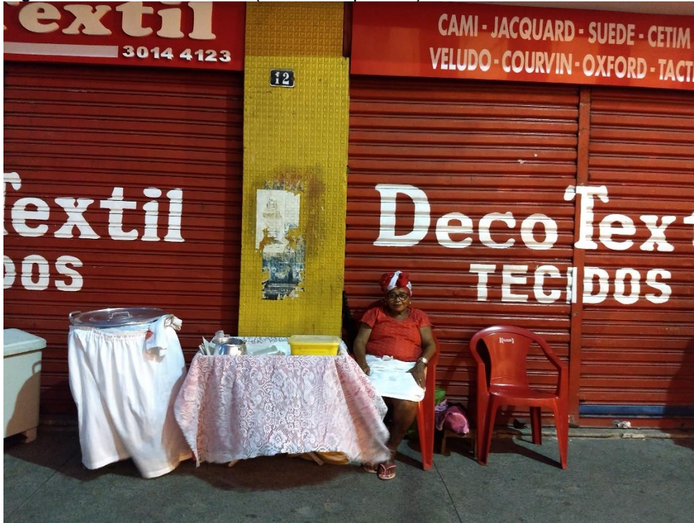
Figura 7: Vendedora Jacira (Abará temperado).