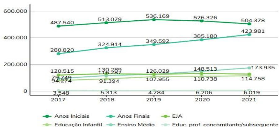
Gráfico 1 - Número de matrículas de alunos com deficiência, transtornos globais do desenvolvimento ou altas habilidades em classes comuns ou especiais exclusivas, segunda etapa de ensino - Brasil

Para entendermos melhor as mudanças que ocorreram a partir dessas modificações legislativas, de acordo com o Censo Escolar de 2021, o número de matrículas do público-alvo (as pessoas com deficiência e transtornos globais do desenvolvimento e altas habilidades) chegou a 1,3 milhão neste ano, com um aumento de 26,7% em relação a 2017, sendo que o maior número de matrículas está centralizado na etapa do ensino fundamental, principalmente nos anos iniciais. Desses estudantes, mais de 90% de alunos estão incluídos em classes comuns em 2021 (com exceção da EJA) como podemos observar nos gráficos 1 e 2: