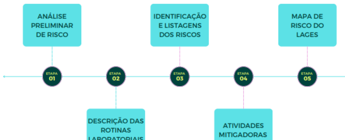
Figura 3 – Fluxograma da organização da coleta de dados e organização para apresentação dos resultados da pesquisa.

Como etapa inicial foi elaborado um estudo de Análise Preliminar de Riscos (APR), constituindo-se numa técnica de investigação para identificar fontes de perigo, consequências e medidas corretivas simples, sem aprofundamento técnico, resultando em tabelas de fácil leitura. Essa forma de abordagem é fator determinante para um local com uma boa higiene e preventivo de acidentes.