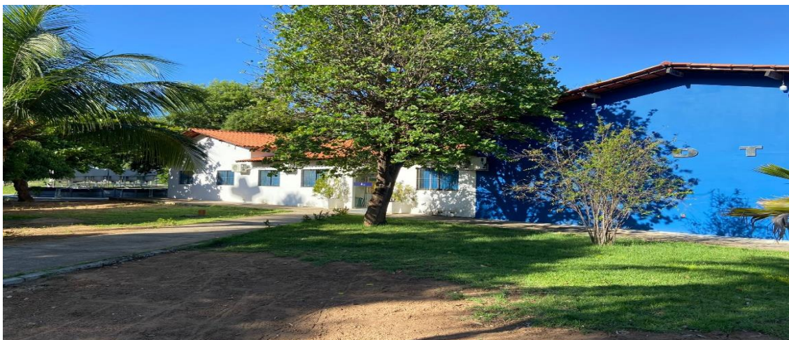
Figura1- Centro de Desenvolvimento e Difusão em Tecnologias Aquática/CDTA.