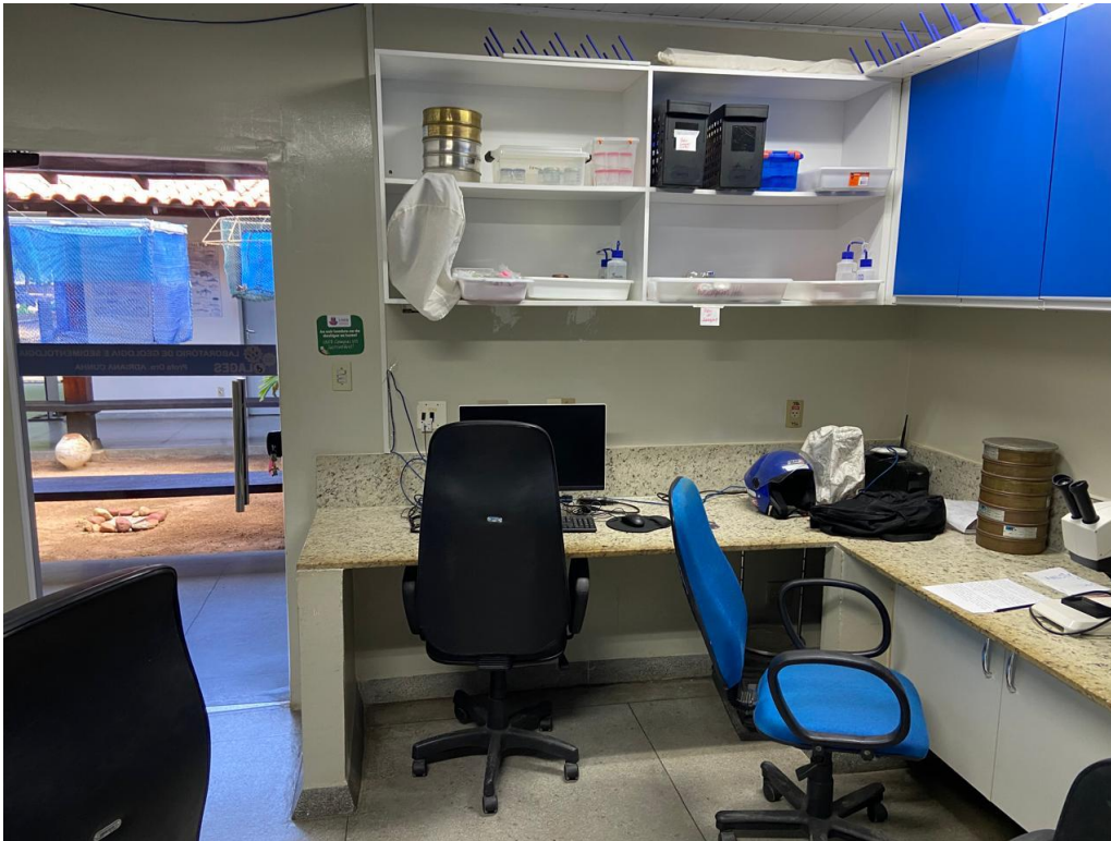
Figura 2 - Laboratório de Geologia e Sedimentologia/LAGES.