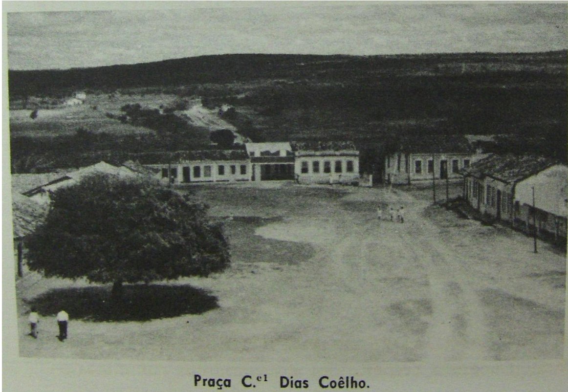
Figura 8 Praça Cel. Dias Coelho