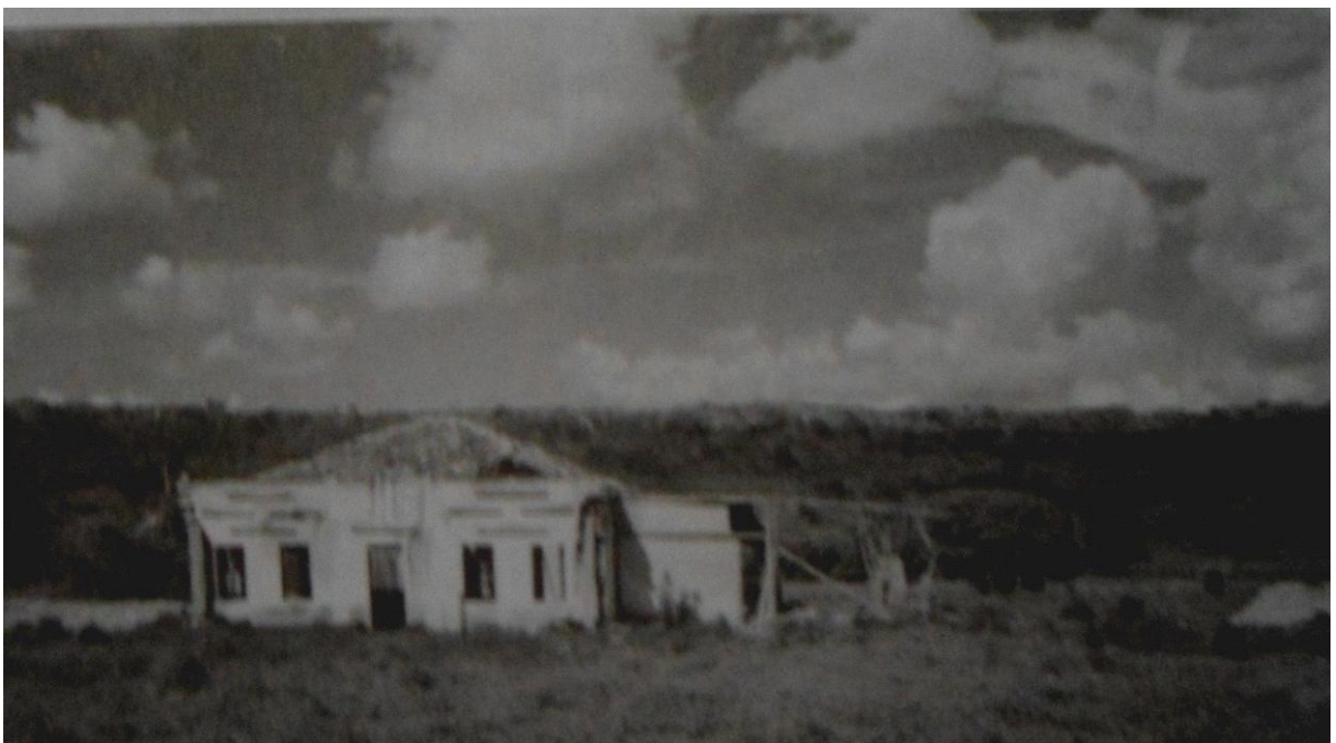
Figura 3 - Fazenda Gurgalha

Neste período a Chapada Diamantina enfrentava os resquícios da seca de 1868 e segundo Sampaio (2009, p.27); epidemias de cólera e varíola em Salvador e Recôncavo diminuíram o consumo de carne e afugentaram os boiadeiros ficando quase que impossibilitado o comércio de animais. A seguir, figura com fotografia da fazenda Gurgalha.