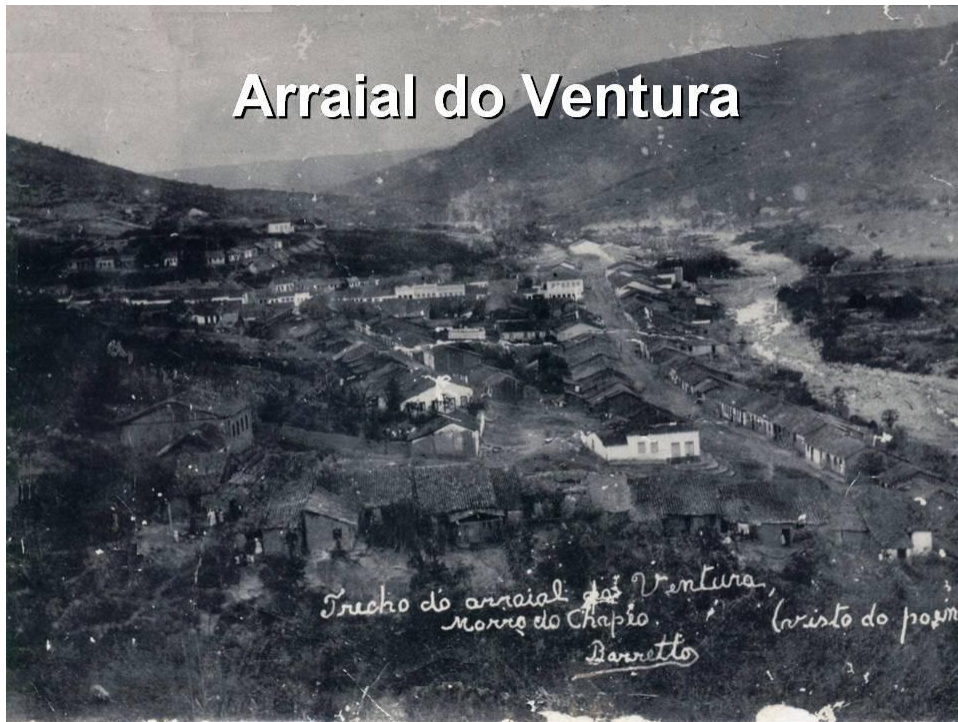
Figura 2 - Arraial do Ventura