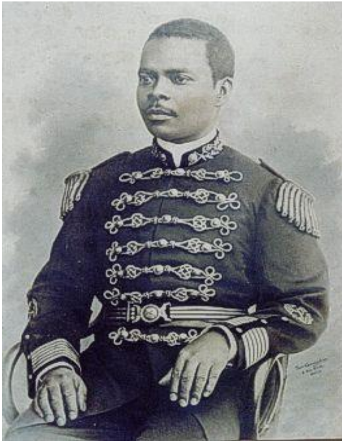
Figura 4 Coronel Dias Coelho com farda de gala da Guarda Nacional

Dias Coelho trabalhou na Farmácia do Major Pedro Celestino, foi Tabelião de Notas do cartório local, mas veio a se tornar um homem rico e influente no município, após envolver-se com o comércio de carbonato, feito que lhe rendeu fortuna e condição para a compra de sua patente de tenente coronel; segundo Sampaio, (2009,p.45), no início da década de noventa do século XIX ele já assinava como Coronel. Com a patente, Dias Coelho ganha prestígio e inicia sua carreira política em Morro do Chapéu.