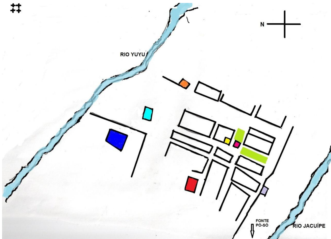
Figura 7 - Croqui Morro do Chapéu em 1910