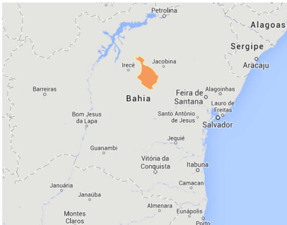
Figura 1 Mapa de localização de Morro do Chapéu