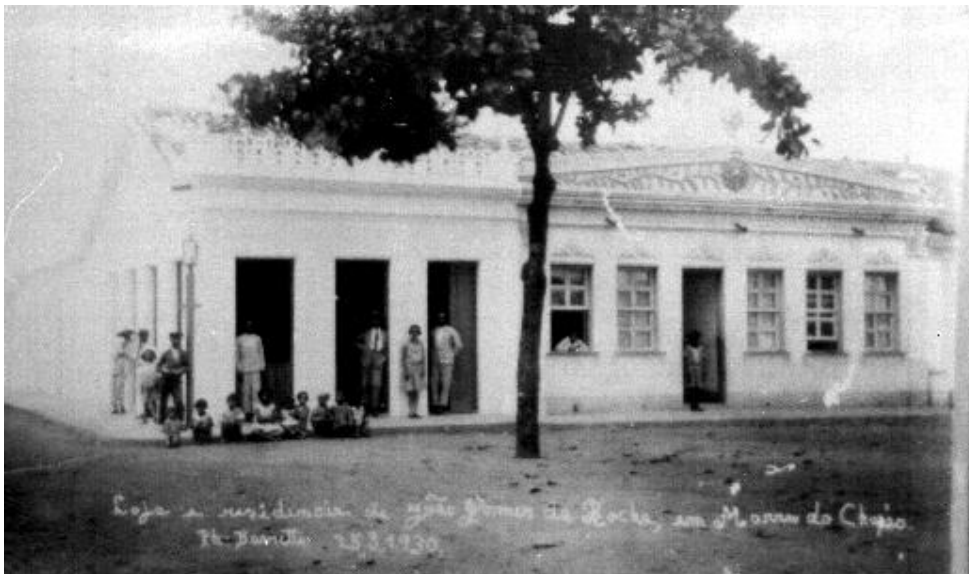
Figura 9 Exemplo de casa com as especificações contidas na Lei nº30.