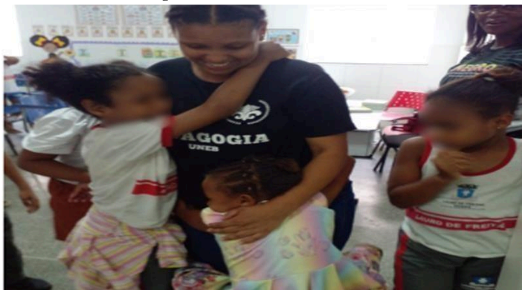
Figura 4 – A última visita nas salas

A valorização da cultura quilombola foi um aspecto central da pesquisa. Por meio de atividades como o contato com histórias locais, rodas de conversa e o resgate de lendas quilombolas, os estudantes puderam se conectar com suas raízes e compreender a importância de sua identidade cultural. Esse movimento de valorização da ancestralidade não apenas enriqueceu o currículo escolar, mas também fortaleceu o senso de pertencimento e autoestima dos alunos, que passaram a se considerar protagonistas de sua própria história e cultura.