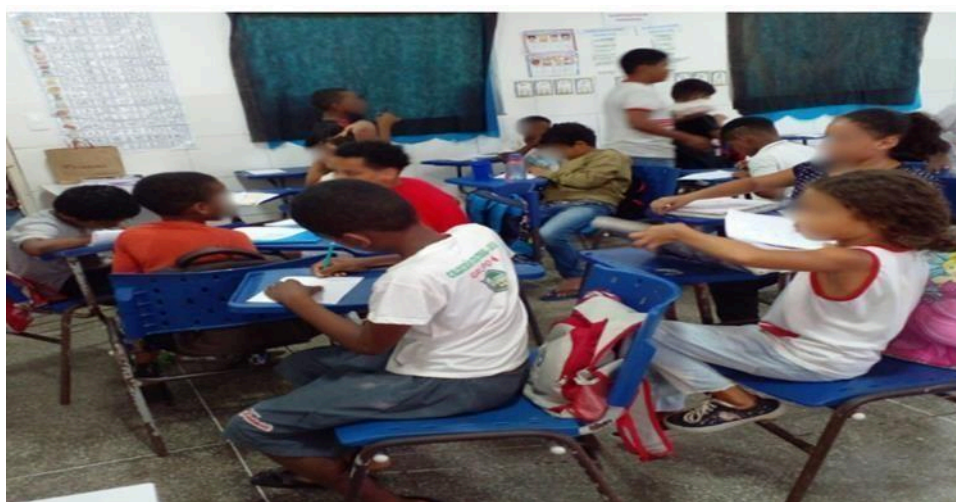
Figura 7 – Criação dos desenhos para a árvore

Ao serem questionadas sobre os professores, as crianças compartilham expectativas que vão além do ensino acadêmico. Elas querem professores que sejam amigos, que ouçam suas ideias e que tornem as aulas mais dinâmicas e divertidas. É razoável a valorização que elas têm pelos docentes, mas também o anseio por uma relação mais próxima e afetiva. Isso reflete o quanto o vínculo emocional e o acolhimento são fundamentais para o sucesso do processo de aprendizagem.