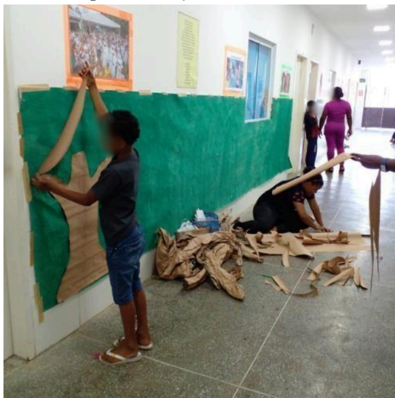
Figura 5 – A criação da árvore

A “Árvore dos Desejos”, criada para expor as reflexões e sonhos das crianças, foi um momento de grande emoção. Cada desenho, ideia e palavra revelava uma visão única sobre o que elas esperavam da escola. Foi possível perceber que, para elas, a escola não é apenas um espaço físico, mas um lugar onde seus sonhos podem ganhar forma. A empolgação ao verem seus trabalhos expostos mostrou como é importante que as vozes sejam ouvidas e valorizadas.