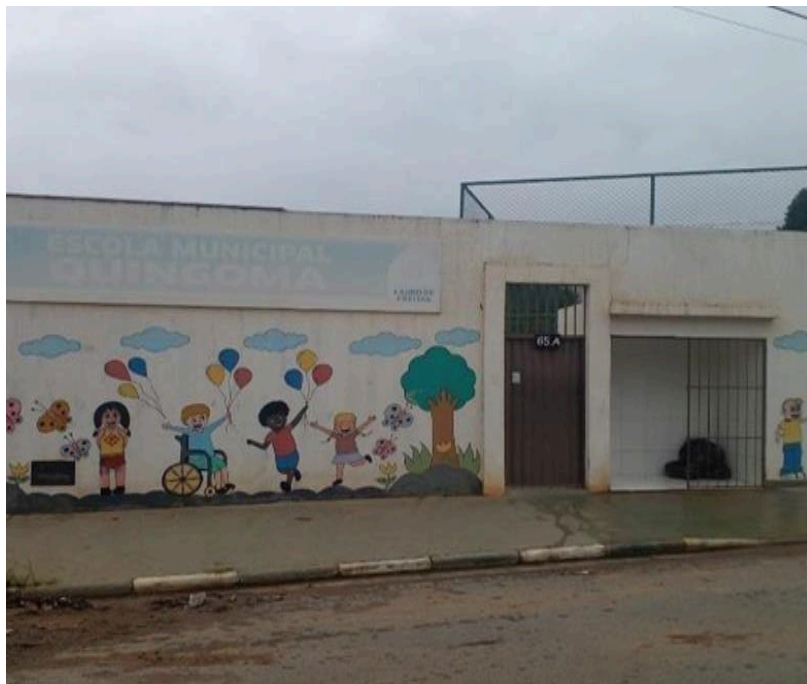
Figura 2 – A fachada da escola