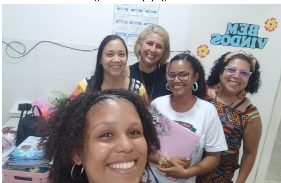
Figura 1 – A equipe gestora

Os resultados obtidos foram enriquecedores. Os professores relataram que as crianças do 1º ao 3º ano ainda estavam em processo de alfabetização, com dificuldades para dominar a leitura e a escrita, enquanto os alunos do 4º e 5º ano já apresentavam fluência na leitura. Essa informação destacou a necessidade de práticas pedagógicas mais específicas e contextualizadas para as turmas iniciais, que demandam maior apoio no desenvolvimento das habilidades básicas. Assim, os resultados enriqueceram a pesquisa ao revelar os desafios concretos enfrentados pela escola e as possibilidades de intervenção pedagógica capazes de fortalecer o aprendizado e valorizar a identidade cultural dos alunos.