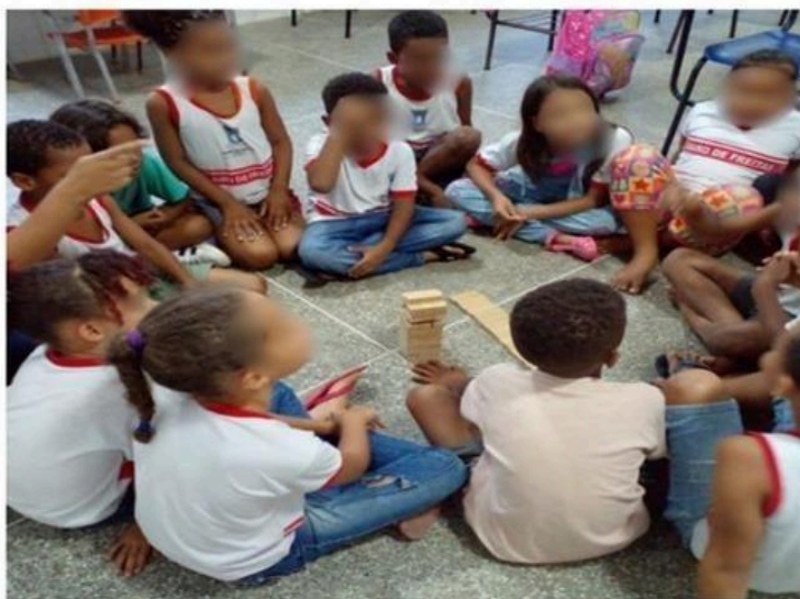
Figura 3 – O acolhimento e o jenga