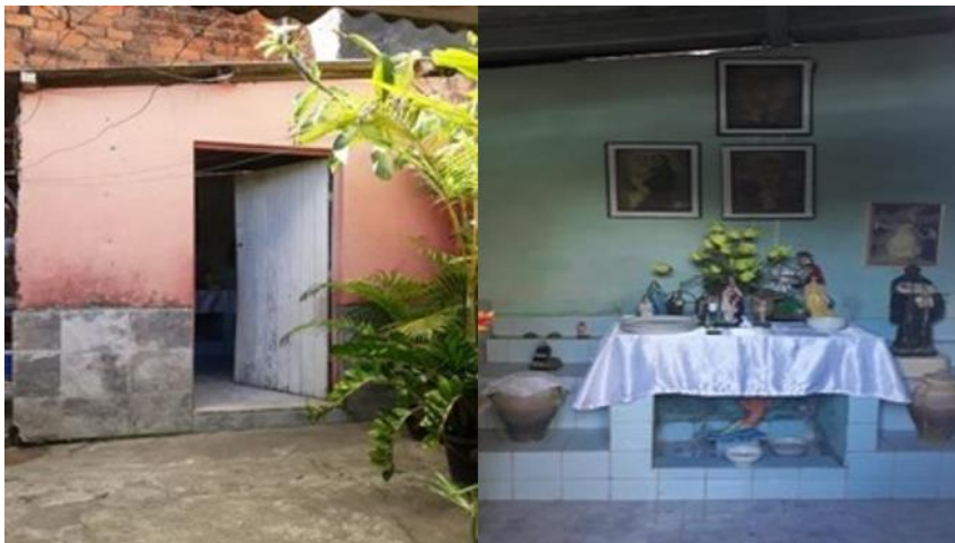
Figura 2: Quartinho dos fundos onde eram realizados os atendimentos