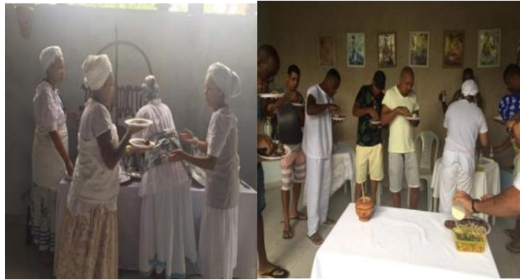
Figura 9: Feijoada de Nkossi (Ogum)