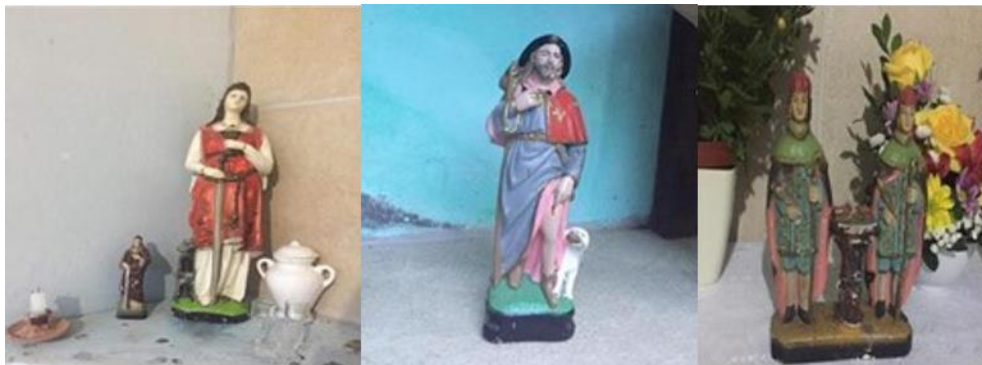
Figura 7: Altar de Santa Barbara e Santo Antônio, Imagem de São Lazaro e Imagem de São Cosme e São Damião.

Não é mais preciso ser católico para ser brasileiro; pode-se ter qualquer religião ou nenhuma. O sincretismo não faz mais sentido e para muitos dos adeptos do candomblé, sobretudo sua liderança mais esclarecida (em todas as partes do Brasil, retirar dessa religião afro-brasileira os elementos católicos faz parte desse retorno à origem, dessa volta à África, que é o retorno de símbolos religiosos e não o desejo de retorno às condições de vida do negro, do escravo, do antigo (...). O novo candomblé se põe em pé de igualdade com o catolicismo. (PRANDI, 2006, p.108).