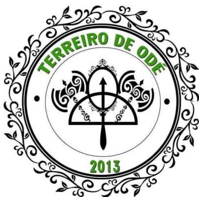
Figura 3: Emblema do Terreiro de Odé

É importante ressaltar que os candomblés de tradição angolana são fortemente influenciados pela cultura iorubana, o contrário também ocorre, as influências são múltiplas e cruzadas sem necessariamente perder a identidade de cada uma das nações, porém o candomblé de nação Angola acaba passando também pelo processo de “nagoização”. É relevante o discurso de Parés (2006) a esse respeito: “O processo que gerou a supremacia nagô no Candomblé baiano não pode ser explicado como efeito de apenas uma causa, mas deve ser entendido como resultado da complexa interação de uma pluralidade de fatores” (PARÉS, 2006, p. 159).