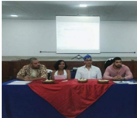
Figura 12: Mesa de diálogo no Colégio Estadual Francisco da Conceição Menezes