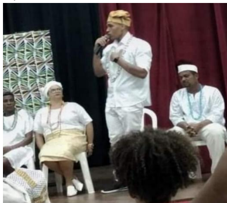
Figura 13: Homenagem da Sec. de Cultura de Santo Antônio de Jesus pelo dia do Sacerdote e Sacerdotisa