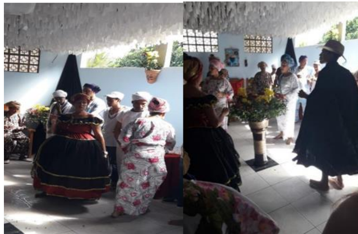
Figura 10: Festa de Pomba-Gira Esmeralda e Exú Catiço Marabô