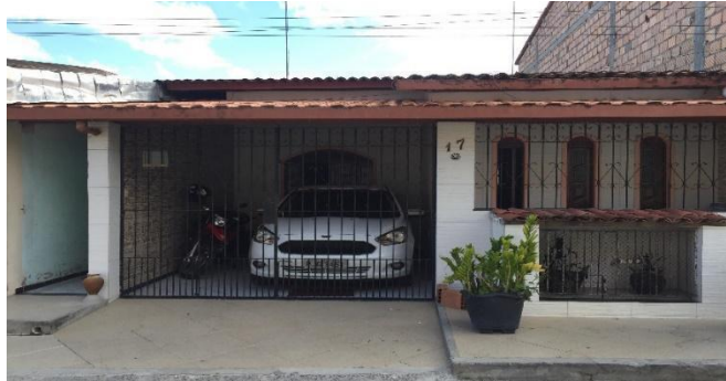
Figura 5: Residência e a entrada do Terreiro de Odé