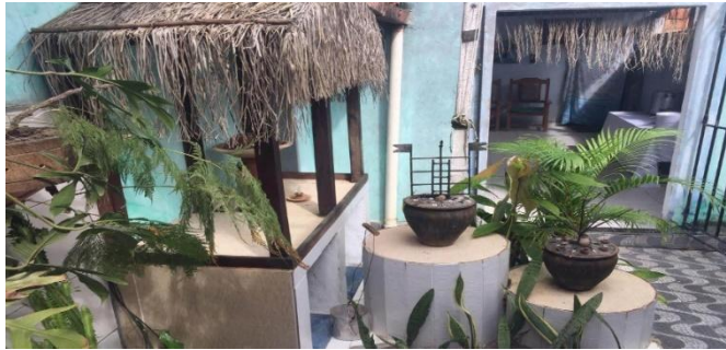
Figura 6: Área do barracão