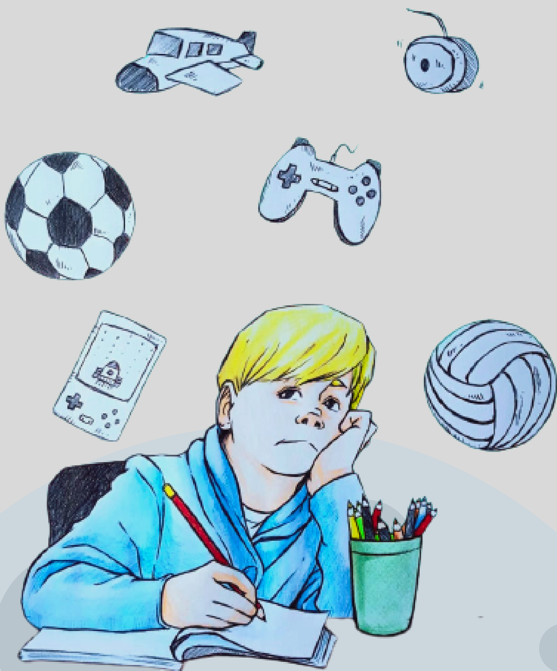
Ilustração da capa: José Adriano Freitas