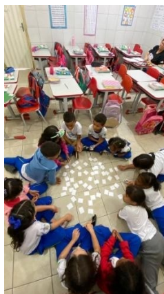
FIGURA 2- JOGO DA MEMÓRIA