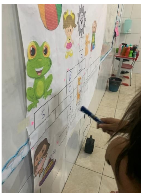
FIGURA 3 - CRUZADINHA