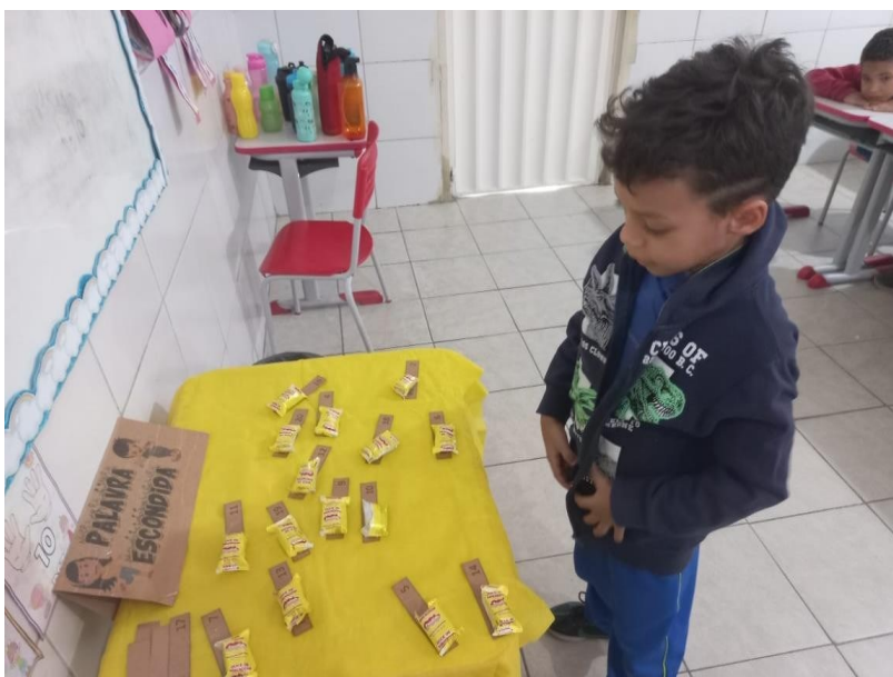
FIGURA 8 - BRINCADEIRA COM PALAVRAS