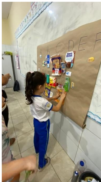
FIGURA 4 - ALFABETO