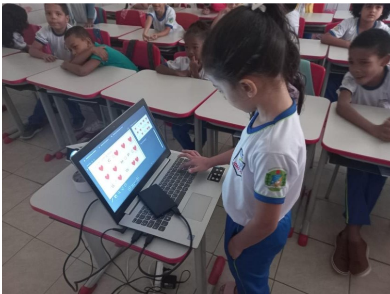
FIGURA 6 - JOGO VIRTUAL