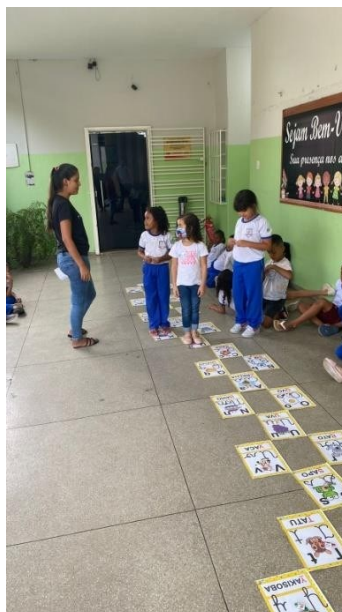
FIGURA 1- JOGO DE TRILHA