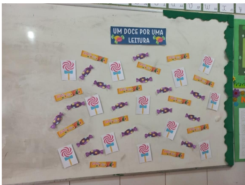
FIGURA 7– BRINCADEIRA DA LEITURA

retirá-la do quadro tem uma ficha de leitura a criança que tenta ler ganha um doce.