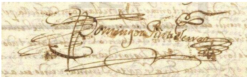
Figura 1 - Assinatura de Domingos Pinto Ferraz