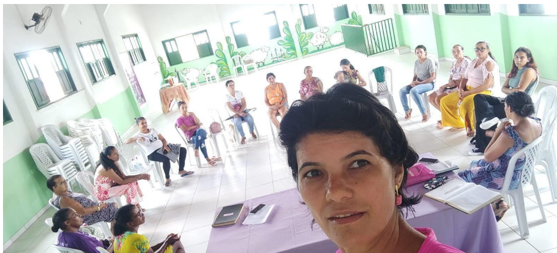
Fotografia 1 – Reunião da AMTQ para organização da comemoração do dia das mulheres

Fonte - Arquivo da Associação de Mulheres Trabalhadoras de Quixabeira – BA.