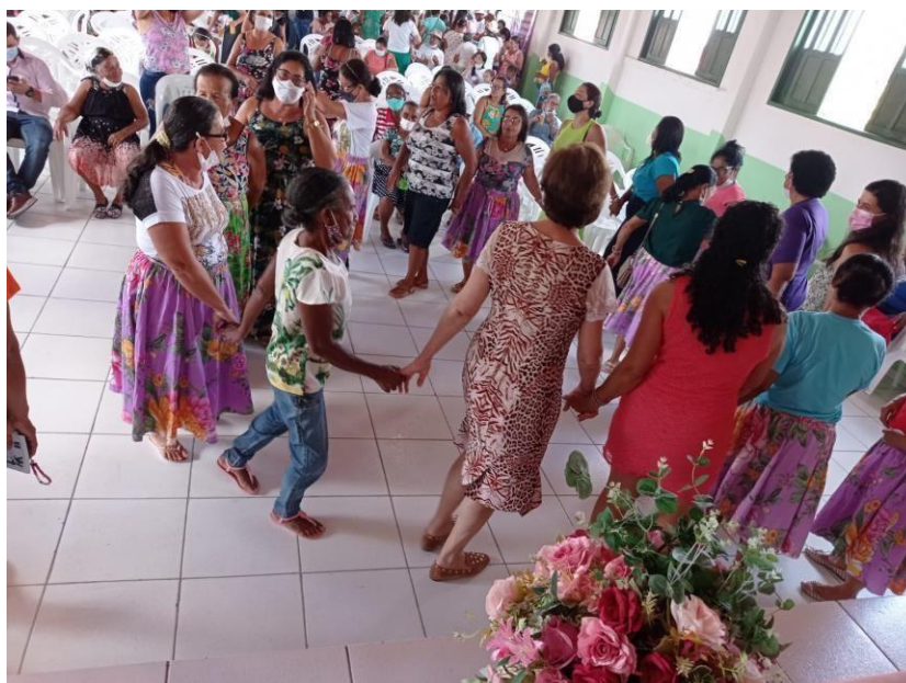
Fotografia 4 – ‘Cantigas’ de roda, comemoração ao Dia Internacional da Mulher em 2022. Primeiro evento de grande porte da AMTQ, “pós” pandemia.