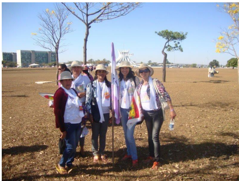
Fotografia 3 – Marcha das Margaridas de 2011.