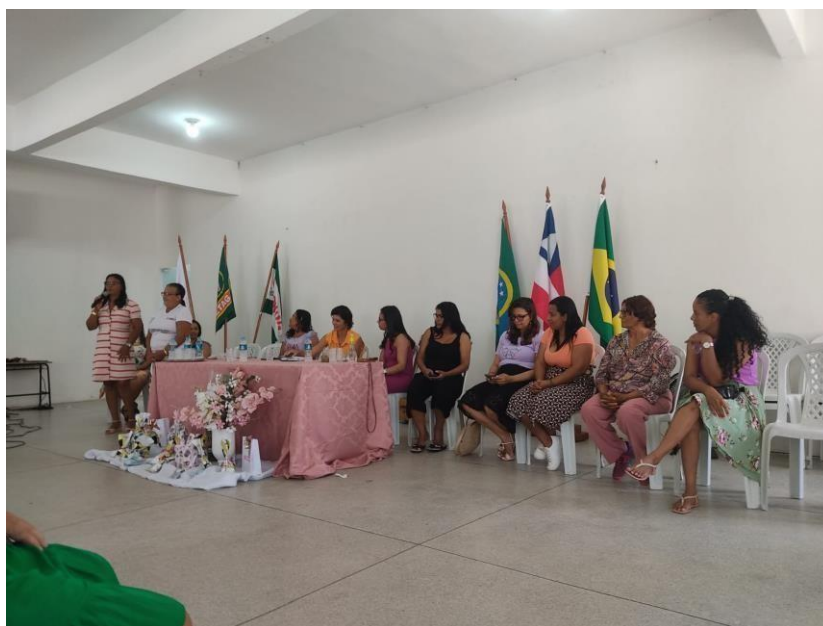
Fotografia 5 – Comemoração ao Dia Internacional da Mulher em 2023