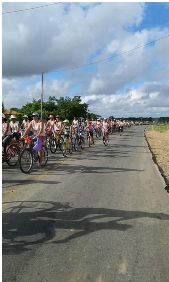
Fotografia 2 – A ‘Bicicletada’: 1ª Passeio Ciclístico Feminino da AMTQ, 2016.