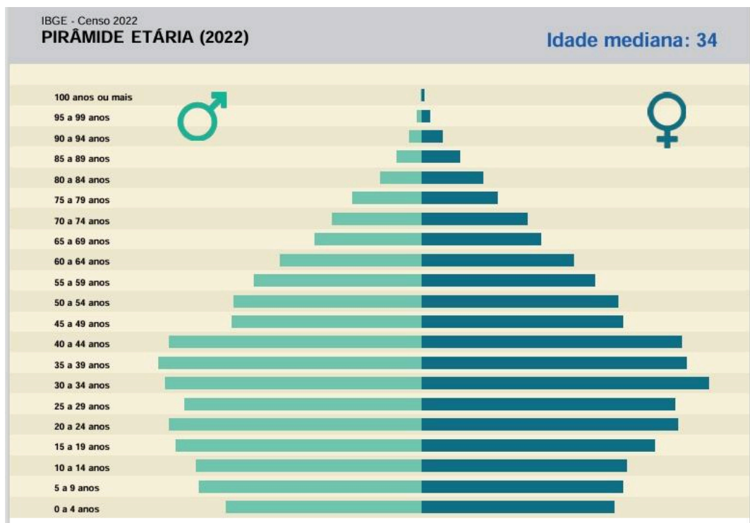
Figura 2 – Pirâmide etária do município de Caetité (2022)

uma distribuição relativamente equilibrada entre homens e mulheres nas faixas etárias jovens e adultas, mas, a partir dos 60 anos, a presença feminina torna-se mais expressiva, o que indica um processo de envelhecimento populacional com maior representatividade do sexo feminino. Essa informação é relevante para compreender as dinâmicas sociais e a importância das mulheres nas redes de cuidado e sociabilidade do município, aspectos que dialogam diretamente com o objetivo desta pesquisa.