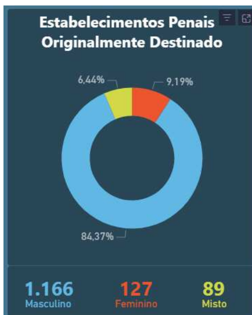
Figura 1 - Tipo de estabelecimento por destinação originária