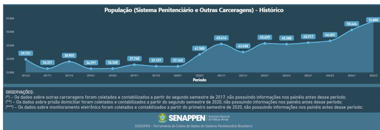
Figura 2 - Evolução das mulheres privadas de liberdade

É válido esclarecer o perfil dessas mulheres, segundo o último relatório divulgado pelo DEPEN, o Infopen Mulheres de 2017, 68% das presas é pelo crime de tráfico de drogas; 50% da população prisional é formada por jovens de 18 a 29 anos e a sua maioria, cerca de 62% é negra. A análise desses dados é de extrema importância para entender o crescimento carcerário e quem é a população mais afetada pelas políticas criminais e sobre quem as obras literárias têm discorrido ao falar sobre encarceramento.