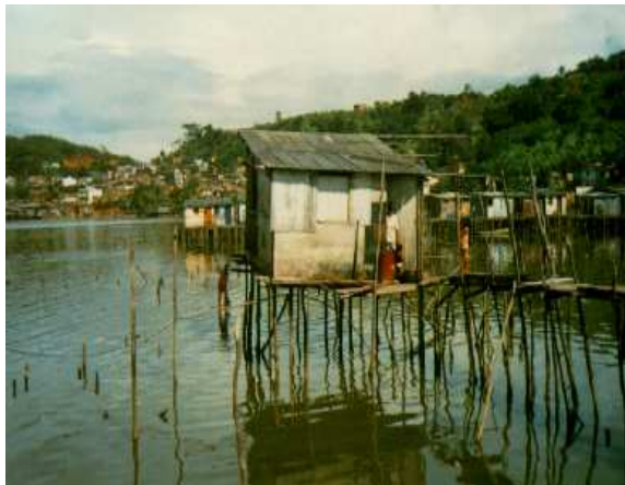
Figura 2. 3 Exemplo de Palafita

instabilidade estrutural e risco, por causa da má qualidade dos materiais utilizados e da sua construção sobre a água (PMS, 1993, p. 11).