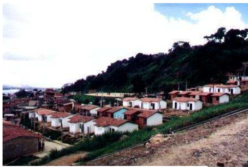
Figura 3. 2 Loteamento Araçás II