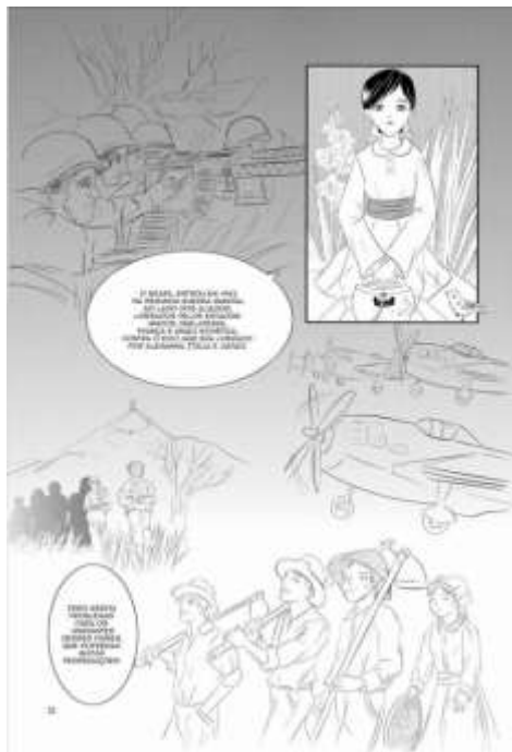
Figura 6: Página do livro O Vento do Oriente

Seguindo a questão dos migrantes foi apresentado o livro “O vento do oriente” produzido pelo IBGE, para homenagear a imigração japonesa no Brasil. Este livro tem a questão de ser um mangá, o que chama muito a atenção dos jovens, mas que se tornou um desafio para os alunos mais velhos, que não tem costume de leitura e culturalmente não utilizam esse tipo de entretenimento. O livro aborda a questão da vinda dos japoneses para o Brasil e serviu para introduzir também a questão da urbanização do Brasil.