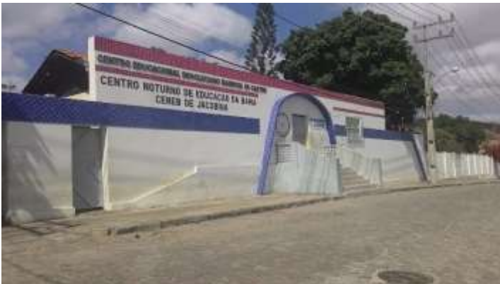
Figura 5: Fachada do colégio estadual Centro Educacional Deocleciano Barbosa de Castro