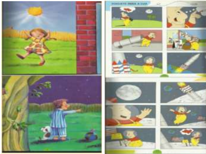
Figura 4: Partes do livro Planeta e estrelas de Pierre Winter

trabalhar com orientação espacial, que é a capacidade de perceber e compreender a posição e o relacionamento de objetos no espaço tridimensional.