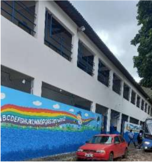
Figura 1: Fachada da Escola Armando Xavier de Oliveira