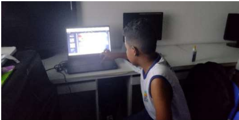
Figura 3: Estudante que auxiliou a passar o texto na televisão

O texto 4, do livro “Planeta e estrelas” de Pierre Winter, retrata o sistema solar a partir da observação do Sol e das estrelas. A partir de balões ele traz os conteúdos da unidade que começou a ser trabalhada depois de paisagens. O texto foi apresentado na televisão, porque não tem um livro para cada aluno e foi uma ótima experiência, pois a leitura aconteceu de forma coletiva, uma vez que, vários alunos se propuseram a ler trechos pequenos e o diálogo sobre o assunto “sistema solar” e movimentos da Terra, foi bem proveitoso.