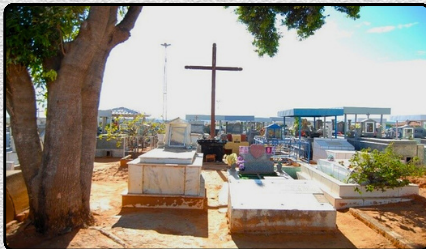
Cruzeiro do Cemitério Municipal de Botuporã.