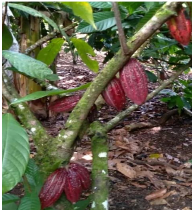
Figura 2- Imagem da lavoura cacaeira