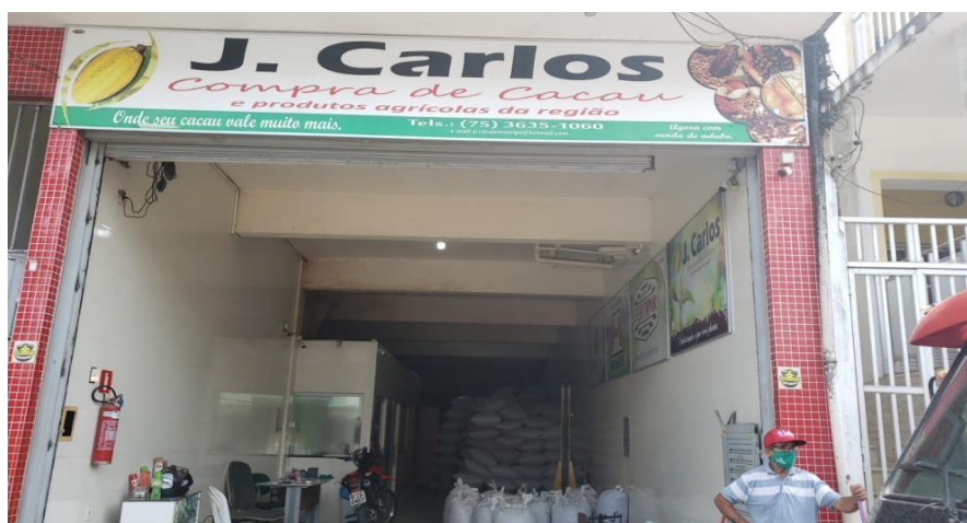
Figura 4- Imagem de um dos armazéns do município de Mutuípe-Ba