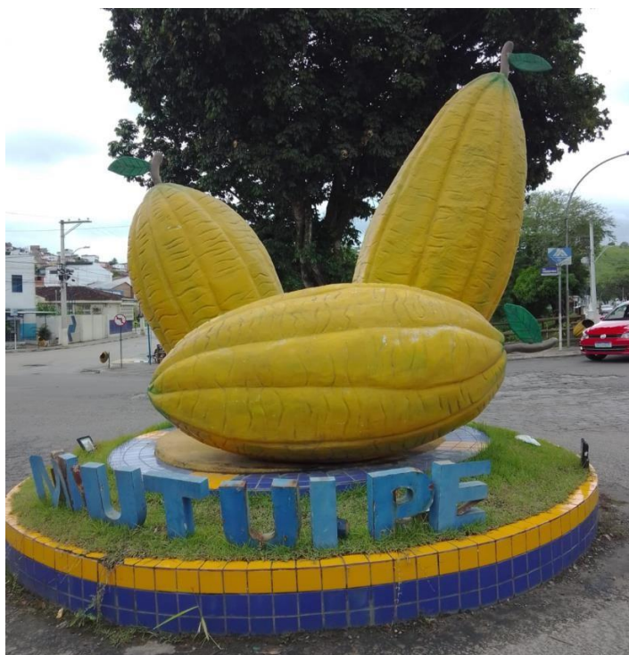
Figura 3 - Imagem da rotatória no município de Mutuípe-Ba.