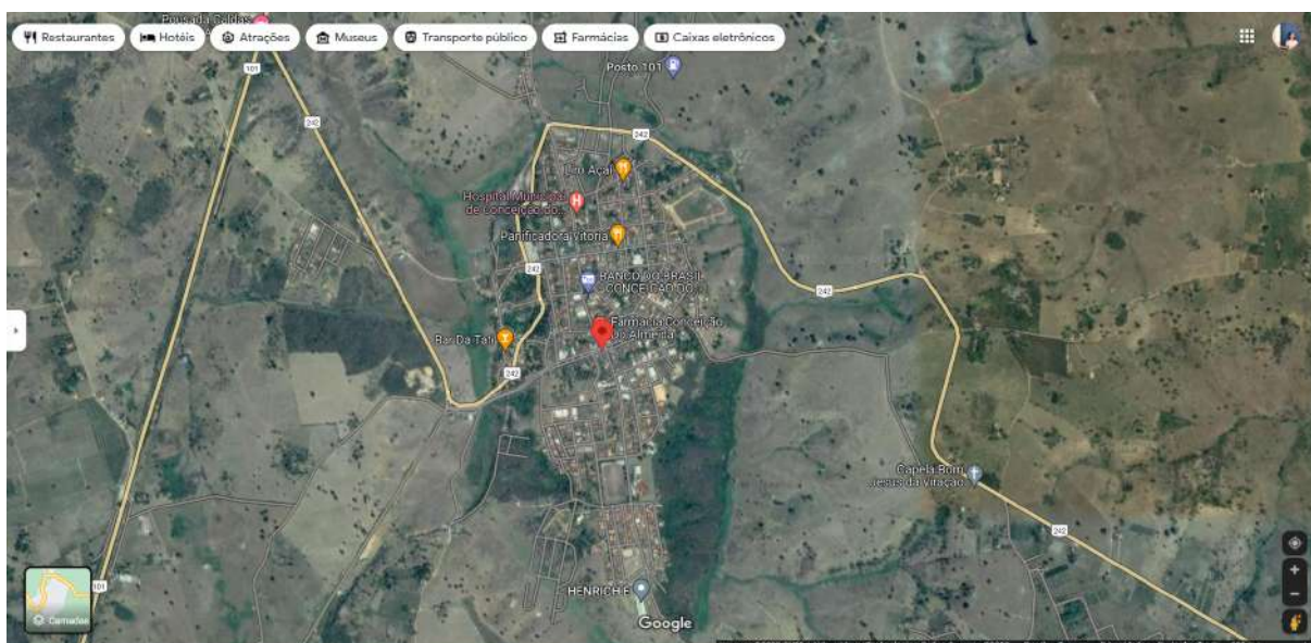
Figura 01 - Mapa de Conceição do Almeida - Zona Urbana

A localidade de realização da pesquisa é Comércio de Jaguaripe, zona rural pertencente ao município de Conceição do Almeida. De acordo com IBGE (2017), no século XIX, um agrupamento de pessoas se formou em torno da capela de Nossa Senhora e esse aglomerado recebeu o nome de Capela Almeidense, tendo em vista que a família proprietária do terreno pertencia à família Almeida Sande. Mediante o Ato Estadual de 18.07.1890, o município foi criado com território desmembrado de São Felipe e foi nomeado Conceição do Almeida.