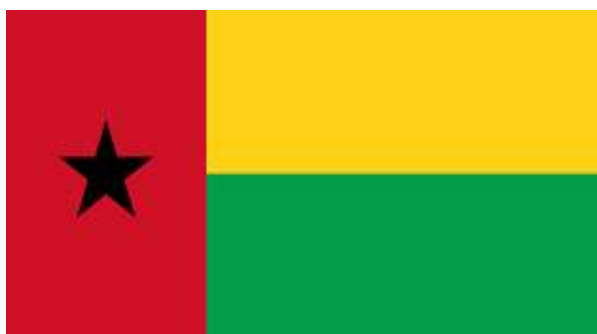
Figura 4: Bandeira República da Guiné-Bissau