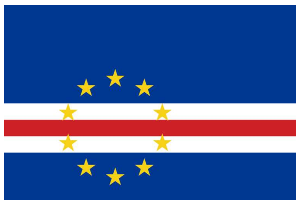
Figura 10: Atual bandeira da República de Cabo Verde criada em 1992.