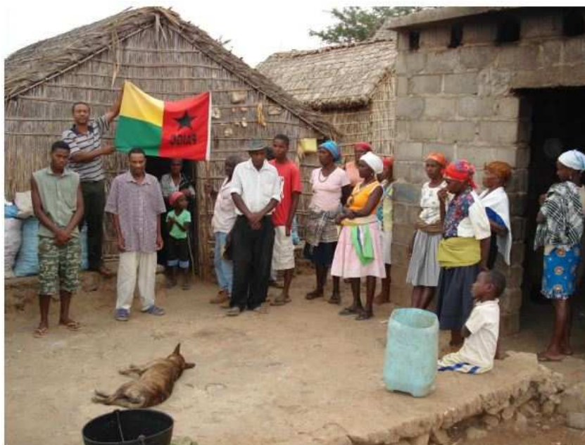
Figura 7: Populações Rabelados após a uma atividade religiosa