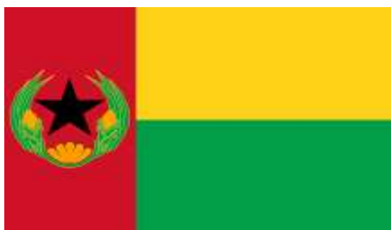
Figura 5: Bandeira da República de Cabo Verde (1975-1992)

No caso da primeira bandeira de Cabo Verde o que a diferenciava da bandeira da Guiné-Bissau era apenas a presença, na primeira, da coroa de espigas de milho que representa a tradição da economia de Cabo Verde e o aspecto preponderantemente rural da cultura do povo cabo-verdiano.