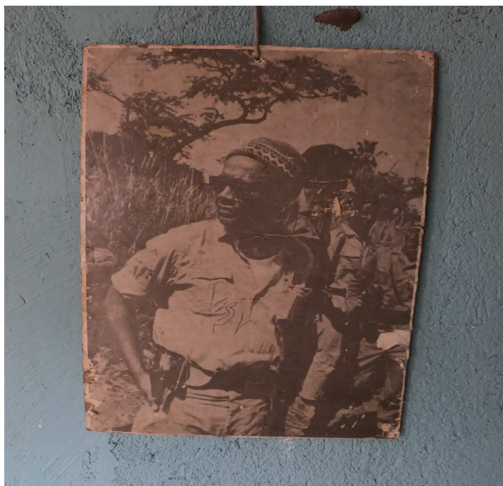
Figura 12: Poster antiga de Amílcar Cabral na casa de um dos Rabelados.