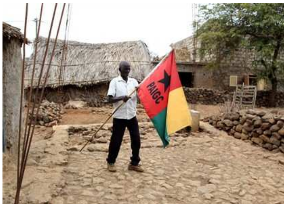
Figura 6: Ancião Rabelado portador da Bandeira

proclamação da independência de Cabo Verde em Praia, no dia 5 de julho de 1975. Foi neste evento que tiveram acesso à bandeira do PAIGC e não de Cabo Verde, algo que era normal, pois, o Estado confundia-se com o partido e os seus símbolos também. A partir daí, essas populações passaram a usar a bandeira recebida como um símbolo que representa o pertencimento a um coletivo e como um dos sinais diacríticos que os diferencia em relação aos demais grupos sociais cabo-verdianos.