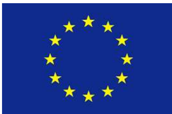
Figura 11: Bandeira da União Europeia.