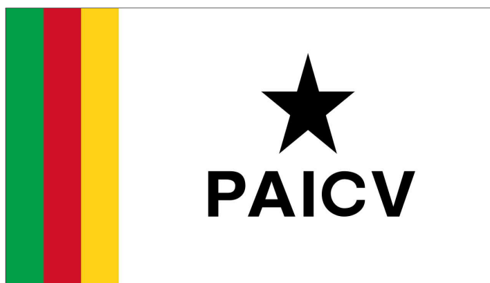
Figura 9: Bandeira do PAICV

Em 1980, o golpe de Estado na Guiné Bissau ocasionou a separação política definitiva com Cabo Verde e a transformação em PAICV e conseqüentemente uma nova bandeira política, que diferentemente da do PAIGC, dá menos destaque às cores que simbolizam o pan-africanismo. Esses acontecimentos geraram descontentamento no seio dos Rabelados, estes que desaprovaram não só o novo partido, assim como a nova bandeira.