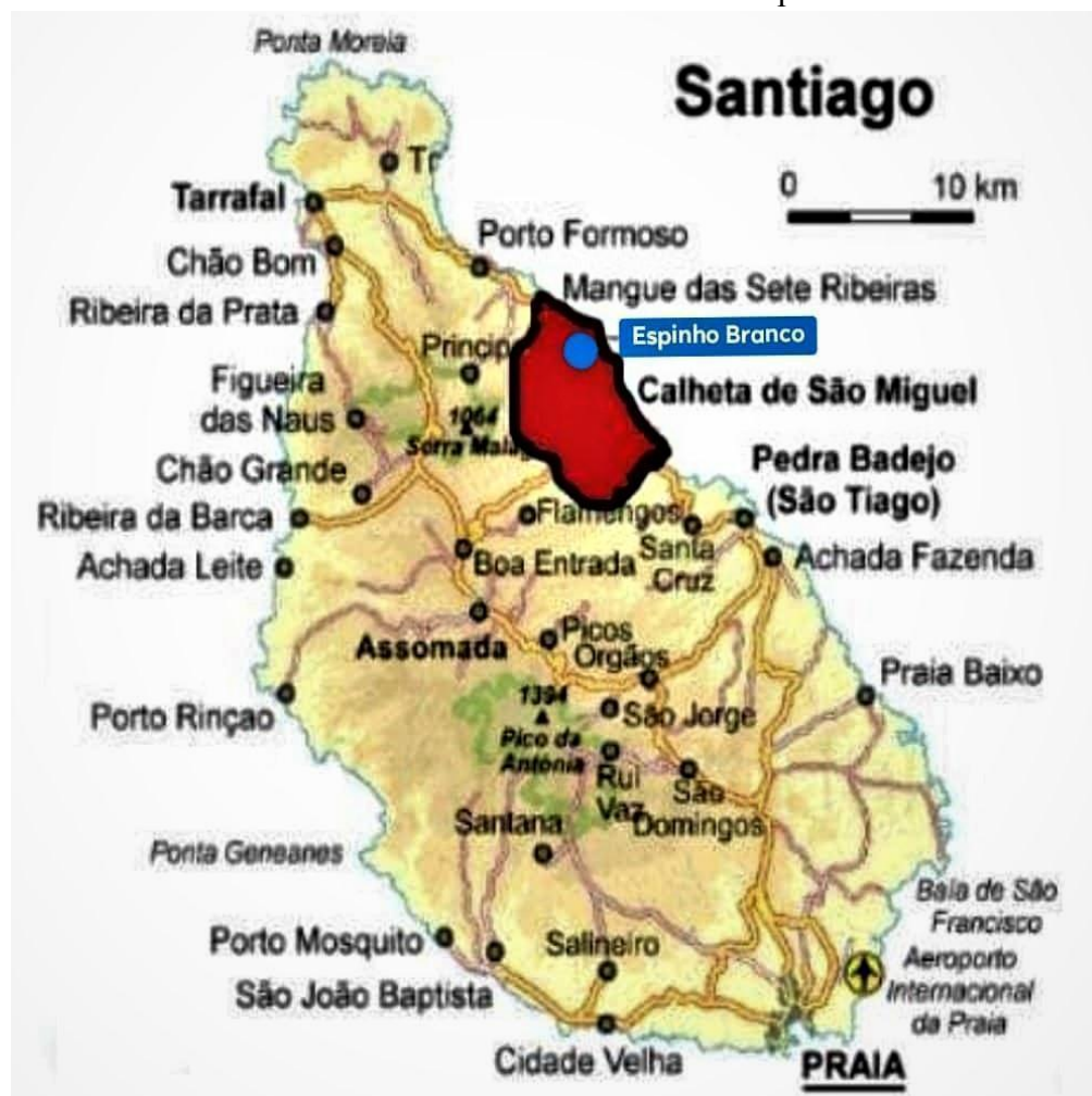
Figura 2: Mapa da localização geográfica do concelho de Calheta de São Miguel, onde fica situada a comunidade dos Rabelados de Espinho Branco.