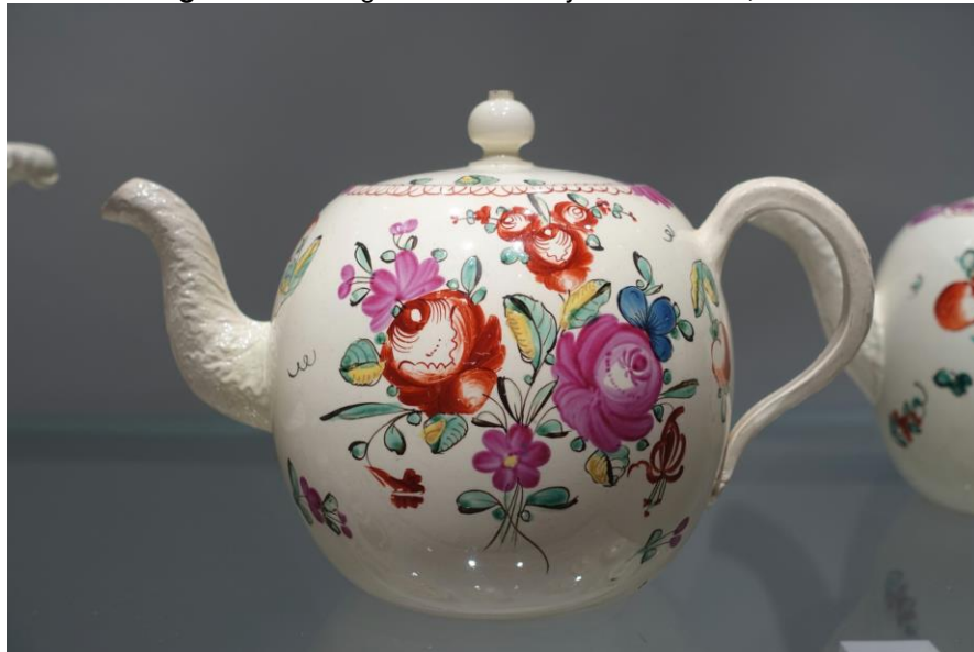
Figura 2 – Wedgwood & Bentley: Queenware, 1786.

Sendo assim, quando referimos ao termo Design, ao longo dessa pesquisa, nos referimos a atividade surgida na Primeira Revolução Industrial Inglesa de criação de mercadorias para produção no modelo industrial, e mesmo que outras interpretações para o termo sejam válidas, fugiriam do escopo do projeto.