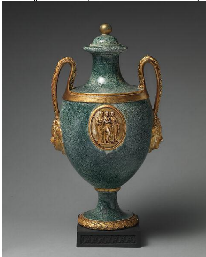
Figura 1 – Wedgwood & Bentley: vaso ornamental com duas alças, 1770.