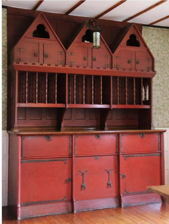
Figura 6 – Movél da Red House - Bexleyheath, Londres