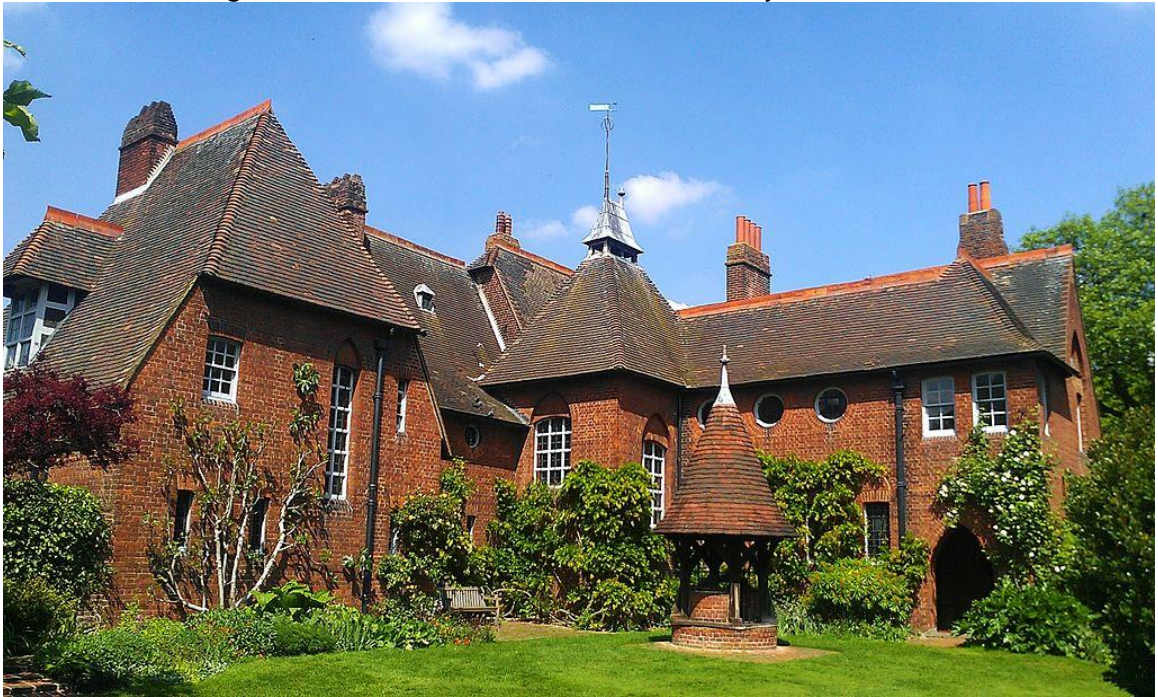
Figura 5 – Área externa da Red House - Bexleyheath, Londres