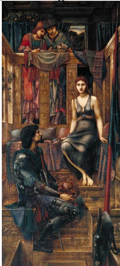
Figura 4 – King Cophetua and the Beggar Maid - Edward Burne-Jones - 1880

Os textos são atravessados por um otimismo romântico, ou seja apesar desse mundo(externo) apenas aparece como forma de atrapalhar a experiência individual ou, na melhor das hipóteses, ele se remove como obstáculo diante do ímpeto criativo do indivíduo. [...] Pensar que o homem, o indivíduo, é uma reserva infinita de possibilidades; e que então é possível reorganizar a sociedade a fim de destruir as instâncias opressoras para fazer emergir essas possibilidades e alcançar o progresso (Costa, ano, p.47)