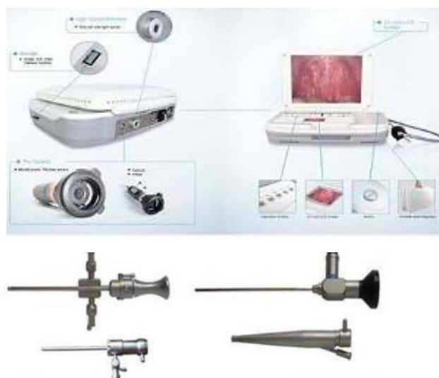
Figura 4 Kit de artroscopia veterinária.

Tanto endoscópios rígidos, quanto vídeoendoscópios são ferramentas fundamentais para exploração nasofaringorinoscopia da cavidade. O primeiro grupo é composto pelos rinoscópios, artroscópios (Figura 4) otoscópios, manuseados por meio da técnica anterógrada, iniciando da porção mais externa e rostral da cavidade nasal até limites caudais (Ohlerth; Scharf, 2007).