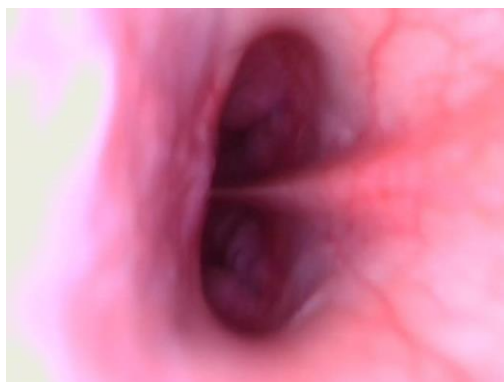
Figura 3 Coanas nasais por meio de exame nasofaringorinoscópico.

A nasofaringorinoscopia pode ser realizada por meio de endoscópio de fibra óptica rígida ou flexível. No entanto, o tamanho do animal e a dimensão da cavidade nasal podem impor algumas limitações ao exame, sendo necessário utilizar mais de um tipo de equipamento (Bedford, 1997; Ford, 1990).