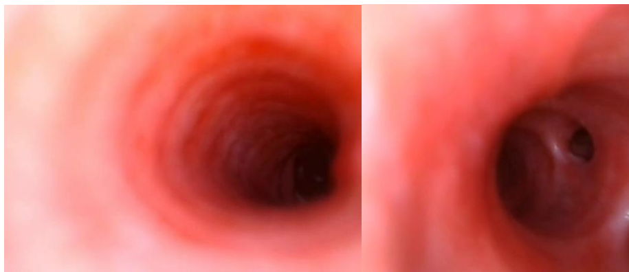
Figura 2 Traqueia por meio do exame traqueobroncoscópico.

pela sua orientação ser linear à da traqueia, ao contrário do brônquio principal esquerdo, que se lateraliza de forma mais pronunciada (Levitan; Kimmel, 2020).