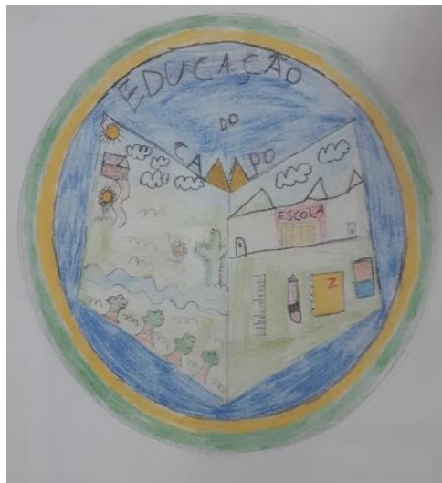
Imagem 03. Desenho vencedor do concurso