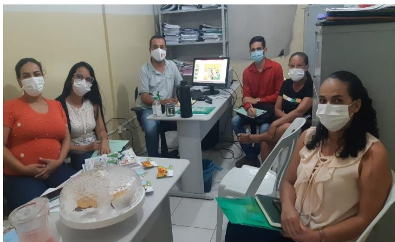
Imagem 01. Reunião do FOMECC com a coordenação da Educação do Campo

Atualmente, o município dispõe de uma coordenação específica para a Educação do Campo e o Fórum Municipal de Educação do Campo (FOMECC) composto por entidades da Sociedade Civil (Associações Comunitárias, Sindicato de Trabalhadores Rurais, Movimento de Mulheres Trabalhadoras Rurais e a Central de Cooperativas) e pelo Poder Executivo, atualmente representado pelas Secretarias de Saúde, Educação, Agricultura e Assistência Social. Os integrantes do FOMECC reúnem-se a cada sessenta dias e têm como principal objetivo monitorar e propor ações que fortaleçam a Educação do Campo no município.