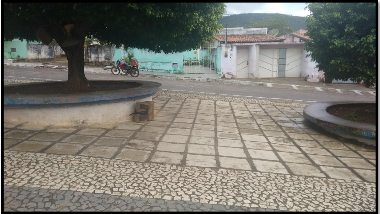
FIGURA 15. PRAÇA DO BAIRRO CORONEL JOAQUIM MALTA