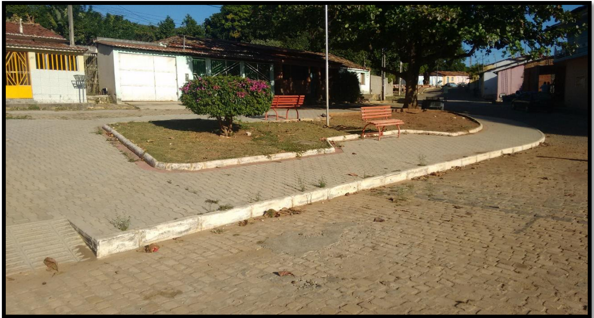
FIGURA 1. PRACINHA DO ALTO DA SANTA CRUZ