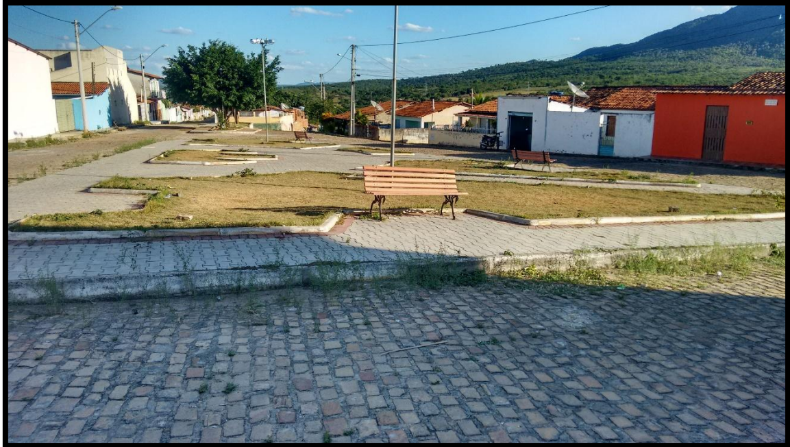
FIGURA 8. PRACINHA DA PECUÁRIA