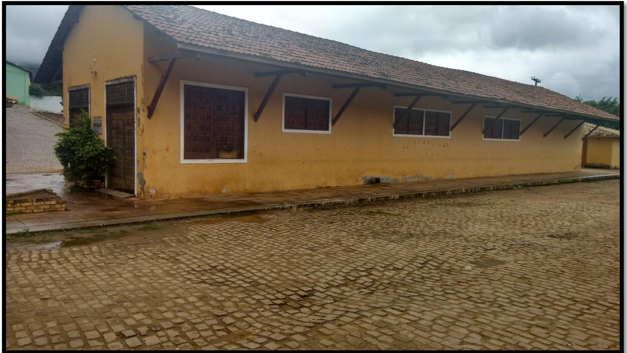
FIGURA 2. CENTRO CULTURAL