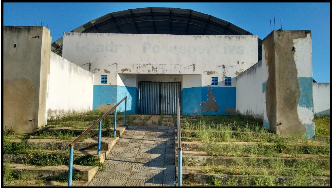
FIGURA 9. QUADRA POLIESPORTIVA