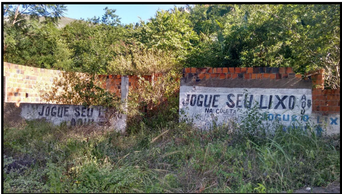
FIGURA 19. CONSTRUÇÃO INACABADA DE UM BALNEÁRIO NA CACHOEIRA DO PAULISTA