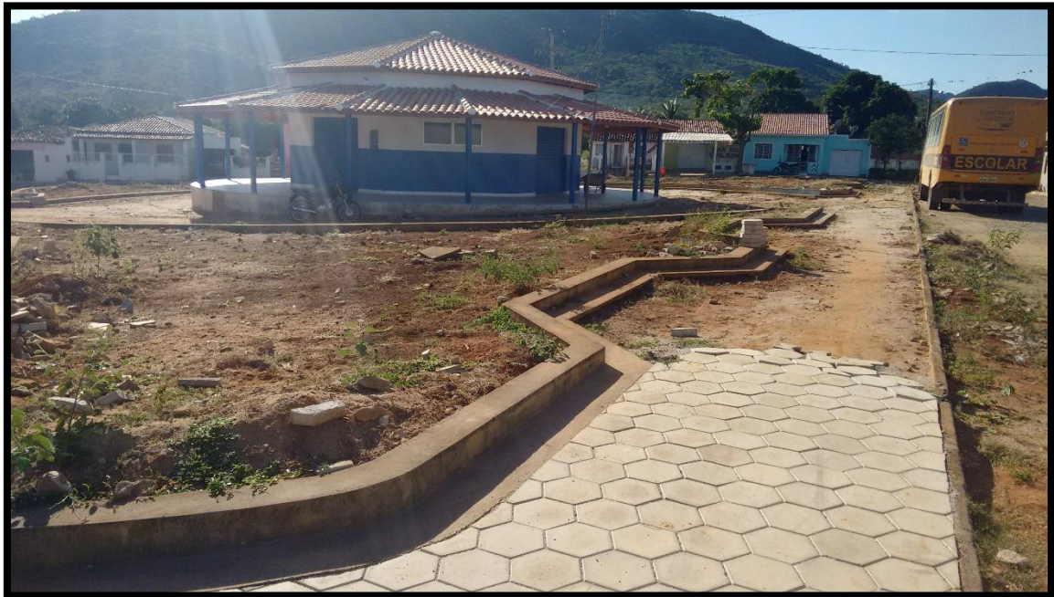
FIGURA 17. CONSTRUÇÃO DA PRAÇA DO POVOADO DO PAULISTA