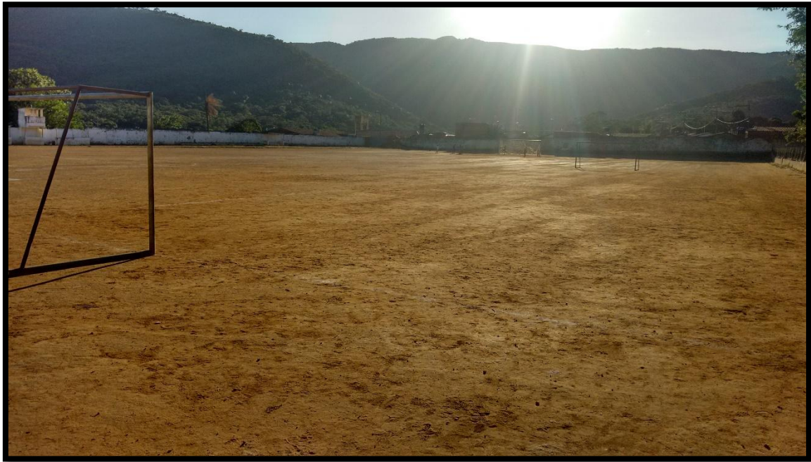
FIGURA 10. ESTÁDIO JOAQUIM CAETANO