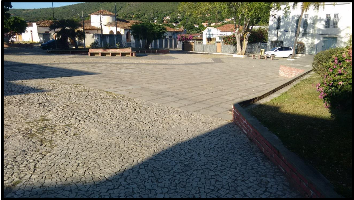
FIGURA 5. PRAÇA DA PREFEITURA