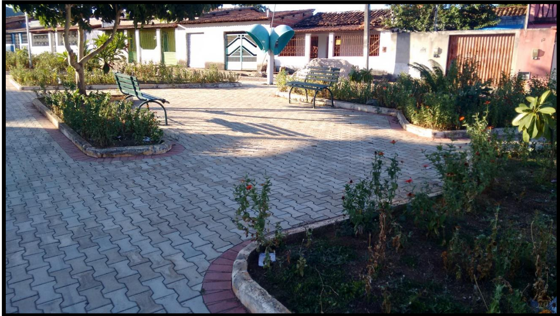
FIGURA 11. PRAÇA DO BAIRRO CARDOSO