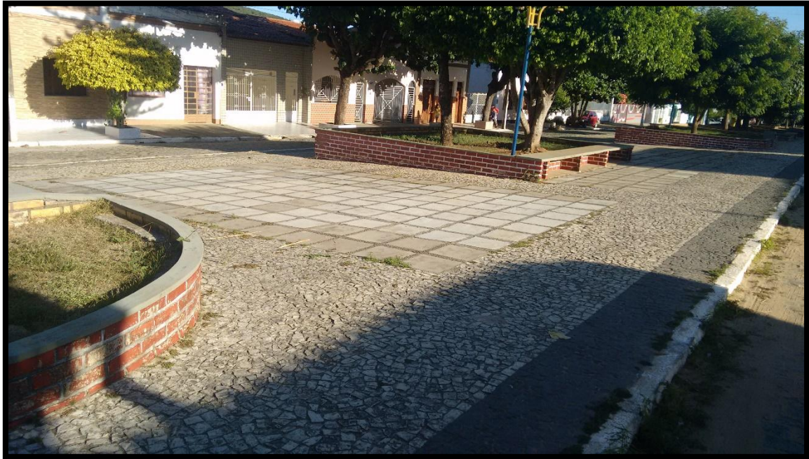
FIGURA 3. PRAÇA DA RUA MARECHAL DEODORO