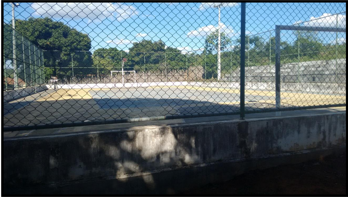
FIGURA 16. QUADRA DO POVOADO DO PAULISTA