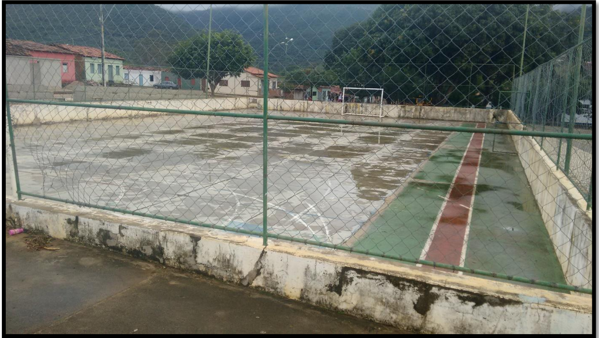
FIGURA 12. QUADRA DO BAIRRO CARDOSO