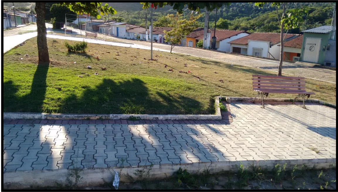
FIGURA 14. PRACINHA DA RUA CANTINO JOSÉ DOS SANTOS