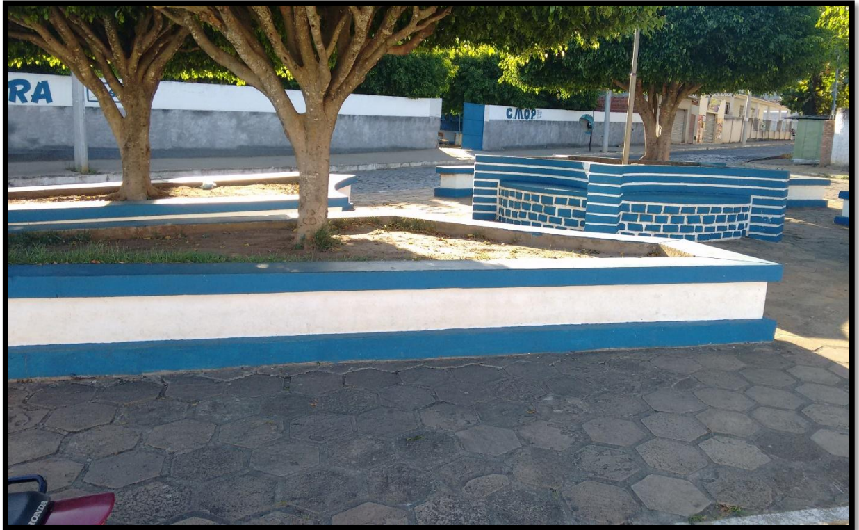
FIGURA 7. PRAÇA DA RUA NELSON CARNEIRO