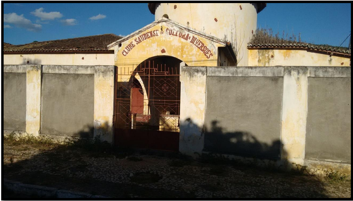
FIGURA 4. CLUBE SOCIAL SAUDENSE