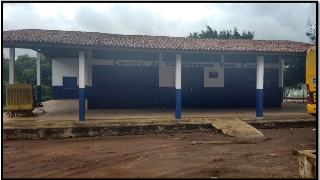
FIGURA 13. CENTRO DE CONVIVÊNCIA