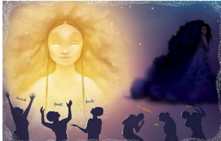
Figura 7 - Dia e Noite

Enquanto Dia era amada por todos, a Noite era desprezada pelas pessoas até o momento que ela se cansa e decide ir embora. Com o tempo as pessoas passaram a sentir falta da Noite e a notar como ela é tão importante quanto sua irmã Dia. Ambas as irmãs são essenciais na vida das pessoas, não existe um grau de superioridade entre elas.