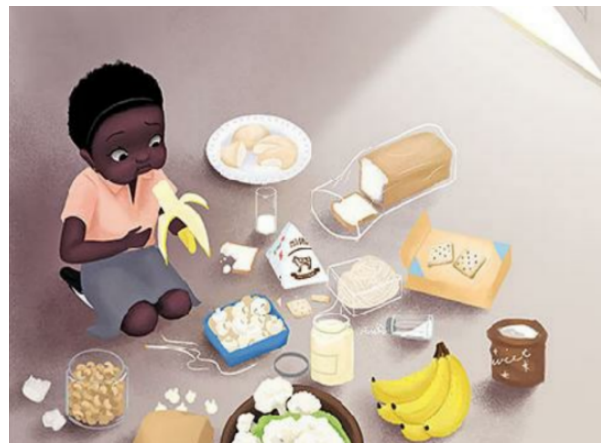
Figura 3 - De dentro para fora