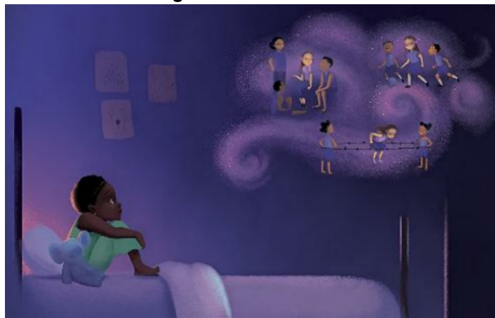
Figura 4 - Excluída

Por esse motivo, Sulwe apresentava dificuldade no que diz respeito à habilidade de socialização e conseqüentemente era difícil construir vínculos de amizade com as pessoas da sua escola, uma vez que, ela não se sentia bem em estar perto de quem não a aceitava da forma que ela é. Assim, foi possível observar como a identidade da protagonista no início da história estava constantemente atrelada ao que as pessoas ao seu redor diziam ao seu respeito.