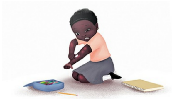
Figura 2 – Apagando meus traços

atitude. Ao chegar em casa tenta de tudo para clarear a sua pele, desde esfregar sua pele com uma borracha até comer alimentos mais claros na tentativa desesperada de mudar de dentro pra fora. Situações apresentadas nas seguintes ilustrações retiradas do livro: