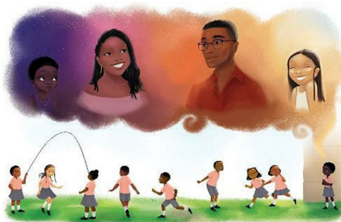
Figura 1 – Sou diferente