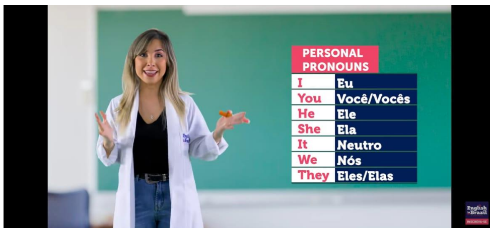
Figura 2 - Aprenda o VERBO TO BE! | Aula 01 - English in Brazil.