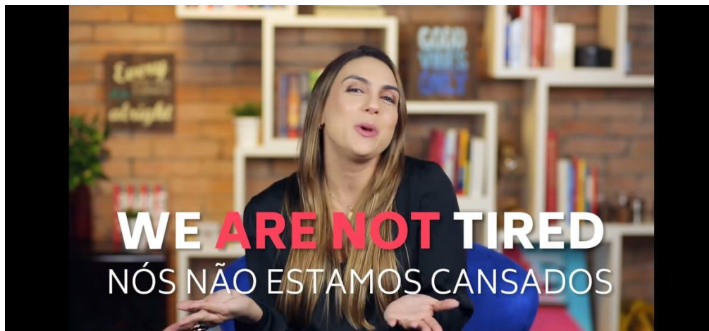
Figura 6 - Como usar o verbo TO BE na forma negativa