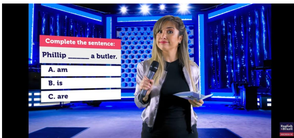
Figura 7 - Aprenda o VERBO TO BE! | Aula 01 - English in Brazil.