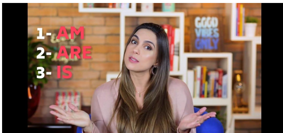
Figura 4 – Descomplicando de vez o verbo TO BE