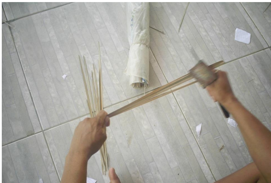
ARTESÃ RASPANDO A PALHA: UTILIZANDO A FACA E DEDO DE COURO