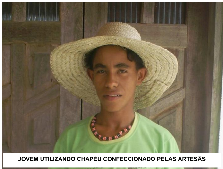
JOVEM UTILIZANDO CHAPÉU CONFECCIONADO PELAS ARTESÃS