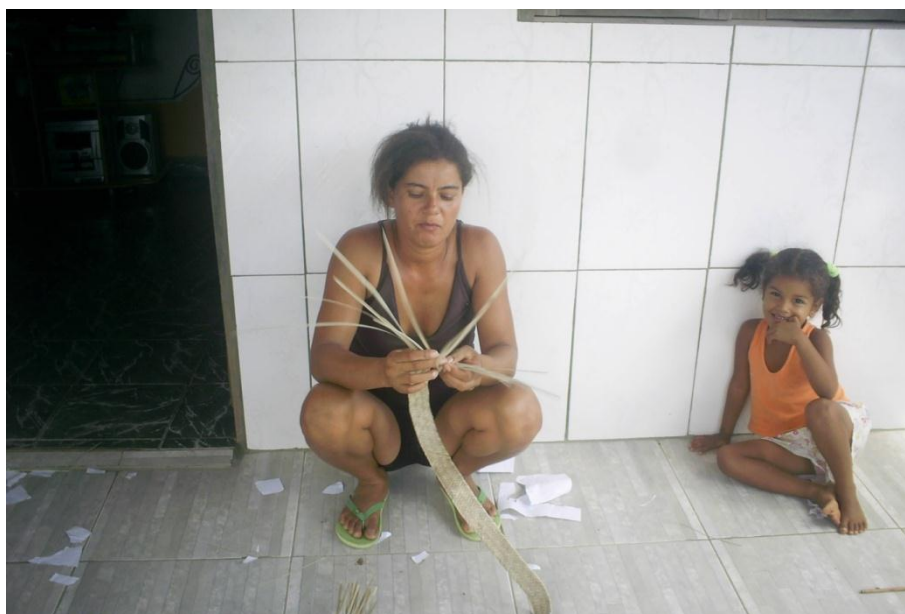
TRANÇADO EM DESENVOLVIMENTO