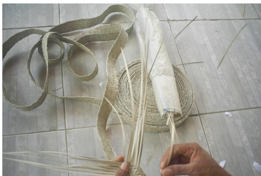
ARTESÃ CONFECCIONANDO O TRANÇADO