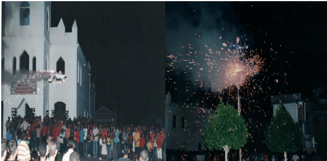
Figura 8: Avião voltando após acender o Judas e o Judas pegando fogo 22 .

iam estourando, começando de baixo para cima em meio aos gritos do público que vibrava a cada estouro. Veja a imagem a seguir de 1996.