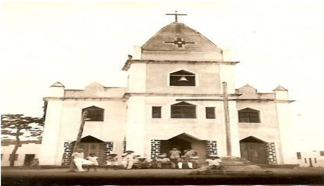
Figura 6: Igreja Matriz e cruzeiro, 1961 12 .

A primeira imagem mostra os moradores reunidos para festejar o padroeiro local, sendo possível vermos que estão do lado de fora do templo, pois a parte interna tinha desabado. No entanto, o desabamento não foi