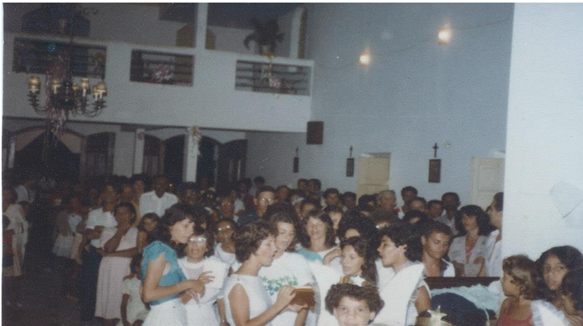
Figura 1: Coreto se apresentando na igreja, 1984 3 .

Em Pé de Serra, as pessoas não se dirigiam a uma festa religiosa apenas para partilhar de um ritual ou comemorar um santo, mas tinham interesses múltiplos que iam desde a fé, diversão, ao namoro. Isto se faz presente na Queima de Judas, momento no qual os jovens aproveitavam para flertar, pois é um dos, se não o maior, evento social em que reúne mais participantes, oportunidade de conhecer gente nova e até mesmo encontrar seus conterrâneos.