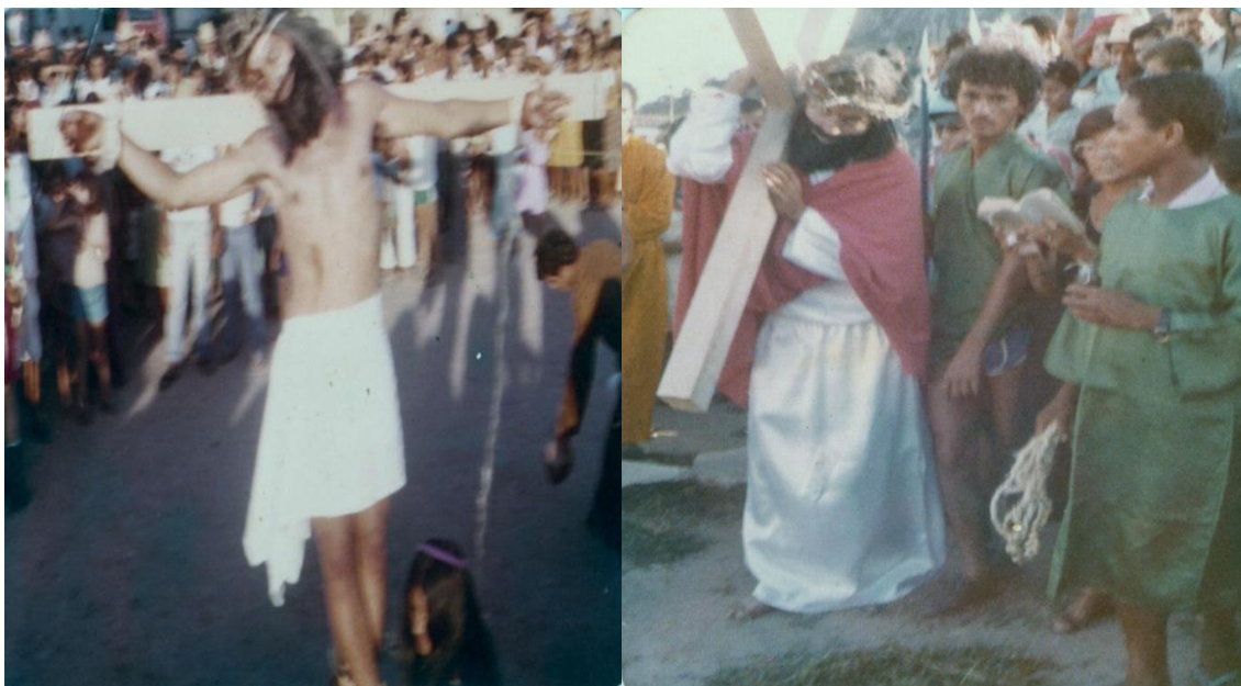
Figura 2: Moradores encenando a via sacra 8 .

Na quinta-feira, católicos participavam de mais um encontro na igreja matriz e se preparavam para o dia seguinte quando muitos iniciariam a sexta-feira santa subindo em procissão em uma das serras que existe na localidade, como pode ser observado, na figura 3, em 1960. O costume de subir a serra, segundo os entrevistados existe bem antes da existência da Queima de Judas, assim como a reunião das famílias na sexta para o almoço.