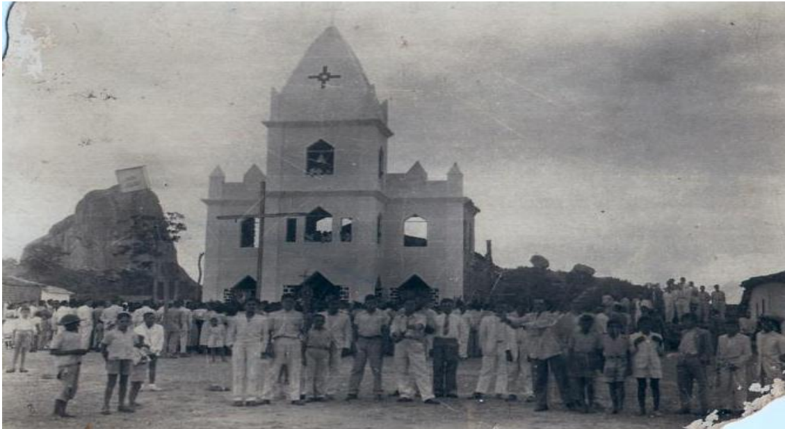
Figura 5: Festa de Bom Jesus em 1960 11 .