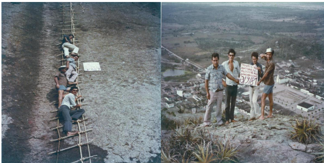
Figura 4: Subida e vista de cima da serra 10 .

Como é possível observar na imagem, apesar de não ser perceptível a dimensão da serra, havia um significativo número de participantes e a altura elevada ao analisarmos a forma inclinada como as pessoas estavam posicionadas, além da extensa área percebida abaixo delas. Isto fica ainda mais nítido se comparada à imagem abaixo de 1981.