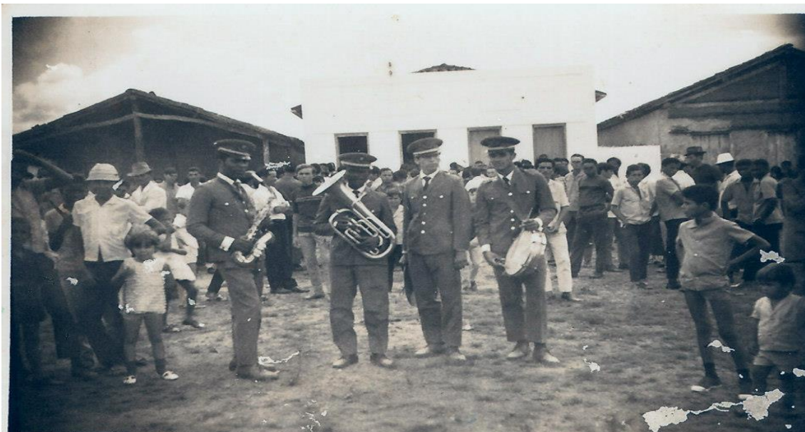
Figura 7: Filarmônica Lira 6 de Agosto, 1971 14 .

Nesta imagem, além de ser possível ver a maneira como os músicos se apresentavam todos fardados muito diferentes, do que vemos em imagem de 1996, quando os músicos se apresentam sem nenhuma distinção das outras pessoas, a não ser pelos instrumentos. Na imagem acima, também vemos o espaço físico da localidade na época, com casas bem simples, sem pavimentação, e participantes na maioria homens e algumas crianças.