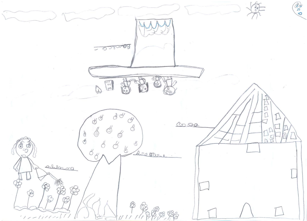
Figura 06: Desenho de aluno participante da pesquisa: presença de elementos socioculturais: mulher regando plantas, casa e bonecas.

que denota um visível sentimento de conformidade desses alunos em relação ao meio ambiente.