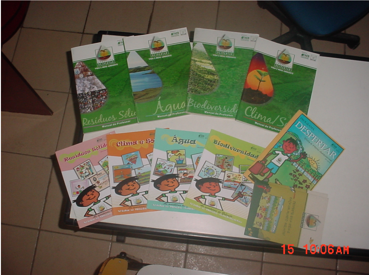
Figura 04: Material didático do Programa Despertar: Manual do Professor (acima) e cartilhas dos alunos e fôlderes (abaixo).

Dentro da proposta do projeto os professores costumam realizar aulas de campo com os seus alunos, percorrendo trilhas e visitando cachoeiras a fim de alertá-los sobre a importância de se conscientizarem que devem preservar e defender o meio ambiente, a partir do meio ambiente em que vivem, ou seja, se tornarem verdadeiros cidadãos preocupados e comprometidos com a preservação do seu ambiente natural e social.