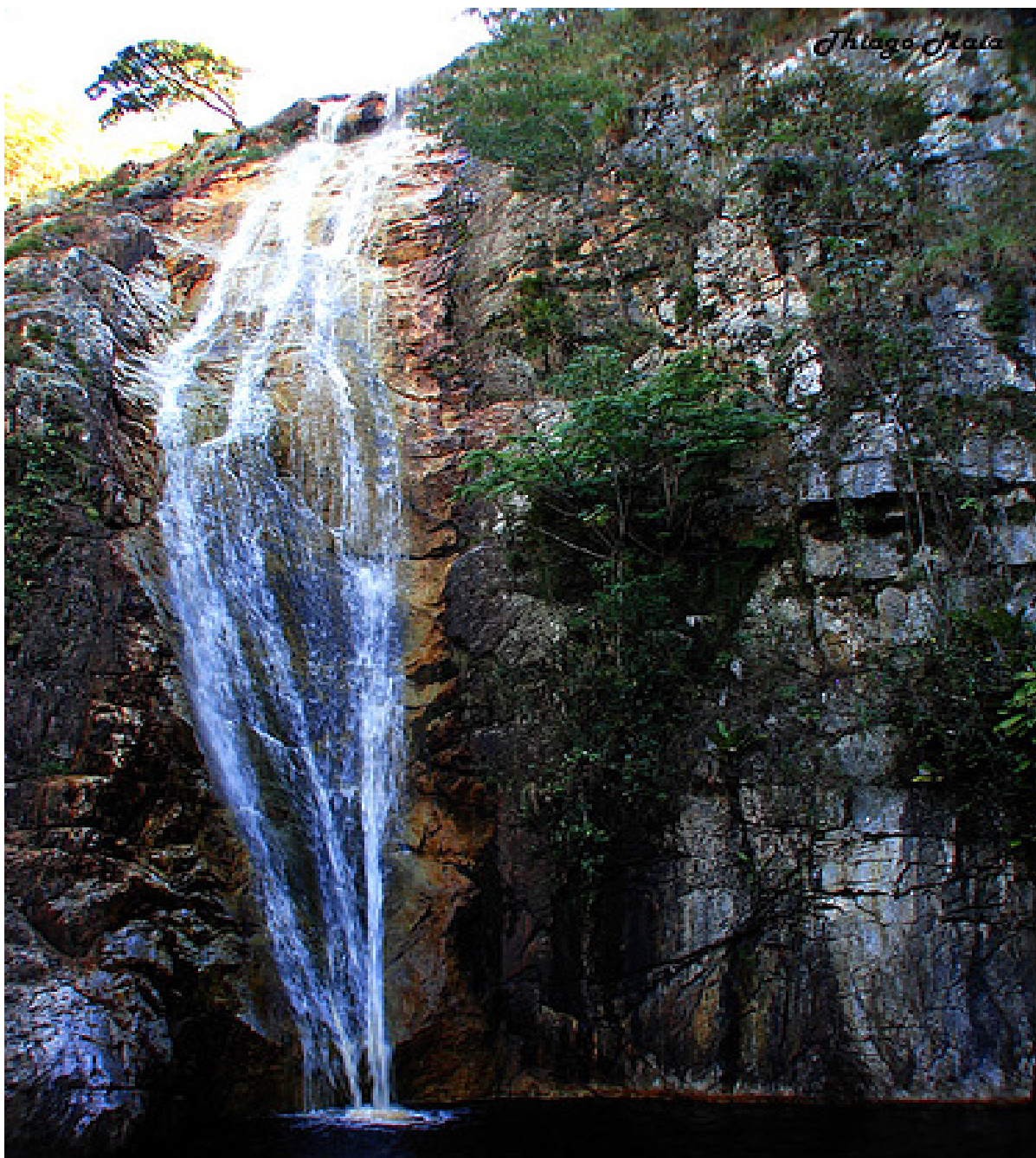
Figura 02: Cachoeira Vêu de Noiva, Itaitu, Jacobina - BA.

O Distrito de Itaitu é muito conhecido em toda a região, principalmente, pelas suas belezas naturais e, mais especificamente, pelas cachoeiras. São mais de 45 quedas d'água reunidas no Parque das Cachoeiras – criado pela Bahiatursa em parceria com a Prefeitura Municipal de Jacobina – e na Estância Ecológica Bandeirantes. Turistas, jacobinenses e também habitantes dos vários municípios da região costumam visitar o Distrito de Itaitu com frequência, a fim de desfrutar das opções de lazer que o lugar oferece e também para praticar esportes radicais, como trilhas, trekking e rapel.