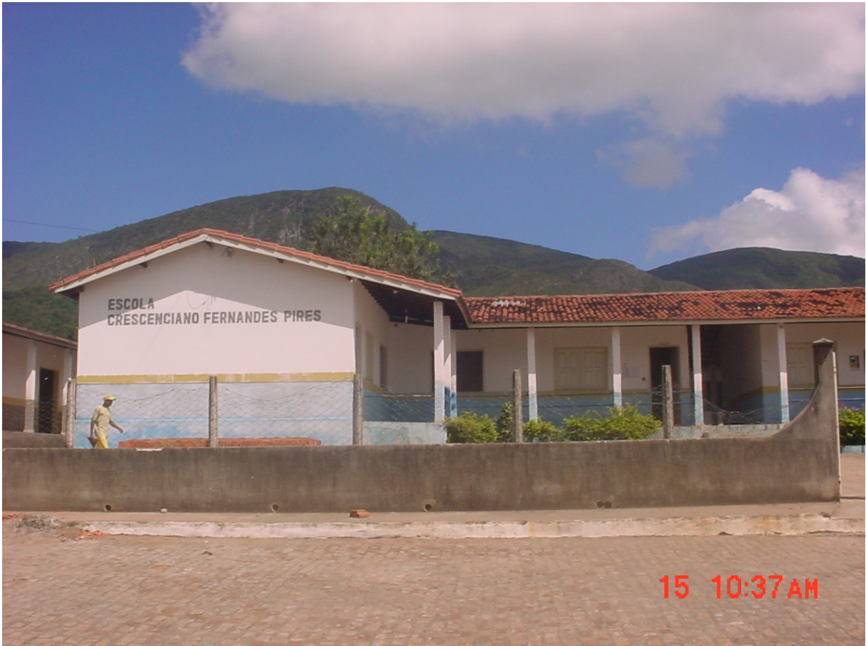
Figura 03: Colégio Municipal Crescenciano Fernandes Pires. Itaitu – BA.