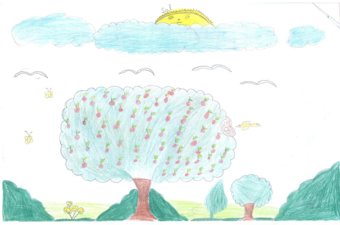
Figura 05: Desenho de aluno participante da pesquisa: visão naturalista do meio ambiente. Não há presença do ser humano ou outro elemento sociocultural.

Partindo, de fato, para a análise dos questionários, mais especificamente dos desenhos, observamos que dos 25 desenhos analisados, 8 não apresentaram nenhuma representação do ser humano ou de qualquer outro elemento sociocultural. É como se para as crianças autoras desses desenhos o ser humano não fizesse parte do meio ambiente e este correspondesse simplesmente à natureza, na sua forma mais naturalista possível. Essa visão pode representar também a percepção ilusória apontada por Merleau-Ponty (1999), refletindo a ilusão de uma natureza isenta de problemas, sejam eles naturais ou socioambientais.