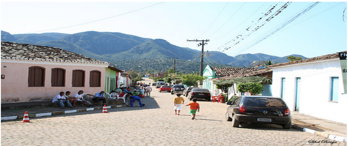
Figura 01: Vila de Itaitu – Ba.

Conforme informações do site local Ispiaki (2008), Itaitu em língua indígena significa pedra grande . Também conhecido como Riachão de Jacobina foi o primeiro distrito e se desenvolveu a partir da exploração do ouro nas encostas de suas serras. Atualmente, o distrito vive da agricultura de subsistência, principalmente, do cultivo da cana-de-açúcar para a fabricação de rapadura, do arroz, do feijão, do milho, de frutas e de verduras. O distrito apresenta ainda um enorme potencial para o Turismo Ecológico Sustentável, devido ao grande número de cachoeiras e serras espalhadas ao redor da região.