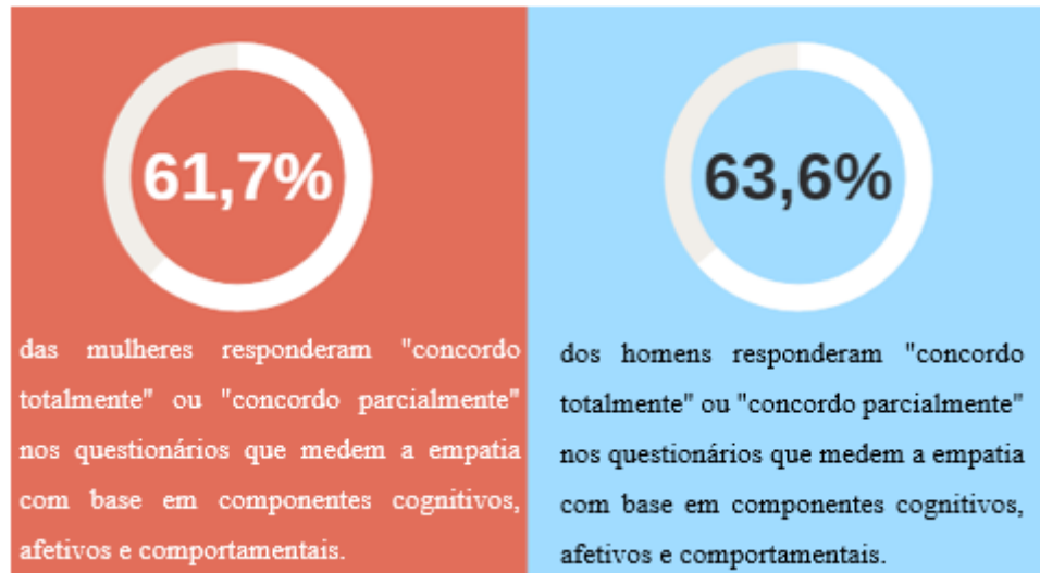
Figura 2 – Porcentagem de empatia cognitiva, afetiva e comportamental

Fonte: Elaborado pela autora. Dados da pesquisa.