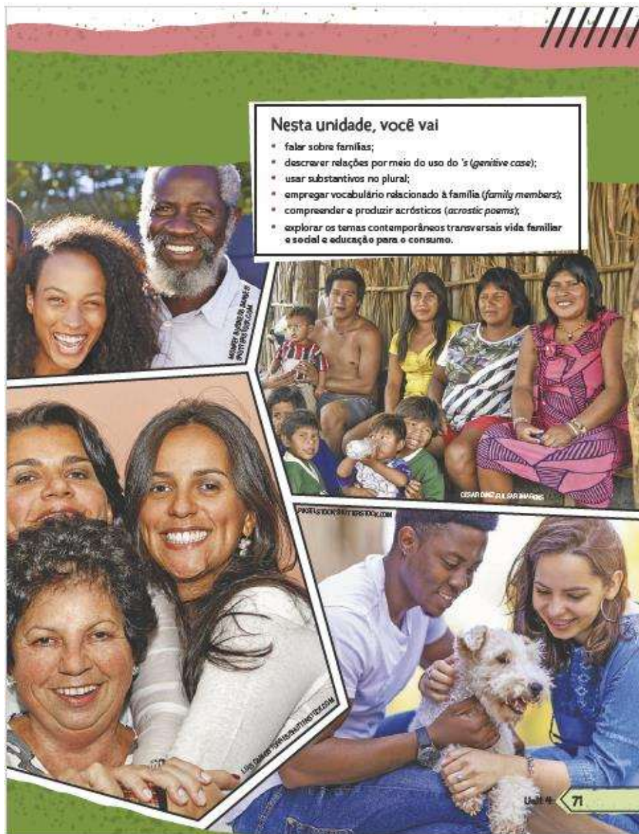
Figura 4 - Tipos de Família no livro didático do 6º ano.