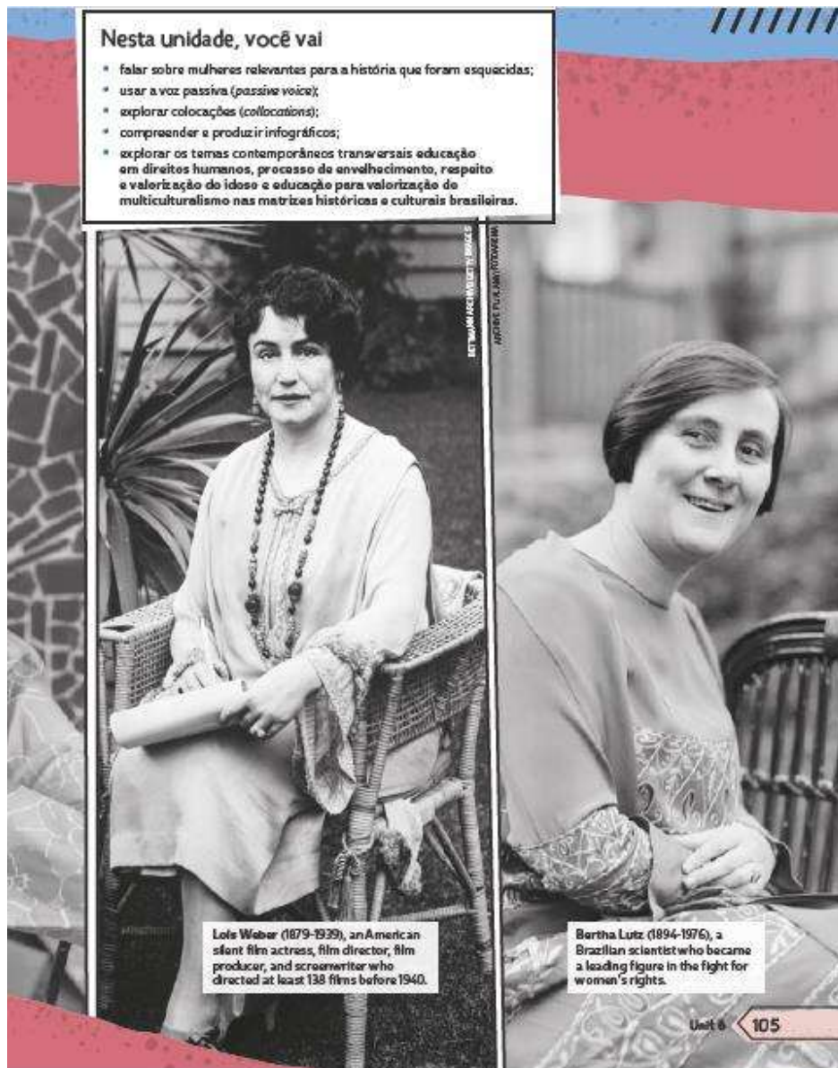
Figura 2 - Mulheres Importantes no livro didático do 9º ano.