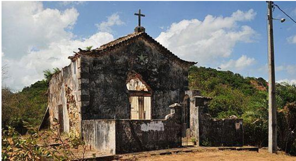
Figura 2: Ruínas da Igreja de Nossa Senhora de Guadalupe.

Fonte 2: JFreitas/ Bahiatursa. Disponível em: < http://guiadolitoral.uol.com.br/ilha_do_frades-2609_2009.html >. Acesso em: 01.11.13