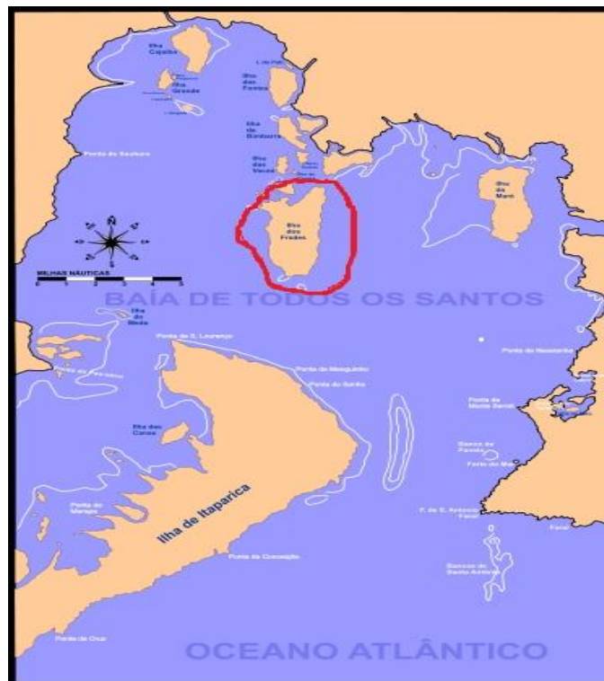
Figura 1: Localização da Ilha dos Frades - Baía de Todos os Santos.