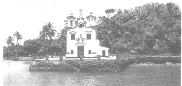
Igreja de Nossa Senhora de Loreto

Destacam-se como monumentos na Ilha do Frade a Igreja de Nossa Senhora do Loreto, do século XVIII e as ruínas da Igreja de Nossa Senhora de Guadalupe, anterior ainda, do século XVII.