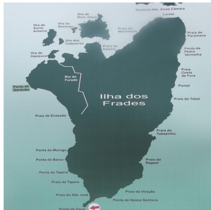
Fonte 5: Painel de sinalização localizado em Ponta de Nossa Senhora.

Esses passeios são promovidos por agências de receptivo da cidade de Salvador, como a Cassi e a Privêtur. Com onze anos e dezoito anos de mercado respectivamente, estas empresas ofertam o pacote que garante visitação de uma