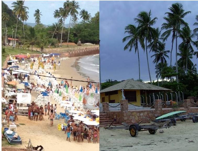
Figura 7: Barracas de praia de Ponta de Nossa Senhora, e restaurante de Praia da Costa.

Fonte 8: http://www.bahianoticias.com.br/principal/noticia/126168-ilha-dos-grades-sofre-apos-derrubada-de-barracas-de-praia.html