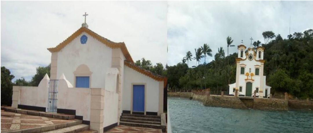
Figura 3: Igrejas de Nossa Senhora de Guadalupe e Nossa Senhora do Loreto. Atrativos Culturais.

Tombada pelo Município como Reserva Ecológica em 1982, a ilha apresenta-se com formato de um triângulo irregular com quinze pontas. Destacando-se as praias do Loreto, Viração, Tobar e Costa de Fora, e Ponta de Nossa Senhora sendo esta a mais visita pelos passeios de escuna, com algumas barracas vendendo bebidas e pratos oriundos da pesca.