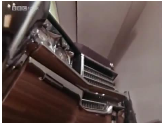
Figura 3: o automóvel enquanto estrutura narrativa

Crash! é um filme demasiadamente estranho para um público não especializado: não apresenta uma sequência de títulos; não há créditos e não há explicação de quem seria Ballard; e é apresentado pela BBC enquanto documentário – no entanto, sabemos que esse é nada mais, nada menos, que uma extensão de uma narrativa anterior. Aparte das demais características do filme, ao qual não iremos nos alongar, é a perspectiva da própria geometria do carro que estabelece um caminho distinto para uma possível narrativa.