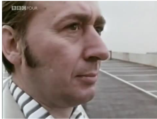
Figura 2: olhar de Ballard T... em Crash!

fora da perspectiva do tempo narrativo de alguém que irá falar algo, ao passo que ruídos dissonantes são introduzidos.