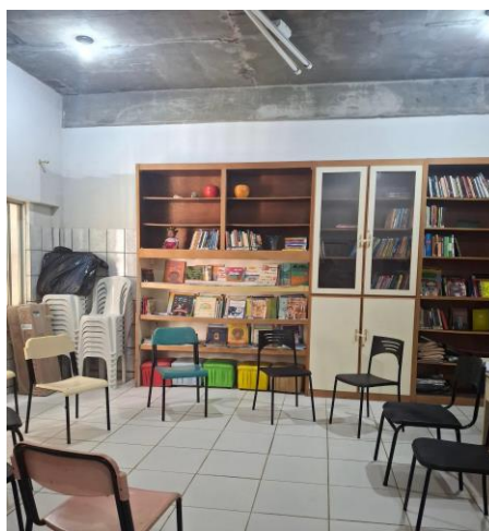
Figura 1 - Espaço de mediação

Esses espaços recebem recursos financeiros por meio de editais. Atualmente os editais surgem através da Fundação Gregório de Matos 4 e a Fundação Pedro Calmon 5 . Recentemente a biblioteca conseguiu passar em um edital, e desde então recebe apoio financeiro para custear as despesas do espaço.