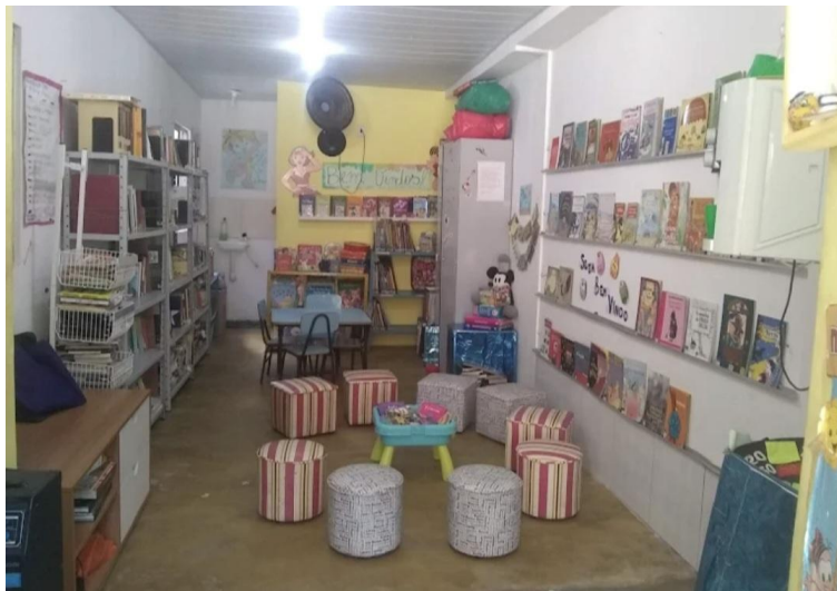
Figura 5 - Cantinho da leitura, espaço para se sentar e relax