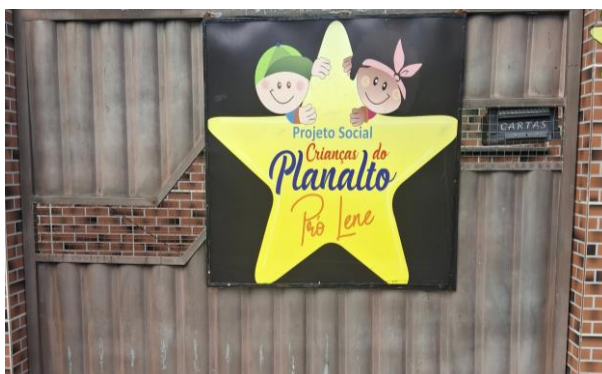
Figura 12 - Entrada da casa onde fica a biblioteca com o nome do projeto