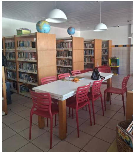
Figura 8 - Estantes com os livros organizados e sala de leitura