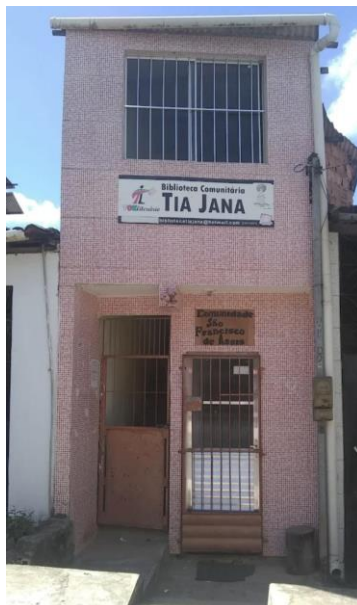
Figura 7 - Fachada da Biblioteca Comunitária