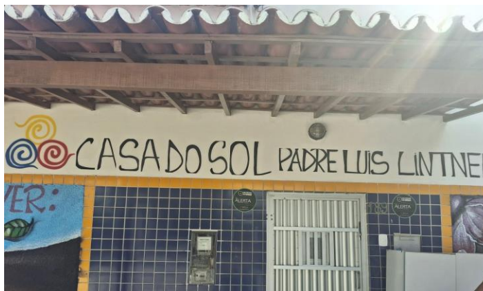
Figura 10 - Entrada da escola onde fica a biblioteca