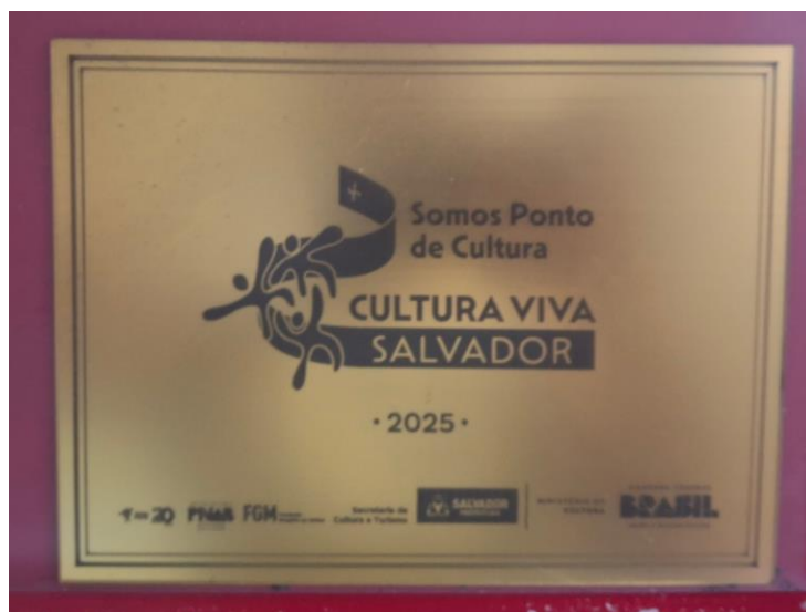
Figura 13 - Prêmio de Ponto de Cultura