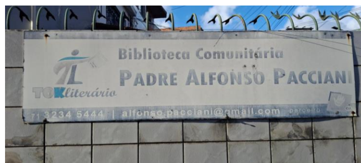
Figura 3 - Fachada da Biblioteca Comunitária