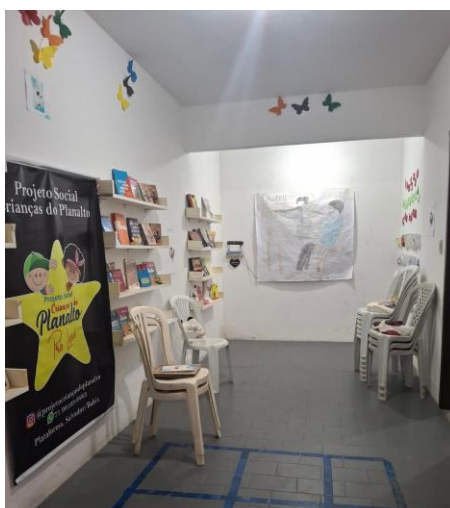
Figura 14 - Espaço de Leitura