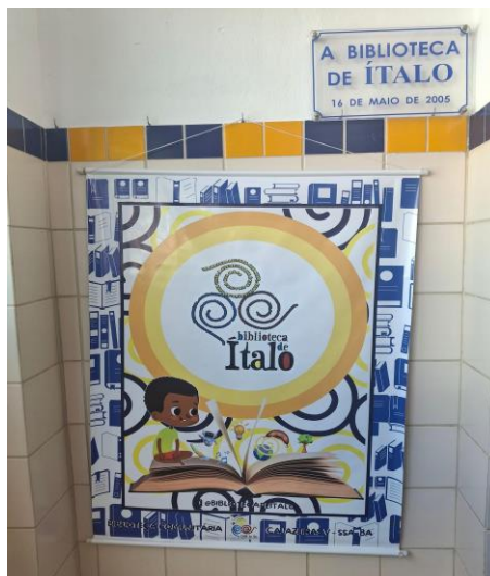
Figura 9 - Entrada da Biblioteca