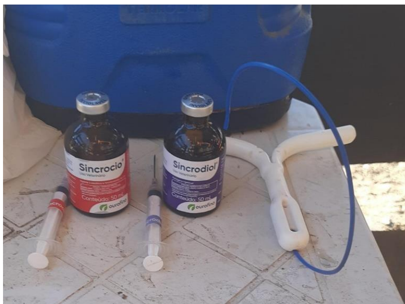
Figura 1: Hormônios utilizados do D0.

A abertura do protocolo de IATF é chamado de Dia 0 ou D0, e consiste na administração de benzoato de estradiol (BE) por via intramuscular, e inserção do implante intravaginal de progesterona (P4), a fim de gerar atresia dos folículos dominantes e induzir o crescimento de uma nova onda folicular. Em fêmeas que apresentam corpo lúteo, o uso da prostaglandina (PGF2 \alpha ) pode ser associado a fim de gerar luteólise.