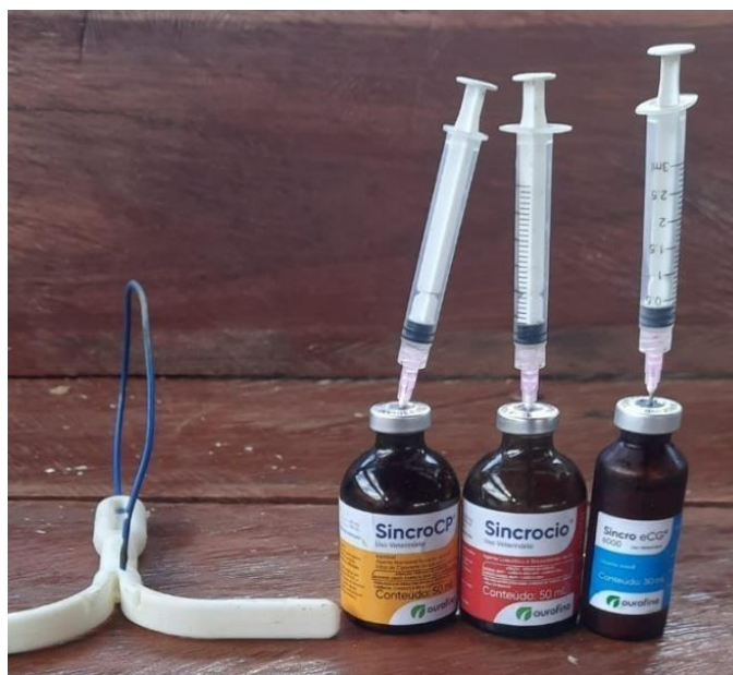
Figura 2: Hormônios utilizados no D8.