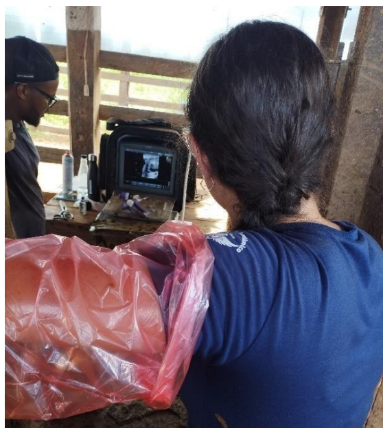
Figura 5: Realização de diagnóstico gestacional.

Ao identificar as fêmeas gestantes, o diagnóstico gestacional permite que o produtor se organize para a chegada dos nascimentos. Em fêmeas que foram inseminadas este diagnóstico deve ser realizado o mais cedo possível, a fim de identificar e separar os animais prenhes. A identificação das fêmeas vazias também é importante, pois estas podem ser submetidas a uma nova ressincronização, repasse com o touro, ou mesmo destinadas ao descarte.