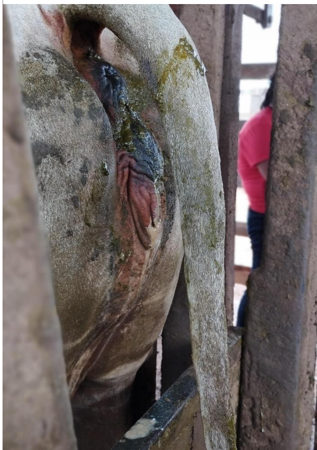
Figura 6: Observa-se a presença de exsudato mucopurulento característico de quadros de vaginite